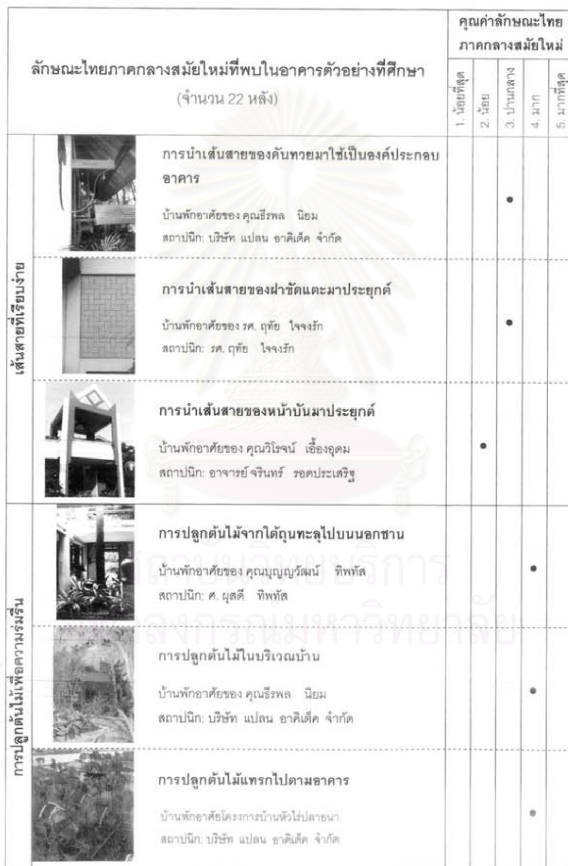
ตารางที่ 6.1 แสดงการสรุปผลเกี่ยวกับคุณค่าลักษณะไทยภาคกลางสมัยใหม่