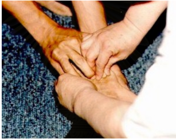
ภาพประกอบที่ 3 : การนวดกดจุด

ปัจจุบันนี้ มีผู้พิการทางสายตาเป็นจำนวนมากที่ต้องดิ้นรนช่วยเหลือตนเอง บางคนก็ไปขอทาน ขายล็อตเตอรี่ และบางคนก็ยึดอาชีพเป็นหมอนวด ซึ่งการเป็นหมอนวดนั้นสายตาผู้คนมักมองว่าจะนวดได้จริงหรือไม่? จะเรียนได้อย่างไรในเมื่อตาก็มองไม่เห็น