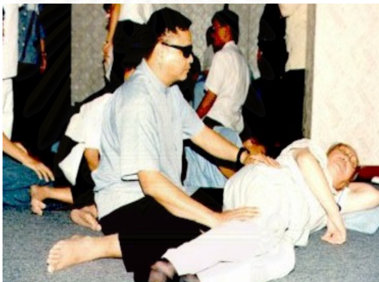
ภาพประกอบที่ 4 : การนวดตัว

สถาบันการแพทย์แผนไทย พบว่า ผู้ที่ตาบอดจากอุบัติเหตุ สามารถเป็นหมอนวดที่ดีได้ ถ้าเขายอมรับสภาพความไม่สมบูรณ์ได้ และถ้าผู้พิการทางสายตามีความรู้พื้นฐานทางด้านวิทยาศาสตร์ ที่เกี่ยวกับชีววิทยา หรือกายวิภาคแล้ว ก็ยังเป็นผลดี