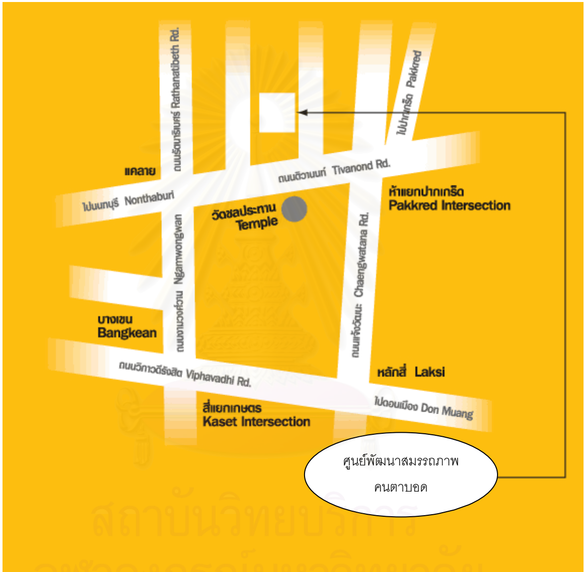
ภาพประกอบที่ 8 : แผนที่ศูนย์พัฒนาสมรรถภาพคนตาบอด