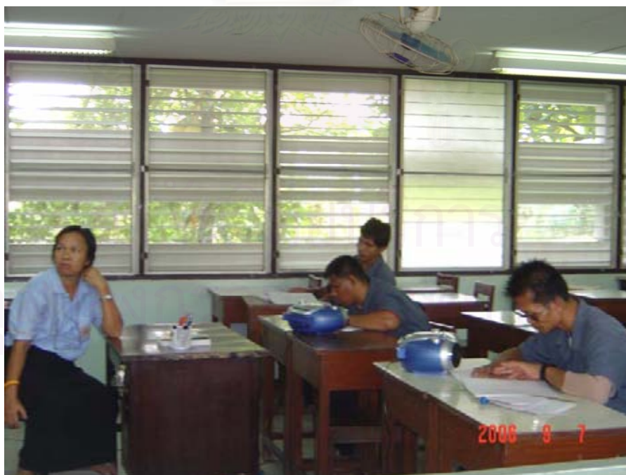
ภาพประกอบที่ 12 : การสอนการใช้อักษรเบรลล์