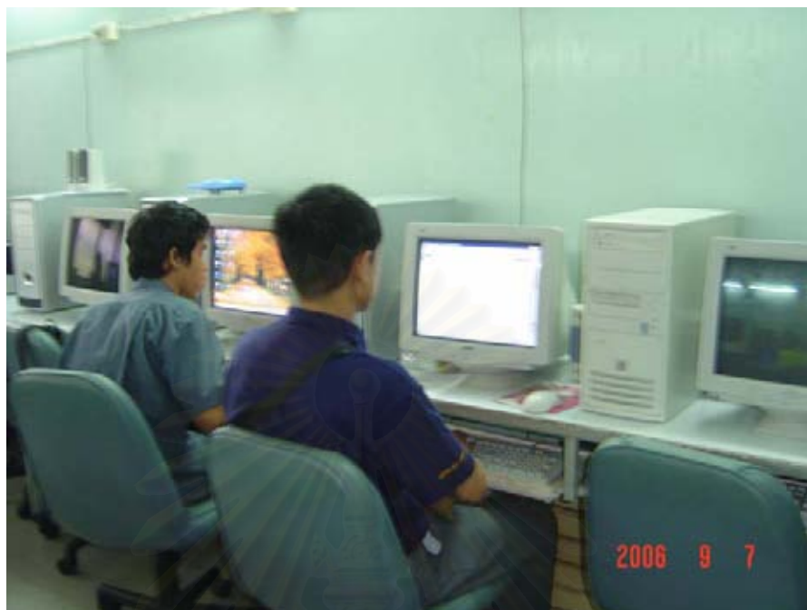
ภาพประกอบที่ 11 : การสอนคอมพิวเตอร์ที่ศูนย์พัฒนาสมรรถภาพคนตาบอด