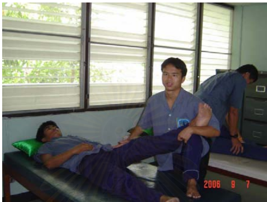
ภาพประกอบที่ 9 : การฝึกสอนนวดที่ศูนย์พัฒนาสมรรถภาพคนตาบอด