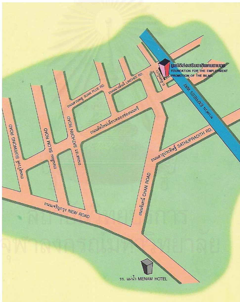
ภาพประกอบที่ 5 : แผนที่มูลนิธิส่งเสริมอาชีพคนตาบอด