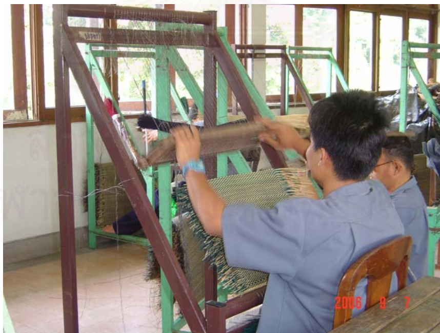
ภาพประกอบที่ 10 : การฝึกสอนทอเสื่อที่ศูนย์พัฒนาสมรรถภาพคนตาบอด