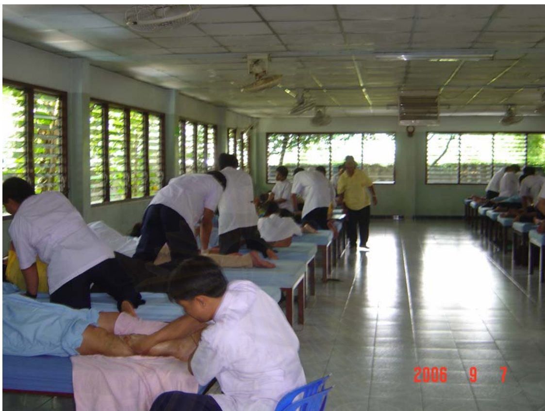
ภาพประกอบที่ 6 : การฝึกสอนการนวดที่มูลนิธิส่งเสริมอาชีพคนตาบอด