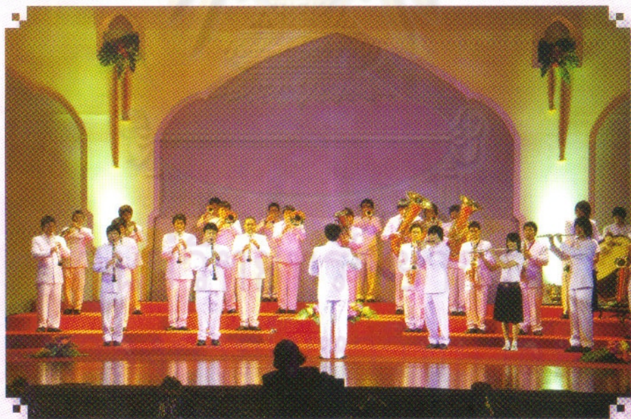
การบรรเลงโยธวาทิต เพลงสรรเสริญเสื่อป่า พระนิพนธ์ใน สมเด็จพระเจ้าบรมวงศ์เธอ เจ้าฟ้าบริพัตรสุขุมพันธุ์ กรมพระนครสวรรค์วรพินิต