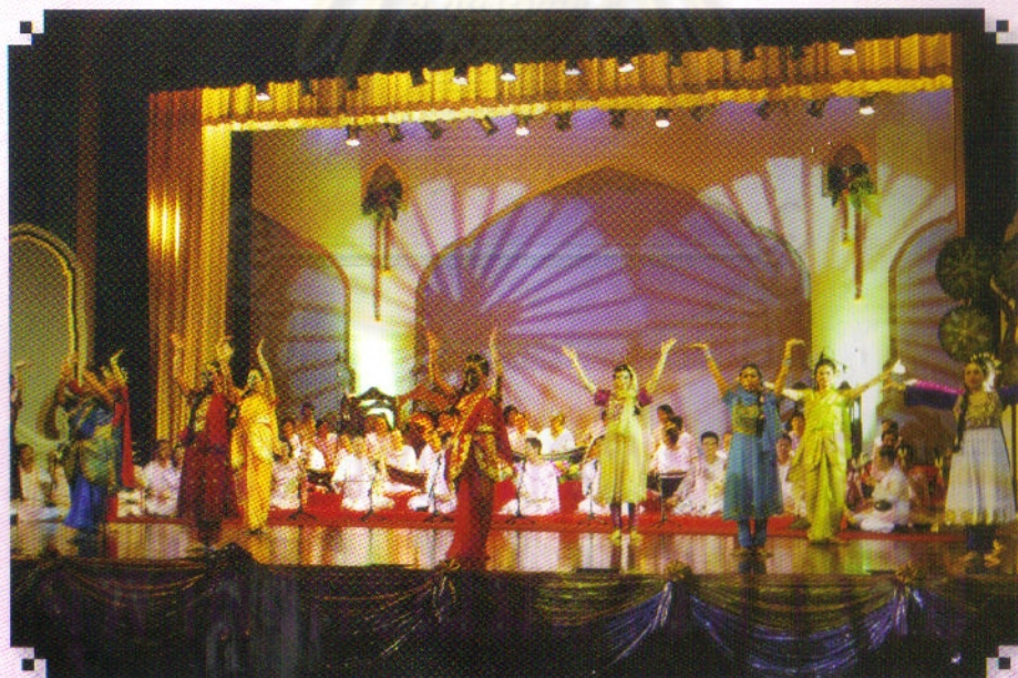
สมเด็จพระเทพรัตนราชสุดาฯ สยามบรมราชกุมารี ทรงขอตั้งเพลงแขกชาว เถา ออกระบำนางโคปี ร่วมกับวงสายใยจากมจรี ในการแสดงปีพาทย์ตีกด้าบรرف วันที่ ๒๖ มีนาคม ๒๕๕๒