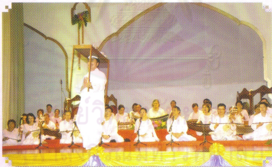
“มา อยู่ที่จุฬาฯ มุ่งมาหางาน จิตใจสราญชายถ้วนานา” ๑๗