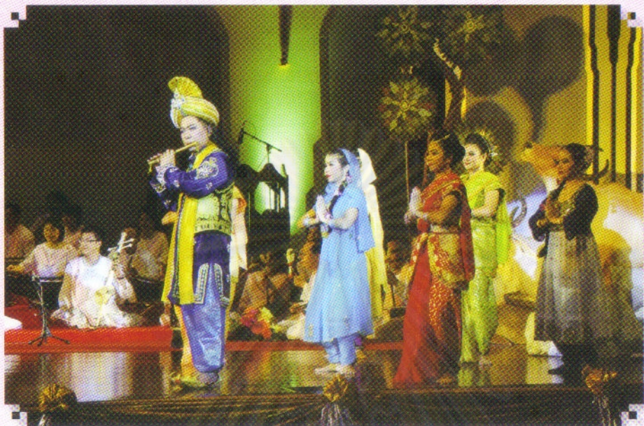
“พรั่งพร้อม สาวสองค้ นางโคปี ผู้ภักดี โควินทะ อติศร” ๑๖