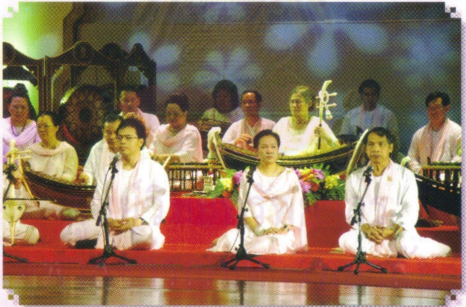
สมเด็จพระเทพรัตนราชสุดาฯ สยามบรมราชกุมารี ทรงระนาดเอกร่วมกับวงดนตรีบ้านปลายเนิน และทรงซออด้วงร่วมกับวงดนตรีสายโขนจามจุรี ในการแสดงปีพาทย์ศึกคำบริพัทธ์ วันที่ ๒๖ มีนาคม ๒๕๕๒