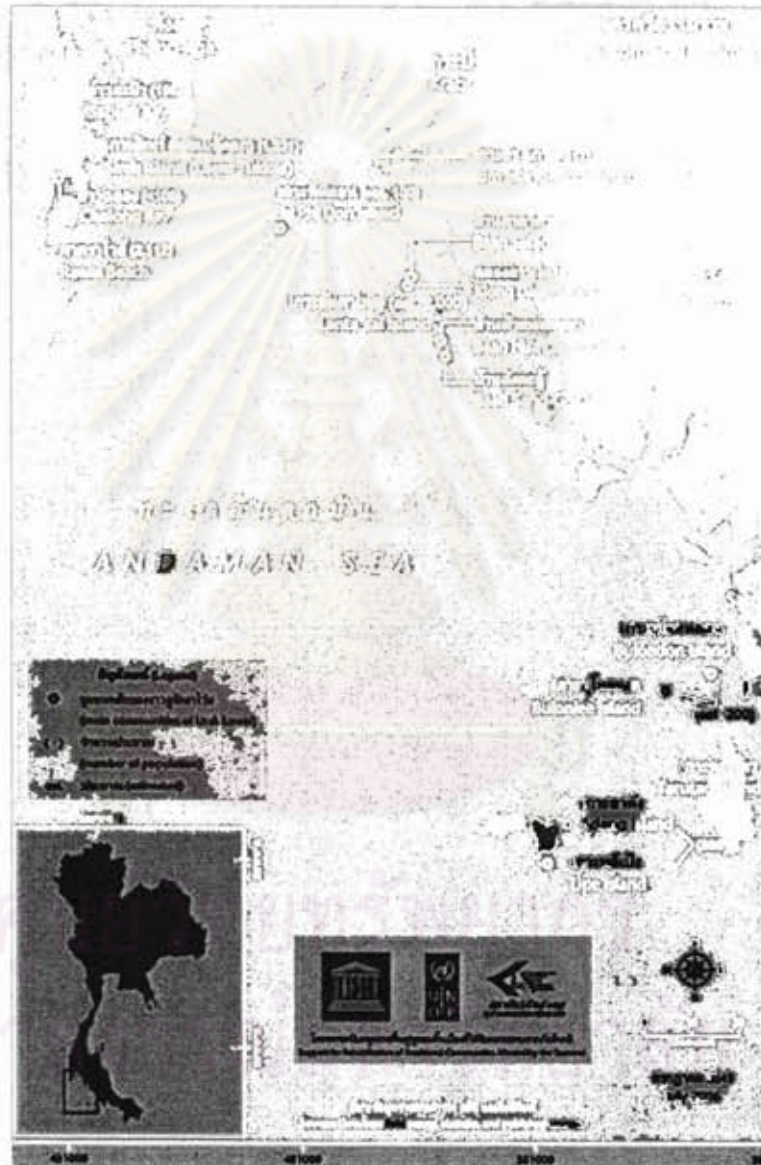
ภาพที่ 2.1 แสดงการตั้งถิ่นฐานและจำนวนของชาวอุรักลาไวย์

ชาวเลกลุ่มอุรักลาไวย์ ตั้งถิ่นฐานอยู่บนเกาะภูเก็ต บริเวณหาดราไวย์ และบ้านสระบัว จังหวัดกระบี่ บริเวณเกาะพีพี (แหลมตง) เกาะจำ เกาะปู้ เกาะลันตาใหญ่ ซึ่งกระจายกันอยู่บริเวณบ้านคลองดาว บ้านโนไร่ บ้านปอแหน และเกาะโหลง จังหวัดตรัง เรื่อยลงไปถึงเกาะอาดัง เกาะหลีเป๊ะ เกาะราวี จังหวัดสตูล ชาวเลกลุ่มนี้ใช้ภาษาอุรักลาไวย์เป็นภาษาพูด