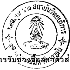
ตารางที่ 3.10 สัดส่วนการรับช่วงมูลค่าตัวส่งออก (เกินร้อยละ 1) จำแนกตามประเภทสินค้า