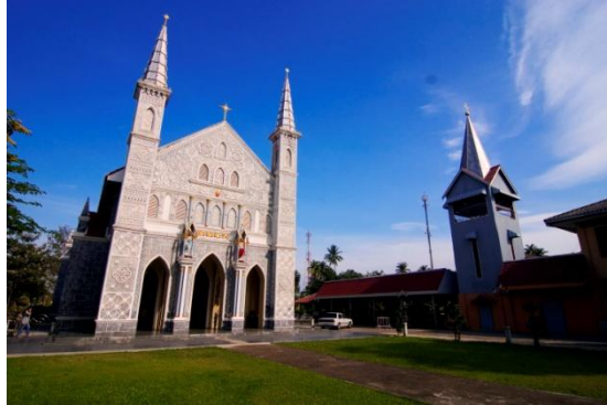
ภาพที่ 3 โบสถ์พระคริสตฤทัย วัดเพลง

วัดเพลง เดิมชื่อ บ้านเพลง บ้านเพลงนี้เป็นหมู่บ้านป่า ในสมัยก่อนเส้นทางคมนาคมลำบากไม่ว่าจะโดยทางน้ำหรือทางบก มีหมู่บ้านเป็นหย่อมๆ มีนักร้องร้องเพลงเพลงมาลัยกันอย่างสนุกสนาน มีพ่อเพลง แม่เพลงร้องแก้มันจะเป็นงานสงกรานต์หรืองานอื่น พ่อเพลงแม่เพลงจะร้องสู้กัน ได้ 3 วัน 3 คืน หรือ 7 วัน 7 คืน โดยไม่มีแพ้ชนะกันจึงได้ชื่อว่า “บ้านเพลง”