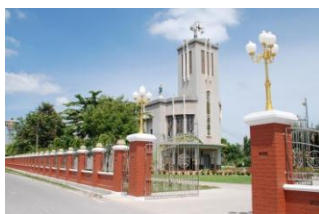
ภาพที่ 7 โบสถ์นักบุญอันตน โคมมดตะนอย

ปัจจุบันโบสถ์หลังนี้ได้มีความเจริญเป็นอย่างมาก ชุมชนคาทอลิกที่อยู่อาศัยบริเวณรอบโบสถ์นี้เป็นชุมชนชาวลาวและชุมชนไทยทรงดำที่นับถือศาสนาคริสต์ที่มีความเข้มแข็งและเป็นหนึ่งเดียวกัน อีกทั้งได้มีการก่อตั้งอนุสรณ์นักบุญอันตนไว้ภายนอกโบสถ์เพื่อให้นักเดินทางหรือผู้ที่มีความเลื่อมใสได้มาเคารพสักการะตามความศรัทธาโดยการจุดประทัด เนื่องจากชุมชนคาทอลิกมีความเชื่อกันว่าการจุดประทัดเป็นการแสดงออกถึงความเลื่อมใสศรัทธาในตัวของท่านนักบุญ ซึ่งในปี พ.ศ.2540 ที่ผ่านมาทางโบสถ์ได้มีการจัดให้ฉลองอายุครบ 100 ปีแห่งการก่อตั้งกลุ่มคริสตชน (วัดนักบุญอันตน, 2555)