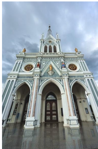
ภาพที่ 1 อาสนวิหารแม่พระบังเกิดบางนกแขวก

จากอดีตสู่ปัจจุบันอาสนวิหารแม่พระบังเกิดบางนกแขวก นอกจากจะเป็นศูนย์รวมจิตใจของคนหลากหลายเชื้อชาติให้เป็นหนึ่งเดียวกันทั้งในด้านคุณธรรมและจริยธรรมแล้ว ยังทรงคุณค่าทางด้านศิลปกรรมและสถาปัตยกรรมที่มีลักษณะเด่น เป็นเกียรติและศักดิ์ศรีของจังหวัดสมุทรสงคราม