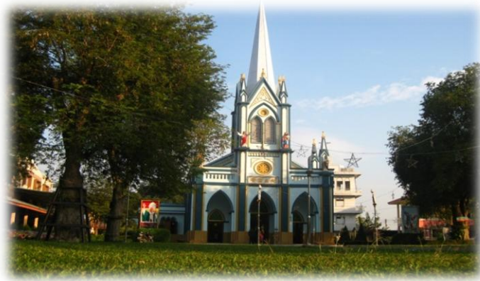
ภาพที่ 5 โบสถ์อัครเทวมารีคาแอล ดอนกระเบื้อง

ดอนกระเบื้องเป็นตำบลหนึ่งในเขตบ้านโป่ง จังหวัดราชบุรี มีพื้นที่ติดกับเขตอำเภอโพธาราม สำหรับชื่อ “ดอนกระเบื้อง” นั้นมาจากสภาพภูมิประเทศซึ่งเป็นที่ราบลุ่มและมีพื้นที่สูง มักเรียกว่าเป็นที่ “ดอน” แต่ก่อนสภาพพื้นที่ป่ารกชัวยบ้านในสมัยแรกมักปลูกยาสูบ ทำไร่ ทำนา ประกอบกับในช่วงนั้นมีแมลงชนิดหนึ่งซึ่งมักเรียกว่า “ตัวกระเบื้อง” อยู่เป็นจำนวนมากเป็นแมลงปีกแข็ง มีสีดำ ขนาดเท่าเมล็ดถั่วเขียว ชอบอาศัยตามหลังคาบ้านเรือนหรือในที่อับชื้นแต่ในปัจจุบันนี้หาพบตัวกระเบื้องนี้ได้ยากแล้ว