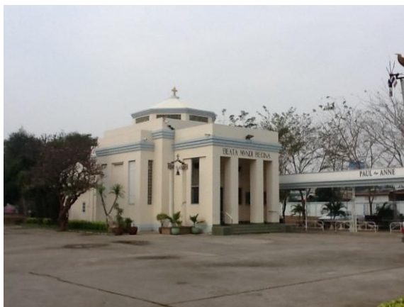
ภาพที่ 8 โบสถ์แม่พระราชินีแห่งสากลโลก

โบสถ์แม่พระราชินีแห่งสากลโลกปัจจุบันตั้งอยู่ที่ อำเภอเมือง จังหวัดกาญจนบุรี ซึ่งตั้งอยู่ทางด้านหลังของสุสานทหารสัมพันธมิตร สถานที่ท่องเที่ยวที่มีชื่อเสียงของจังหวัดกาญจนบุรี โดยมีประวัติความเป็นมาของโบสถ์ที่มีความผูกพันกับสงครามโลกครั้งที่ 2 เพราะเมื่อสมัยสงครามโลกครั้งที่สองสิ้นสุดลง บรรดาทหารที่เสียชีวิตในสงครามโลกส่วนหนึ่งได้ถูกฝังไว้ที่สุสานที่จังหวัดกาญจนบุรี หลังจากที่อีกส่วนหนึ่งมีญาติพี่น้องมารับกลับไปภูมิลำเนาของตน