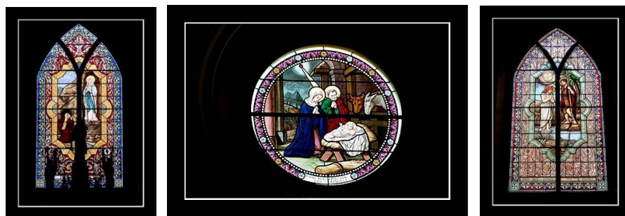
ภาพที่ 4 กระจกสีโบสถ์พระคริสตฤทัย วัดเพลง

อาศัยมรดกจากพ่อแม่ท่าน บาทหลวงเปร์ตีได้จัดหาแบบแปลนแล้วตกลงกับสัตบุรุษเพื่อลงมือสร้างโบสถ์ใหม่บนที่ดินริมแม่น้ำนั้น การเตรียมวัสดุก่อสร้างได้เริ่มดำเนินการอย่างรีบเร่ง อาทิเช่น การเผาอิฐ หาไม้สักมาเลื่อยเป็นกระดาน ฯลฯ โดยมีลูกวัดเป็นกรรมกรในการสร้าง ระฆังใบใหญ่เสียงดังกังวานจากประเทศฝรั่งเศสมา 3 ใบก็ถูกส่งมาถึงเป็นสัญญาณที่แสดงว่าวันแห่งความยินดีซึ่งทุกคนกำลังรอคอยนั้นจวนจะมาถึงแล้ว นั่นก็คือวันฉลองเสกโบสถ์ใหม่นั้นเอง และในปี ค.ศ.1903 วัดเพลงได้มีพิธีเสกฉลองโบสถ์ใหม่ซึ่งถือเป็นปีประวัติศาสตร์ครั้งสำคัญ นำความปลาบปลื้มยินดีมาสู่ทุกคน บ้านเพลงได้เจริญก้าวหน้าขึ้นตามลำดับควบคู่ไปกับวัดบางนกแขวก โดยมีบาทหลวงเปร์ตีได้ดำเนินการให้คนงานบุกเบิก เปลี่ยนแปลงที่ดินให้เป็นร่องสวน มีคลองระบายน้ำ อำนวยความสะดวกสบายเป็นอันมาก บรรดาลูกวัดของบาทหลวงได้อาศัยเป็นที่ทำมาหากินสืบมาจนถึงทุกวันนี้