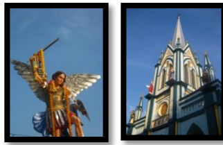
ภาพที่ 6 สถาปัตยกรรมภายนอกโบสถ์อัครเทวดามีคาเอล ดอนกระเบื้อง

เกินไป จึงได้มีการวางโครงการเพื่อสร้างโบสถ์หลังปัจจุบันขึ้นตามแบบของโบสถ์บางนกแขวก ซึ่งใช้เวลาในการก่อสร้างทั้งหมด 7 ปี และมีพิธีเสกโบสถ์ “นักบุญมีคาเอล ดอนกระเบื้อง” ในวันอาทิตย์ที่ 8 พฤษภาคม พ.ศ. 2447 นอกจากนี้บาทหลวงเจ้าอาวาสได้ร่วมกับบรรดาคริสตชนช่วยกันปลูกต้นไม้ร่มรื่นรอบๆ บริเวณวัด เพื่อสร้างความร่มรื่นสำหรับบริเวณวัด ซึ่งต้นไม้ร่มรื่นดังกล่าวนี้ยังคงอยู่เป็นคู่บารมีของโบสถ์ดอนกระเบื้องจนถึงปัจจุบัน ซึ่งต้นไม้ร่มรื่นนี้ถือได้ว่าเป็นต้นไม้สัญลักษณ์ประจำวัดและโรงเรียนอีกด้วย (วัดอัครเทวดามีคาเอล, 2547)