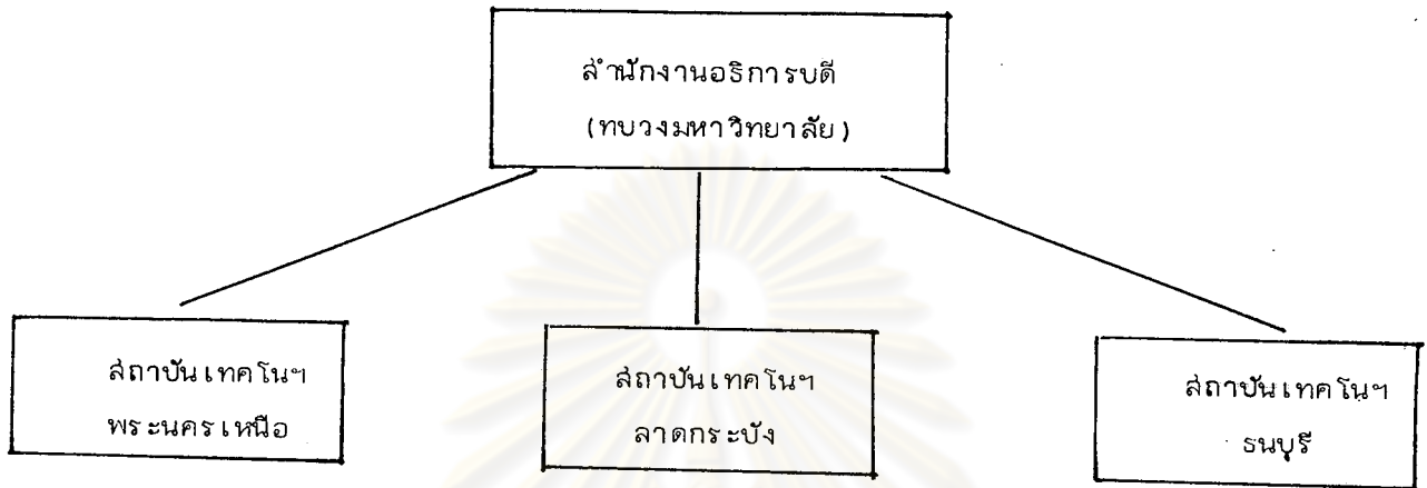
รูปที่ 3 แสดงระบบการบริหารงานของสถาบันเทคโนโลยีพระจอมเกล้า

ถ้าพิจารณาถึงรูปแบบการบริหารงานในแต่ละวิทยาเขต สามารถแบ่งได้เป็น 4 รูปแบบได้ดังนี้ 1