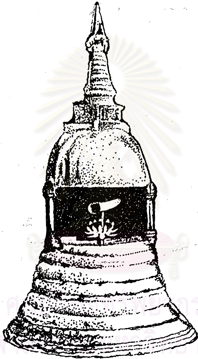
ภาพพระพันตชาตุ หรือพระเขี้ยวแก้ว ที่เมืองแคนดี ประเทศศรีลังกา