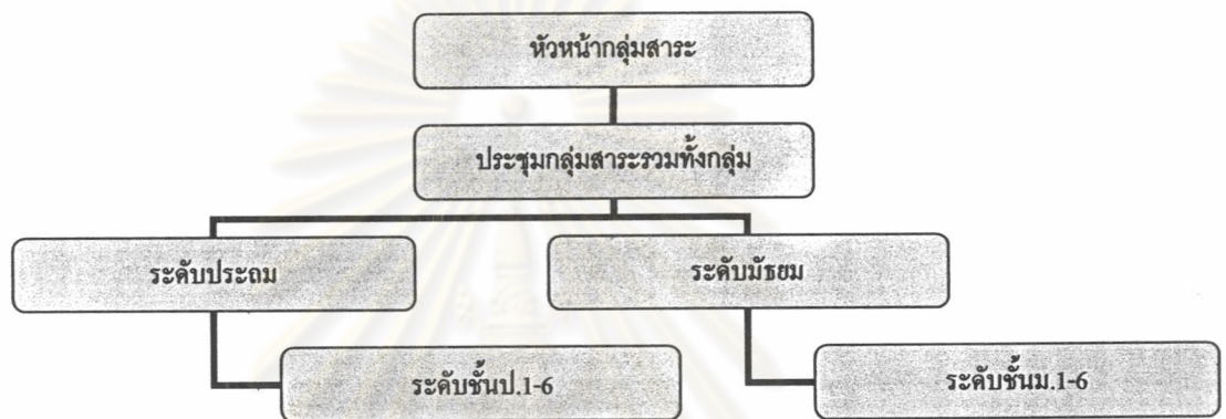
แผนภาพที่ 4.2 การทำงานกลุ่มสาระการเรียนรู้ศิลปะและดนตรี กับกลุ่มสาระการเรียนรู้สุขศึกษาและพลศึกษา

ทางการและไม่เป็นทางการทำได้ง่ายกว่ากลุ่มสาระอื่นๆ แต่กลุ่มสาระการเรียนรู้อื่นจะแยกตามระดับชั้นจึงทำให้ทั้งสองกลุ่มสาระมีการปฏิสัมพันธ์กันค่อนข้างดีอีกทั้งสมาชิกส่วนใหญ่ยังมีความสนิทสนมมีการพูดคุยเล่นกันมากกว่ากลุ่มสาระอื่นๆ โดยลักษณะการบริหารงานภายในจะเป็นไปในแบบที่หัวหน้ากลุ่มสาระและสมาชิกจะมีการประชุมรวมทั้งหมดแล้วแบ่งอำนาจความรับผิดชอบกันเองระหว่างประถมศึกษาและมัธยมศึกษา จากนั้นจึงมีการวางแผนการทำงานและกระจายภาระงานไปยังระดับชั้นต่างๆ และถึงแม้ว่าจะมีการแบ่งชั้นการทำงานมากแต่ภายในแต่ละชั้นมีการกระจายอำนาจมาก โดยมีแผนผังการทำงานดังนี้