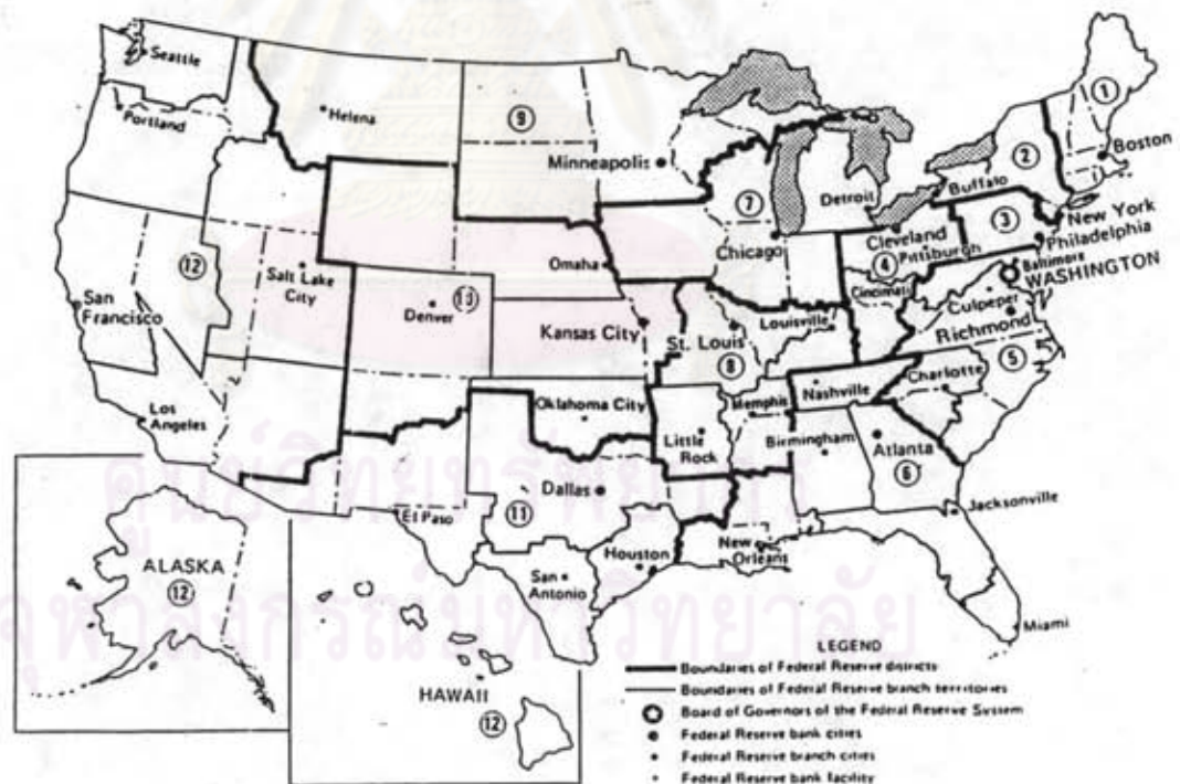
FIGURE 10-1 Boundaries of Federal Reserve Districts and Their Branch Territories

อย่างไรก็ตาม แม้ว่าสหรัฐอเมริกา มีระบบธนาคารกลางซึ่งมีศูนย์กลางอยู่ที่กรุงวอชิงตัน ดี.ซี. แต่นิววยอร์กยังคงเป็นจุดศูนย์กลางทางการเงินที่สำคัญที่สุด เมื่อนิววยอร์กมีการเปลี่ยนแปลงในอัตราดอกเบี้ย จะทำให้จุดศูนย์กลางทางการเงินอื่น ๆ ของประเทศเปลี่ยนแปลงอัตราดอกเบี้ยไปด้วย กฎหมายอนุญาตให้ Federal Reserve Bank ทั้ง 12 แห่ง ใช้อัตราซื้อลดที่เหมาะสมกับสภาวะการเงินในเขตของตน ในทางปฏิบัติแล้วระบบธนาคารกลางในสหรัฐอเมริกาใช้อัตราธนาคารเพียงอัตราเดียวเหมือนกันหมด ซึ่งเป็นหน้าที่ของคณะกรรมการในกรุงวอชิงตัน ดี.ซี. ที่จะตกลงกำหนดอัตราธนาคาร 34