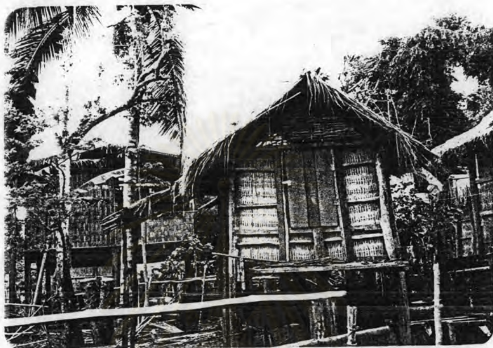
รูปที่ 2.11 ฉางเก็บข้าวซึ่งมีขนาดเล็ก แสดงถึงปริมาณข้าวที่ผลิตได้น้อย ไม่พอบริโภคตลอดปี