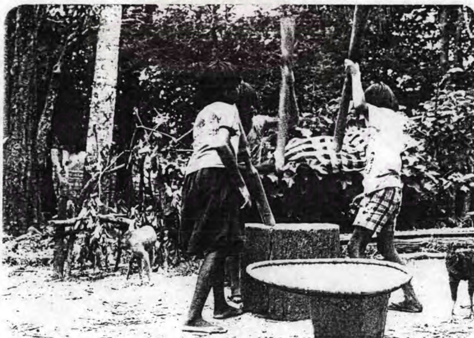
รูปที่ 2.13 เด็ก ๆ ทำข้าวกินวันต่อวัน ลักษณะ "ตาข้าวสารกรอกหม้อ"