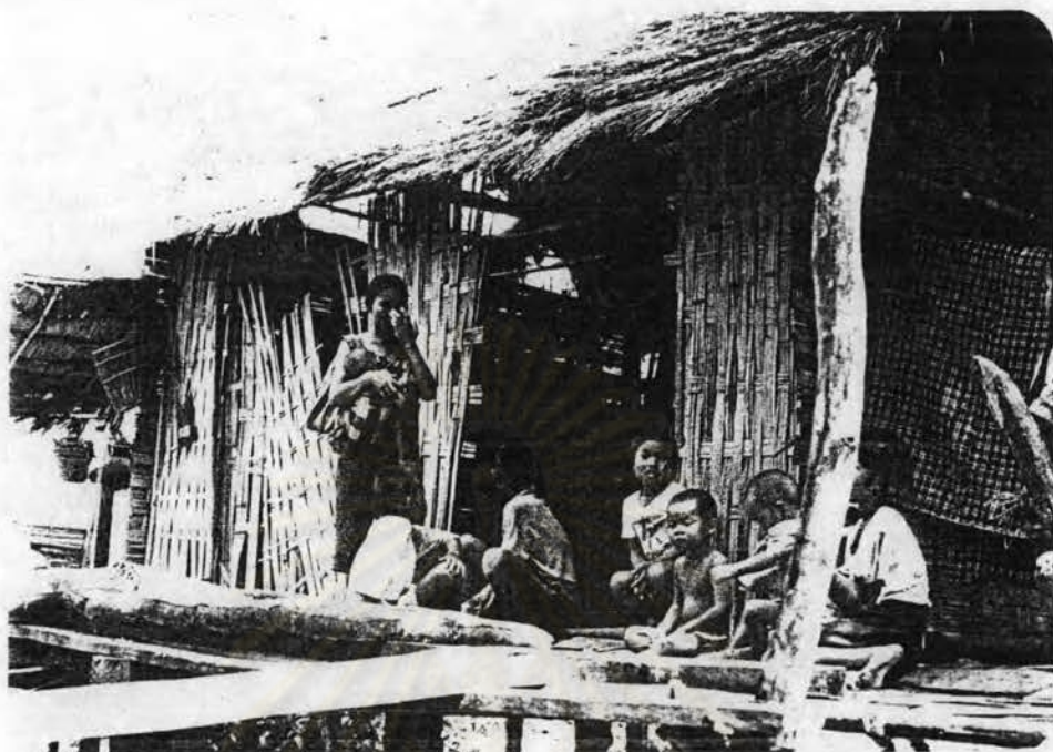
รูปที่ 2.7 สภาพชีวิตความเป็นอยู่ในครอบครัวของชาวบ้าน