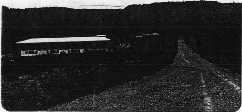
รูปที่ 2.3 ถนนเข้าสู่หมู่บ้าน ด้านหลังจะเห็นเทือกเขาภูพานล้อมรอบหมู่บ้าน