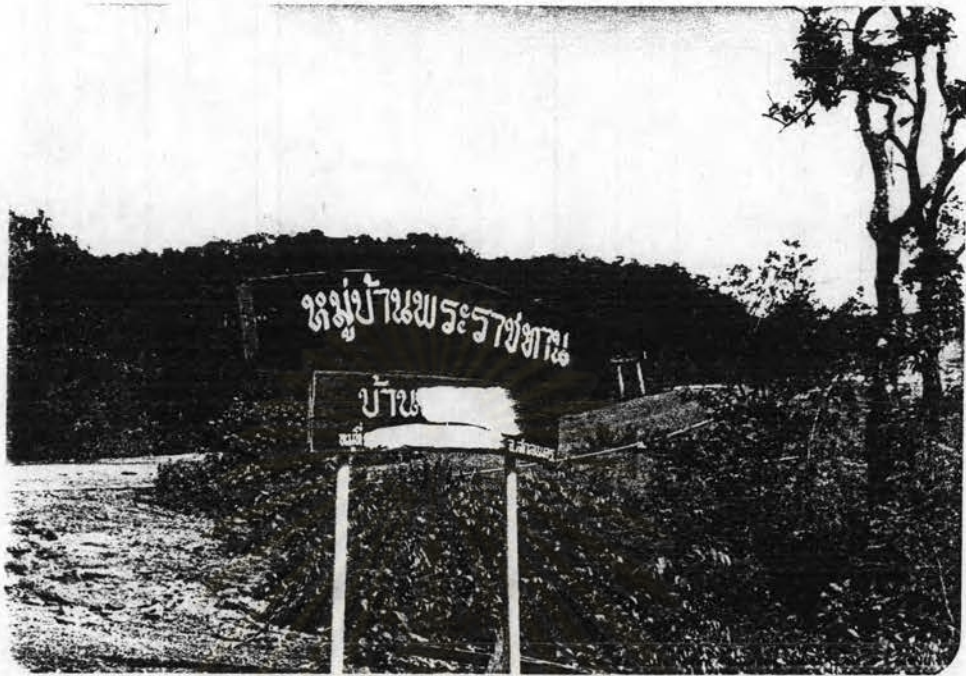
รูปที่ 2.2 บ้านหมู่บ้านพระราชทานและป้ายชื่อหมู่บ้าน บริเวณทางเข้าหมู่บ้าน