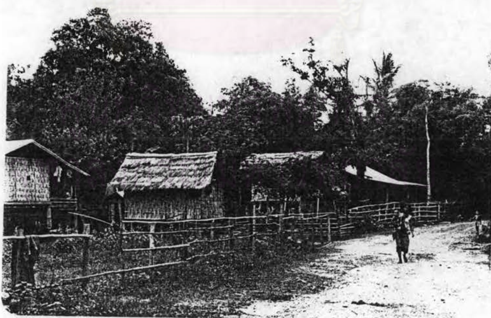
รูปที่ 2.8 สภาพบ้านโดยทั่วไป