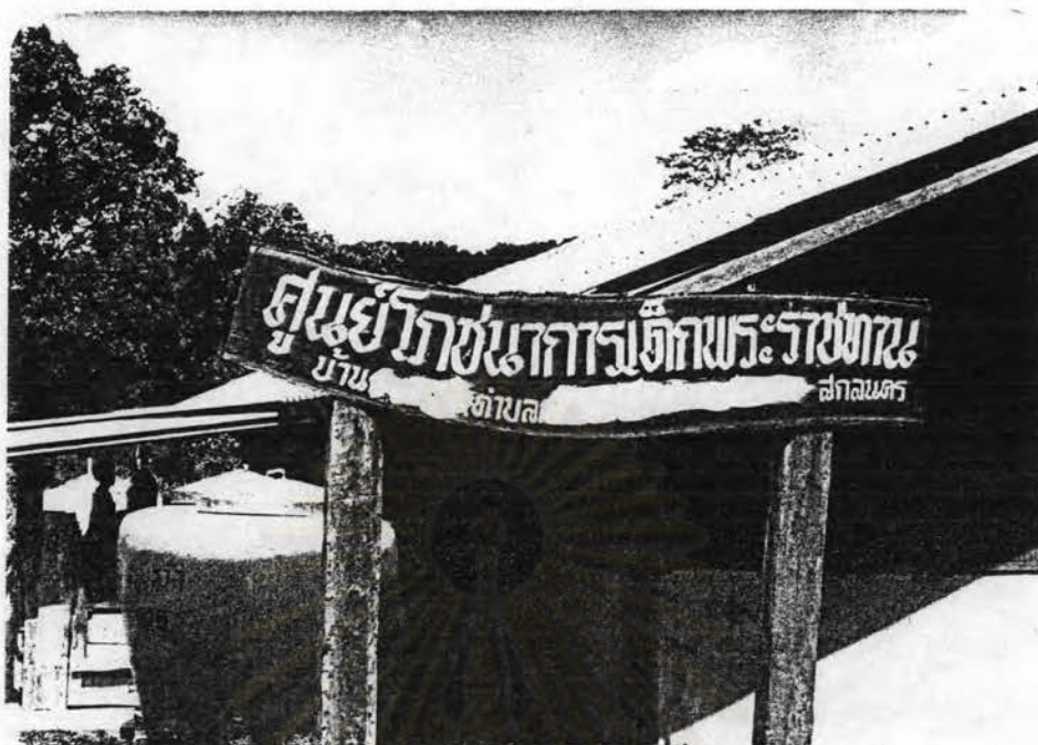
รูปที่ 2.9 ศูนย์โภชนาการเด็กพระราชทาน