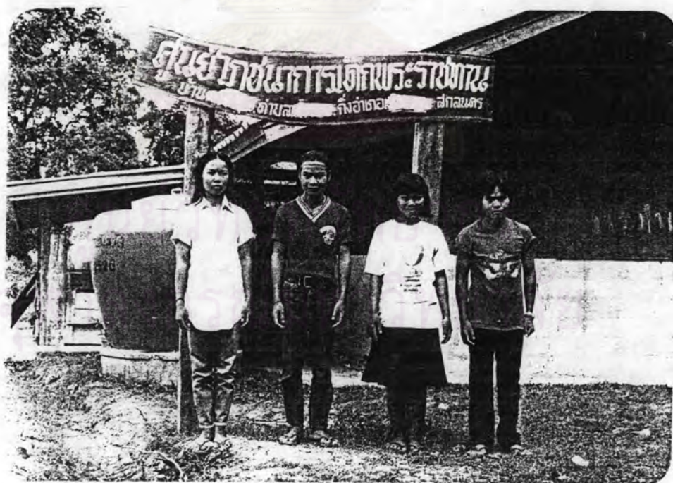
รูปที่ 2.6 การแต่งกายของกลุ่มวัยรุ่น ซึ่งเริ่มมีการเปลี่ยนแปลงวัฒนธรรมด้าน การแต่งกาย ในภาพจะเห็นว่าวัยรุ่นเหล่านี้เริ่มใส่กางเกงยีนส์แทน ผ้าถุงและผ้าพื้นเมือง