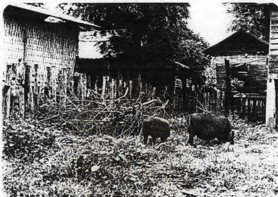
รูปที่ 2.12 การเลี้ยงสัตว์ของชาวบ้านแบบปล่อยปะละเลยตามธรรมชาติ