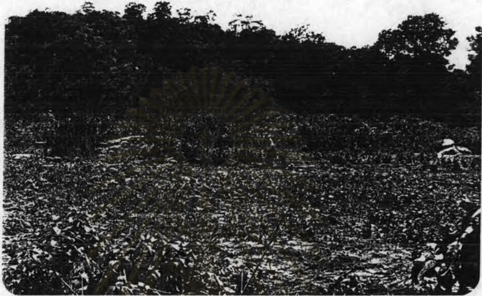
รูปที่ 2.14 พื้นที่เพาะปลูกงาและมันสำปะหลังบริเวณท้ายหมู่บ้าน