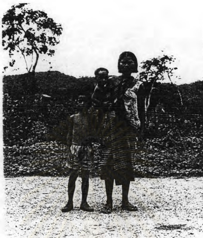
รูปที่ 2.5 การแต่งกายของหญิงชาวบ้านวัยกลางคน