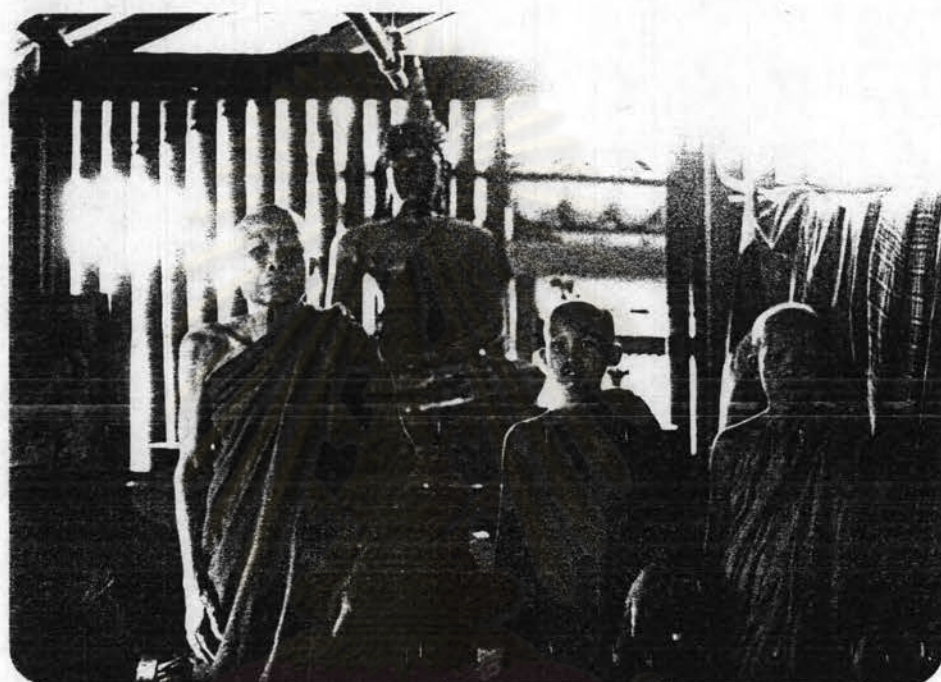
รูปที่ 2.4 พระภิกษุสามเณรในวัดประจำหมู่บ้าน ซึ่งสร้างโดย โครงการอันเนื่องมาจากพระราชดำริ