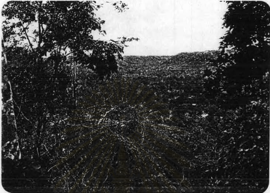
รูปที่ 2.1 ภาพหมู่บ้านมองจากภูเขาสูงสุดลูกหนึ่ง