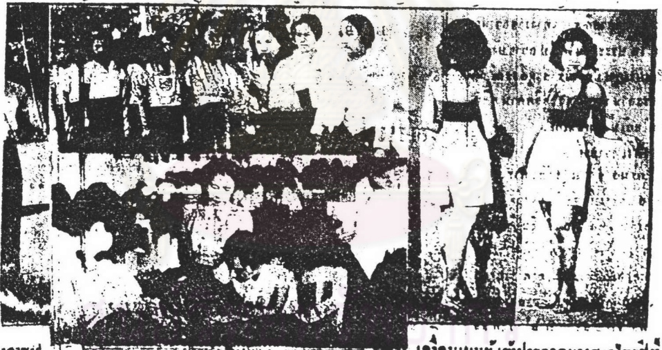
ภาพแสดงคณะผู้เข้าประกวดนางสาวไทยปี ๒๔๘๓

วอชิงตัน ๒๐ ตุลาคม - มร. เอช เดม อิม โคจิฆ เสสรัฐในวอชิงตัน คนหนึ่งซึ่งโคจร ไร่ก อ่าง เบลเดช ข้าราชการประจำนามดี โรสเอคส์นัม มีคนได้ถูกจับกุมแล้ว หนังสือ พิมพ์ “ออร์แกนไทมส์ เดวอต” (มีต่อปกหลัง)