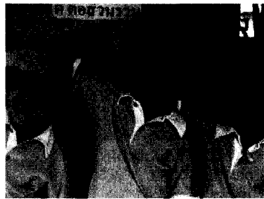
ทำทางให้อภัยที่ได้รับความนิยมสูงสุด