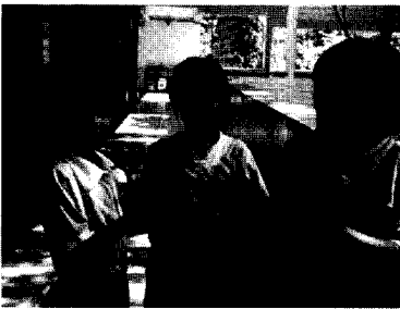
อย่าโกรธกัน ให้อภัย