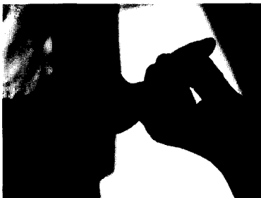
เกี่ยวก้อยกัน ให้อภัย

ท่าทางประกอบ “การให้อภัย” ที่แสดงถึงความคิดริเริ่มสร้างสรรค์ ต่างก็เป็นท่าทางที่นักเรียนคุ้นเคยอยู่แล้ว