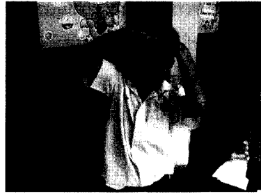
เรารักกัน ให้อภัย