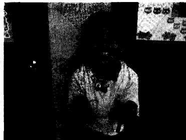
แหะ แหะ แหะ ผิดไปแล้ว ให้อภัย