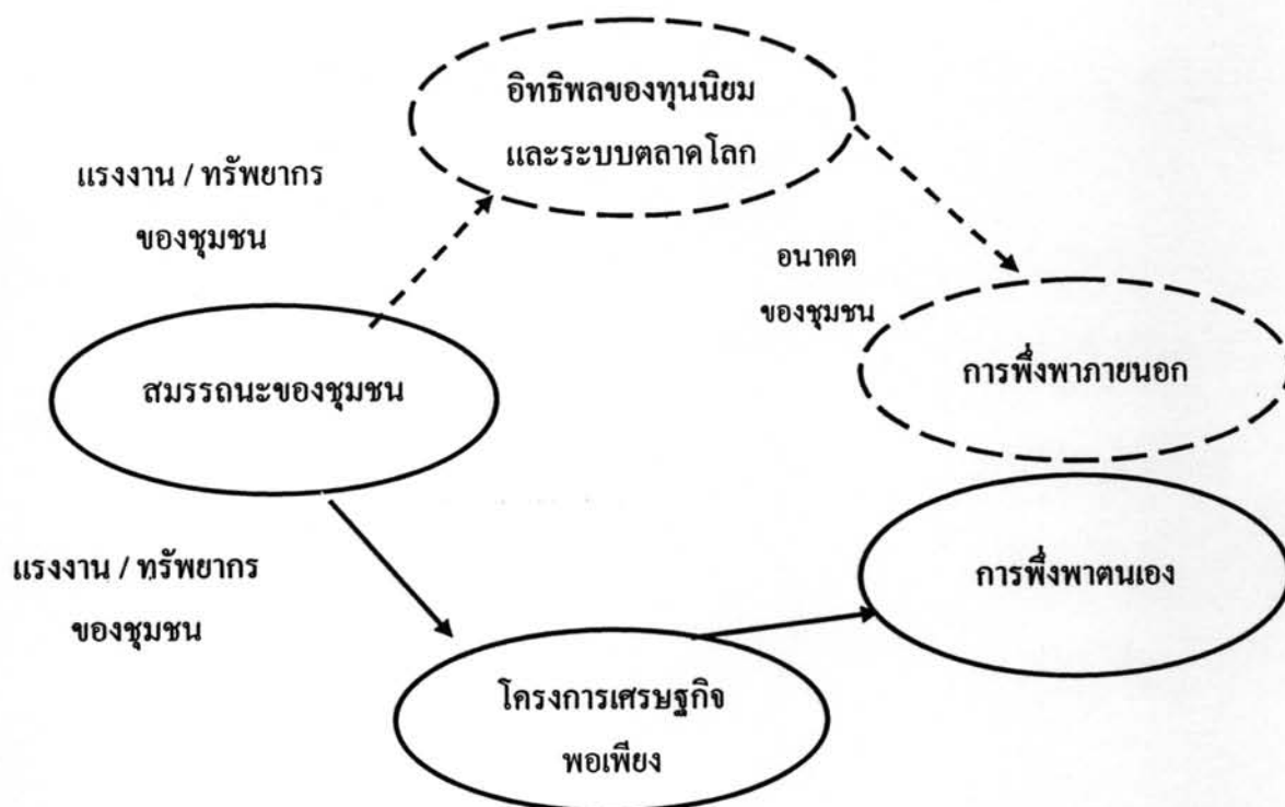
แผนภาพที่ 2.3 สมรรถนะของชุมชน กับอนาคตของชุมชน