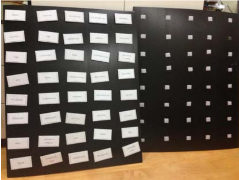
ภาพที่ 1 บอร์ดการวิจัยเลือกแปะที่ใช้จริง