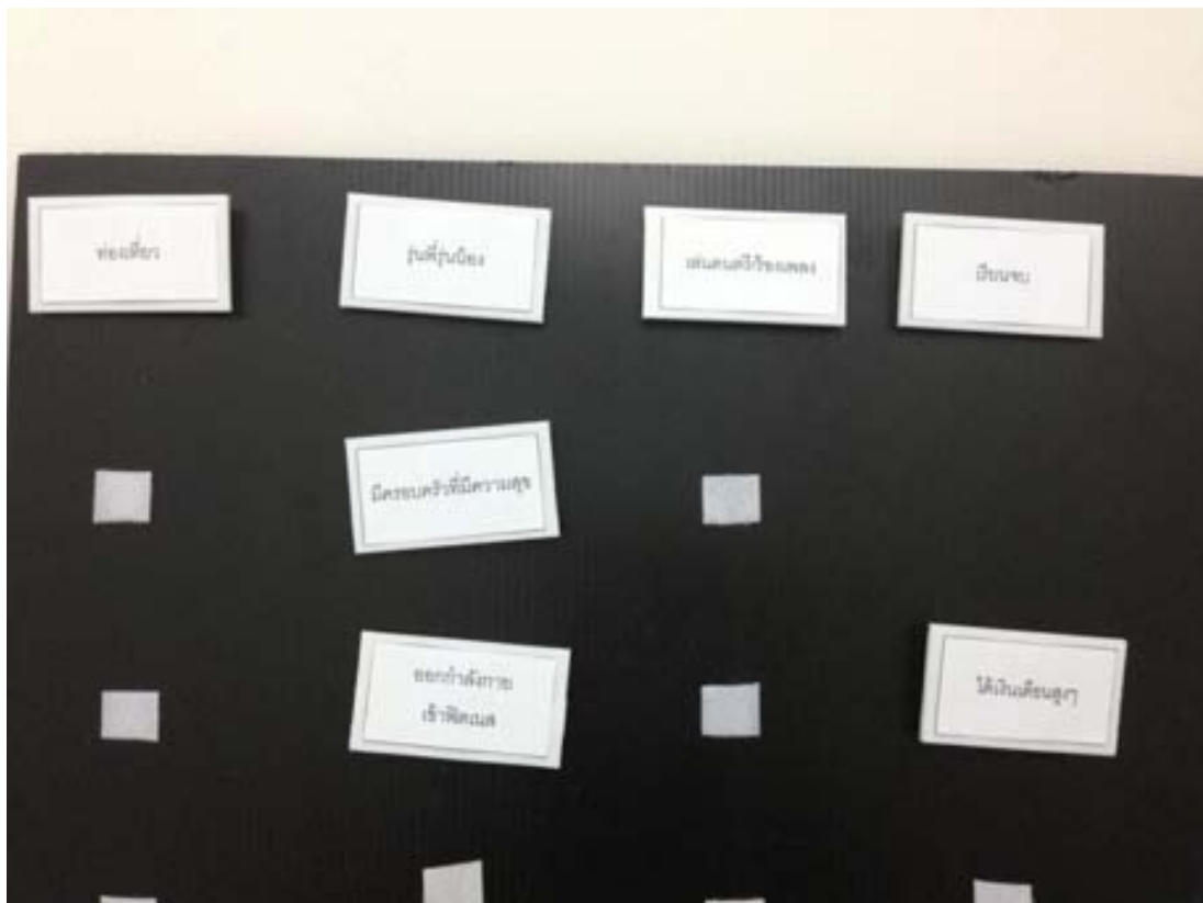
ภาพที่ 2 ตัวอย่างการเลือกคำของผู้ร่วมการวิจัย