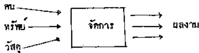
แบบรูปที่ 2

หัวใจของการบริหารมีไต่อยู่ที่ปริมาณของปัจจัยนี้ แต่อยู่ที่คุณภาพของปัจจัยนี้ โดยเฉพาะด้านการจัดการ ซึ่งหมายรวมถึงการมีภาวะผู้นำ การจูงใจคน และสมรรถนะอื่น ๆ ที่จะทำให้เกิดผลงานที่มีประสิทธิภาพ จากข้อเท็จจริงของจะอนุมานได้ว่า ถ้าจัดให้มีการพัฒนาการบริหารขึ้น โดยพัฒนาปัจจัยสี่นี้แล้ว ส่วนราชการจะผลิตผลงานไต่มากขึ้น ถ้าให้ปัจจัยทั้งสี่ไต่เท่าเดิม หรือจะสามารถผลิตผลงานไต่เท่าปัจจุบันโดยใช้ปัจจัยน้อยลง