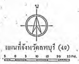
แผนที่จังหวัดลพบุรี (40)