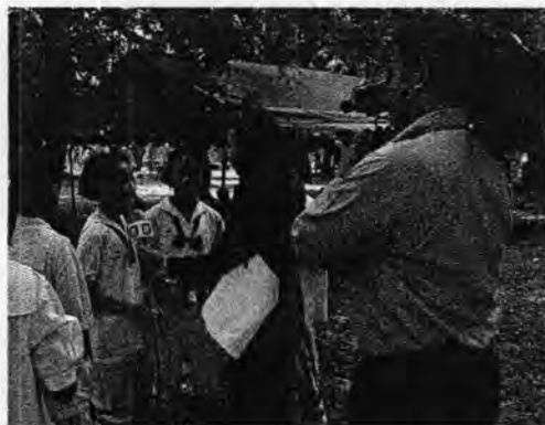
ภาพที่ 62. ทีมข่าวสถานีโทรทัศน์ช่อง 11 รายงานการเข้าร่วมพิธีไหว้ครูในจังหวัดสงขลา

ทางสถานีก็จำเป็นต้องหารายได้เลี้ยงหน่วยงานตนเองเพื่อสำรองในส่วนที่งบประมาณจากภาครัฐสนับสนุนไม่เพียงพอด้วยการเปิดให้หน่วยงานภายนอกเข้ามาซื้อชั่วโมงออกอากาศ สัดส่วนของการเผยแพร่ศิลปวัฒนธรรมพื้นบ้านก็ย่อมลดน้อยลงเช่นกัน