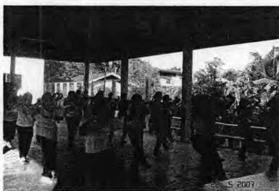
ภาพที่ 60. การรำนโนราประยุกต์ของสมาชิกชมรมรักสุขภาพ อบต. น่าน้อย อ. หาดใหญ่ จ. สงขลา

สำหรับชมรมรักสุขภาพน่าน้อย ขององค์การบริหารส่วนตำบลน่าน้อย มีการก่อตั้งชมรม เมื่อปี พ.ศ. 2545 การจุดประกายให้เกิดชมรมรักสุขภาพเพราะเห็นว่าขณะนั้นยังไม่มีหน่วยแพทย์ เคลื่อนที่คอยตรวจชาวบ้านในหมู่บ้าน มีเพียงการรักษาจากอนามัยเท่านั้น และมีผู้ป่วยที่อาศัยแต่ ยารักษาโรคเพียงอย่างเดียว เช่น คนที่เป็นโรคความดัน หลังจากไปหาหมอจากโรงพยาบาลหรือ เจ้าหน้าที่อนามัยแล้วกลับบ้านไปก็ได้แต่ กินยา กินยา และกินกินยา ความดันที่เป็นอยู่ก็ลดบ้างไม่ ลดบ้าง แต่ว่าการดูแลสุขภาพด้านอื่นๆ ยังไม่ได้รับความรู้เท่าที่ควร อนามัยน่าน้อยจึงเกิดความคิด ว่าน่าจะนำคนไข้ที่กินยาอยู่นำมาเข้าชมรม ก็คงช่วยเรื่องสุขภาพของชาวบ้านได้มาก โครงการนี้จึง ได้เกิดขึ้น จัดเป็นอีกกลุ่มหนึ่งที่เห็นความสำคัญของการออกกำลังกาย และก็ส่งเสริมการออก กำลังกายเชิงอนุรักษ์วัฒนธรรม คือมีทั้ง “โนราบิก” และ “โนราประยุกต์” แม้ว่าทางชมรมเองไม่ได้ เป็นผู้คิดค้นทำตัวเอง เป็นเพียงผู้ปฏิบัติตามนโยบายจากสำนักงานสร้างเสริมสุขภาพให้มีการจัด กิจกรรมดังกล่าวขึ้น โดยจะนำ VCD มาศึกษาแล้วทำตาม โดยกลุ่มโนราบิกที่ประสบความสำเร็จ สูงสุดก็คือจังหวัดนครศรีธรรมราช ที่อำเภอพระพรหม ซึ่งถือว่าประสบความสำเร็จสูงเพราะเด็กใน โรงเรียนในพื้นที่ทุกคนสามารถทำได้ทุกคน บวกกับทางอำเภอให้การสนับสนุนและส่งเสริมเพราะ เมื่อมีงานของอำเภอหรือจังหวัดก็จะให้มีโนราบิกเป็นหนึ่งในการแสดง หรือไม่ก็จะส่งตัวแทนเข้าไป อบรมกับมหาวิทยาลัยสงขลานครินทร์ ให้ทำหน้าที่เป็นที่เลี้ยงพร้อมมีวิทยากรผู้เชี่ยวชาญแนะนำ เสมอมา