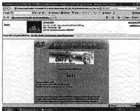
ภาพที่ 63. การประชาสัมพันธ์การแสดงโนราของคณะธรรมนิศย์ สงวนศิลป์ ณ ศูนย์มานุษยวิทยาสิรินธร กรุงเทพมหานคร ทางอินเทอร์เน็ต