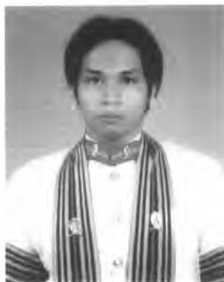
ประวัติผู้เขียนวิทยานิพนธ์