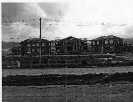
รูปที่ 17: ภาพการสร้างอาคารที่ทำการด่านพรมแดนแห่งที่ 2 พร้อมอาคารประกอบ