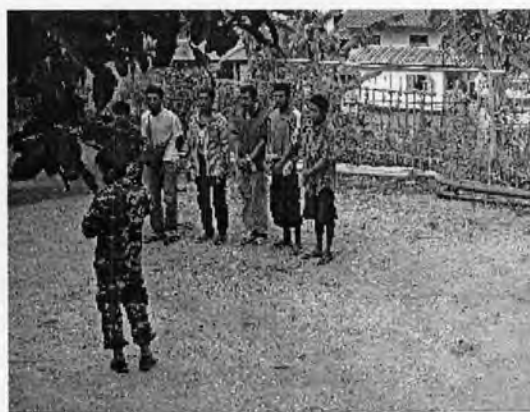
การผลักดันแรงงานต่างด้าวกลับ