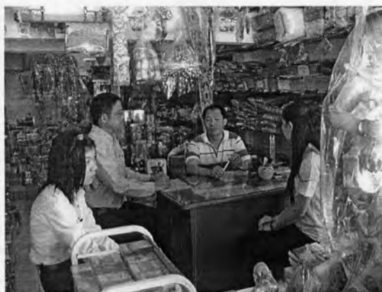
รูปที่ 26: ภาพแสดงการออกเยี่ยมสมาชิกและผู้ประกอบการ