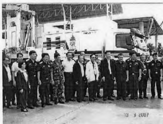
ตรวจสอบรถบรรทุก (ด่านพรมแดนแห่งที่ 1)