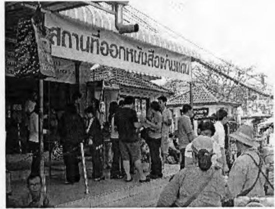
จุดออกหนังสือผ่านแดน