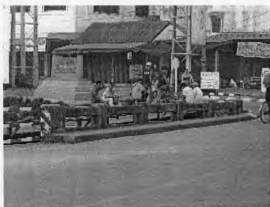
จุดรวมตัวของแรงงานต่างด้าว