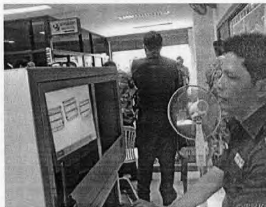
ตรวจสอบสัมภาระนักท่องเที่ยว (ด่านสะพานมิตรภาพแห่งที่ 2)