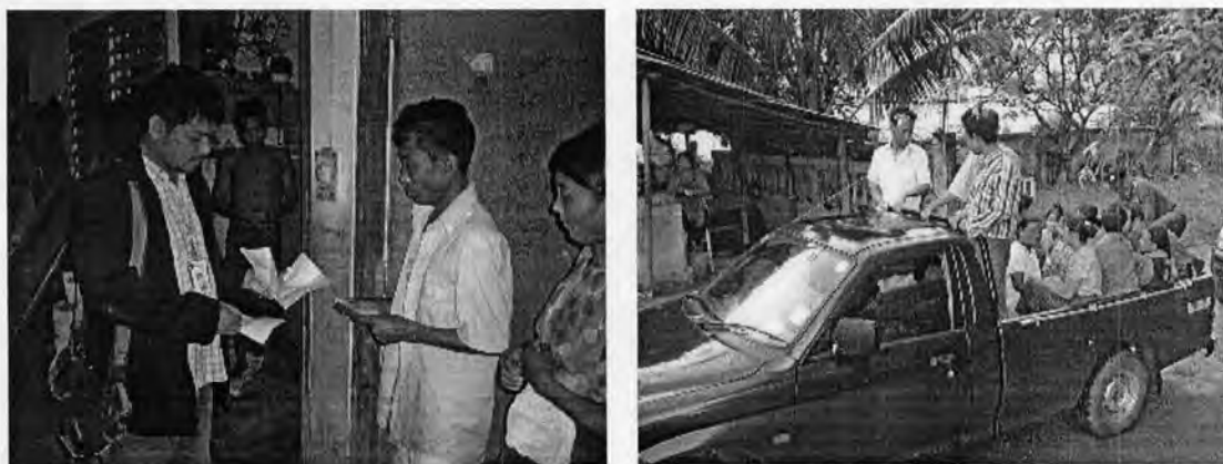
รูปที่ 19: ภาพแสดงการจับกุมแรงงานผิดกฎหมายของด่านตรวจคนเข้าเมืองแม่สาย 1