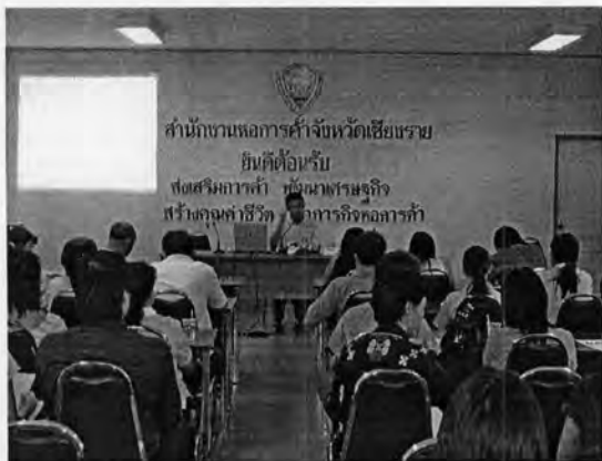
ร่วมกับวิทยาลัยอาชีวศึกษาเชียงราย จัดบรรยาย

รูปที่ 25: ภาพแสดงบทบาทในการพัฒนาบุคลากรเพื่อป้อนเข้าสู่ภาคอุตสาหกรรมการขนส่ง