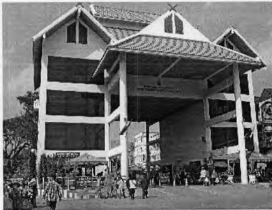
ด่านพรมแดนแม่สาย