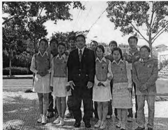
นักศึกษาหลักสูตร วิชาการจัดการอุตสาหกรรมการขนส่ง