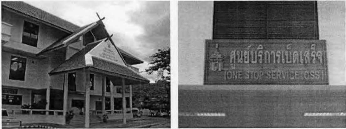
รูปที่ 16: ภาพศูนย์บริการเบ็ดเสร็จด้านศุลกากรอำเภอแม่สาย