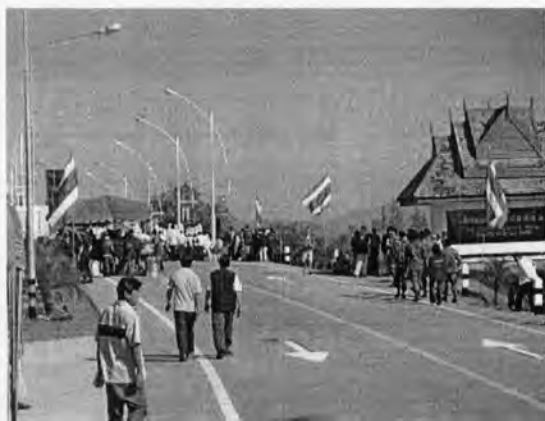
รูปที่ 23: ภาพงานวันเปิดสะพานข้ามแม่น้ำสายแห่งที่ 2 วันที่ 22 มกราคม พ.ศ. 2549

แต่อย่างไรก็ตามปัจจุบันสะพานข้ามแม่น้ำสายได้ดำเนินการก่อสร้างแล้วเสร็จ และเปิดใช้อย่างเป็นทางการไปแล้ว เมื่อวันที่ 22 มกราคม พ.ศ. 2549 โดยมี นายกันตธีร์ ศุภมงคล รัฐมนตรีว่าการกระทรวงต่างประเทศมาร่วมเปิดงาน