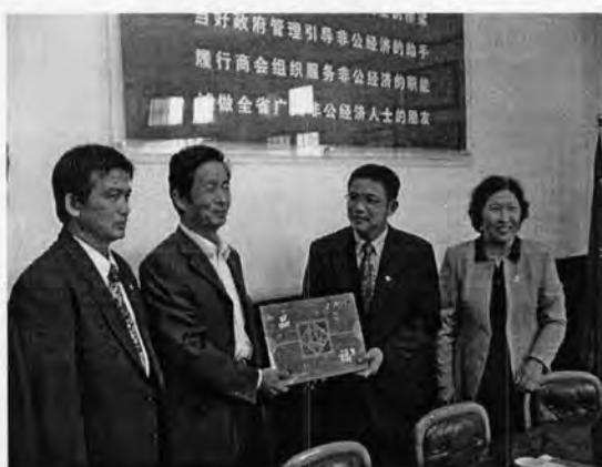
การสร้างสัมพันธ์กับหอการค้ายูนนาน