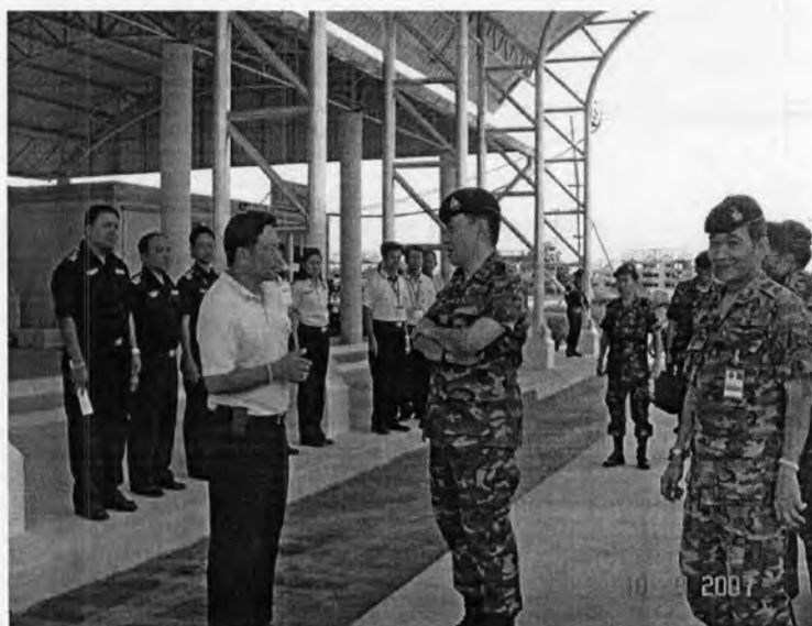
รูปที่ 21: ภาพแสดงการตรวจเยี่ยมของผู้นำทางทหาร

เมื่อวันที่ 10 กันยายน 2550 พลเอกทรงกิตติ จักกาบาตร เสนาธิการทหาร/รอง ผอ.รมณ.2 ได้เดินทางมาตรวจเยี่ยมความคืบหน้าโครงการก่อสร้างด่านศุลกากรแห่งที่ 2