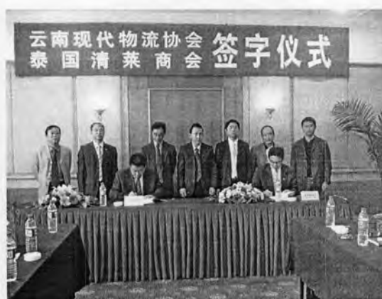
พิธีลงนามบันทึกความเข้าใจ เพื่อการพัฒนาาระบบเครือข่ายโลจิสติกส์