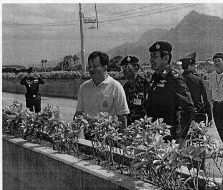
เมื่อวันที่ 22 พฤษภาคม 2550 พลโทจิรเดช คชรัตน์ แม่ทัพภาคที่ 3 ได้เดินทางมาตรวจเยี่ยมด้าน ศุลกากรแม่สาย เพื่อดูความคืบหน้าโครงการก่อสร้างอาคารด่านศุลกากรแห่งที่ 2 และดูหลักเขตชายแดนไทย - พม่าที่เป็นปัญหา