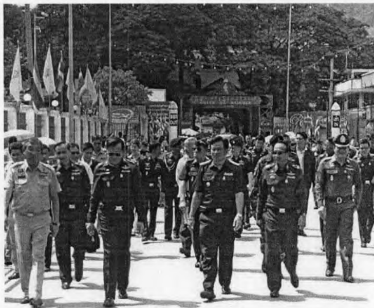
เมื่อวันที่ 8 มิถุนายน 2550 พล.เอก บุญสร้าง เนียมประดิษฐ์ ผู้บัญชาการทหารสูงสุด ได้เดินทางมา ตรวจเยี่ยมการปฏิบัติงานด้านยาเสพติดที่อำเภอแม่สาย