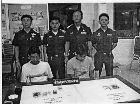
ภาพข่าวการจับกุมการลักลอบขนยาเสพติดโดยด่านศุลกากรแม่สาย เมื่อวันที่ 7 สิงหาคม พ.ศ. 2550