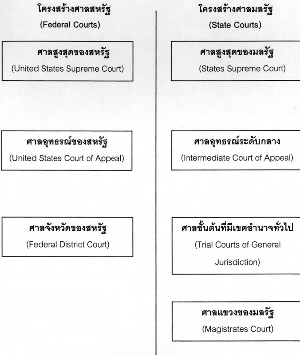
ภาพ 1 โครงสร้างศาลของประเทศสหรัฐอเมริกา