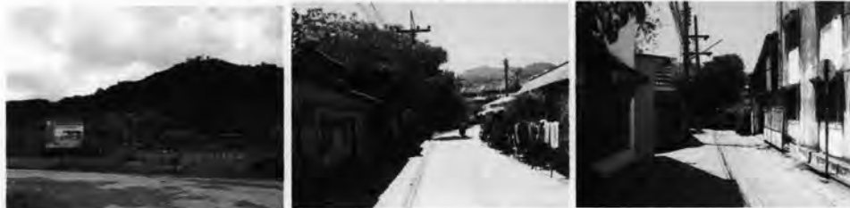
การเข้าถึงส่วนที่ลึกที่สุดของชุมชนทำได้ลำบากมีเส้นทางที่ซับซ้อนและมีความลึกมากจากถนนสายหลักมาก