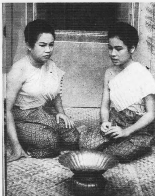
รูปที่ 2 แสดงการแต่งกายแบบนุ่งโจงกระเบนและห่มสไบเฉียง