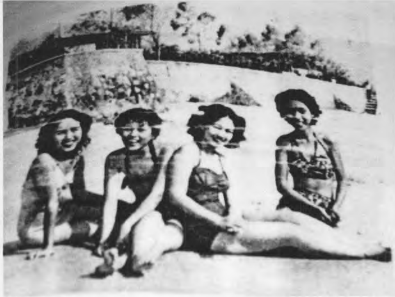
รูปที่ 17 นางสาวไทย พ.ศ. 2494 (ที่สองจากขวา) กับเพื่อน ๆ สวมชุดอาบนํ้าที่ชายทะเลหัวหิน

จากรูปที่ 17 แม้จะรับรูปแบบการแต่งกายมาจากตะวันตก แต่ในเรื่องสรีระแล้ว ผู้หญิงไทยยังมีรูปร่าง ทรวดทรงองค์เอวที่ต่างจากผู้หญิงตะวันตกอยู่มาก แม้ว่าแฟชั่นตะวันตกจะพยายามสร้างรูปแบบการแต่งกายชนิดเน้นทรวดทรงองค์เอวแพร่เข้ามาก็ตาม แต่รูปร่างทางสรีระของผู้หญิงไทยในยุคนี้ยังคงมิได้มีการเปลี่ยนแปลงไปตามแบบตะวันตกอย่างชัดเจน ดูได้จากความสูงโดยเฉลี่ยที่ยังคงไม่เกิน 160 เซนติเมตรเท่านั้น