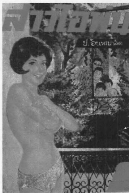
รูปที่ 24 แสดงภาพผู้หญิงเปลือยอก ภาพปก พล นิกร กิมหงวน ตอนสาวไอโฟน ปี พ.ศ. 2508