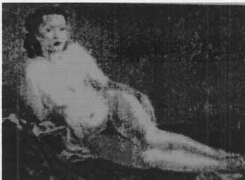
รูปที่ 16 ภาพเขียน ชื่อ NUDE เขียนเมื่อปี พ.ศ. 2492 โดยจำรัส เกียรติก้อง

มาตรฐานทางสรีระโดยทั่วไปของหญิงไทยในยุคนี้คือ ลำตัวช่วงบนตั้งแต่ไหล่ถึงเอวจะยาว ขณะที่ช่วงน้องถึงเท้าจะสั้นและมักจะโค้ง รวมทั้งมีรูปร่างขาดการดูแลเอาใจใส่ 57