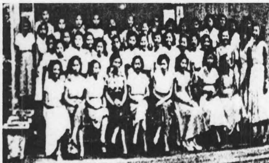
รูปที่ 14 แสดงการนุ่งกระโปรงนิวลุคของผู้หญิงไทยซึ่งเป็นที่แพร่หลายและนิยมโดยทั่วไป

การที่อเมริกาเป็นฝ่ายชนะสงคราม และการที่ภาพยนตร์อเมริกันเริ่มกลับเข้ามาฉายอีก ทำให้คนไทยกลายเป็นโรคเห่ออเมริกันไปโดยไม่รู้ตัว และโรคนี้ก็เป็นกันอยู่ยาวนานปี เป็นว่าอะไร ๆ อเมริกันเป็นดีไปทั้งหมด ใครได้ไปอเมริกาเหมือนว่าได้ไปเมืองสวรรค์ 50 แฟชั่นกระโปรงหลังสงครามของอเมริกันที่เป็นที่นิยมในช่วงหลังสงคราม ได้แก่ กระโปรงนิวลุค 51 (New Look) เป็นกระโปรงบาน ถ้านั่งลงกับพื้นก็เห็นเป็นวงรอบตัว เวลาตัดจะเปลืองผ้ามาก เพราะใช้ผ้าทั้งผืนเฉลี่ยวงกลม นอกจากนี้ยังมีกระโปรง 4 ชั้น 6 ชั้น 8 ชั้น เป็นกระโปรงที่ต้องใช้ผ้า 4 หรือ 6 หรือ 8 ชั้นมาต่อกัน แล้วแต่ความเหมาะสมของรูปร่าง และที่นิยมในยุคนี้อีกแบบหนึ่งก็คือ กระโปรงสุ่มไก 52 เป็นกระโปรงที่มีโครงไม้กลม ๆ อยู่ข้างใน สอดในรอยต่อระหว่างชั้นทุกชั้น เหมือนกับสวมหมวกสุลาฮูบ และยังมีการจีบรอบ ๆ ด้วย