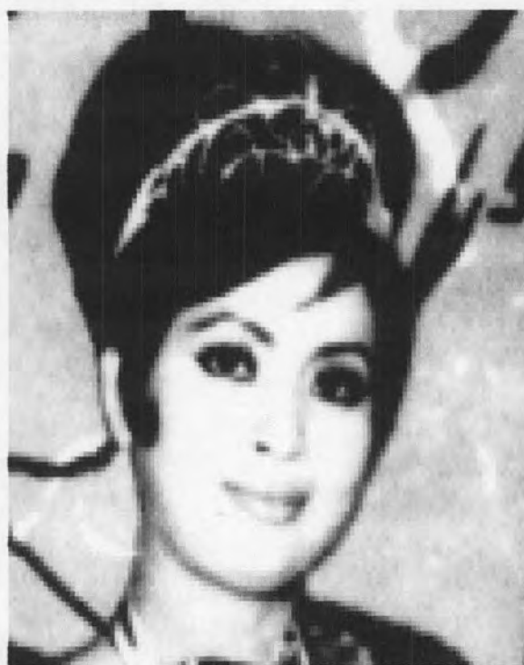
รูปที่ 33 แสดงการแต่งหน้าที่เน้นดวงตาหวาน เขียนขอบตาเข้ม คิ้วคมเข้ม

สำหรับการแต่งหน้าในยุคนี้มีความก้าวหน้ามากขึ้น เนื่องจากมีสถานความงามต่าง ๆ เกิดขึ้นมากมาย ผู้หญิงในยุคนี้นิยมแต่งหน้าสวยหวาน และยังคงเน้นดวงตาหวานหยาดเยิ้ม (ดังรูปที่ 33 - 34)