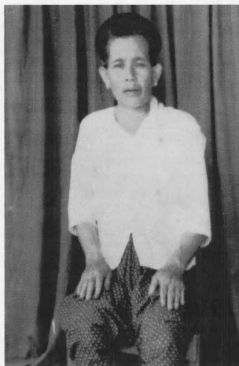
รูปที่ 3 แสดงการแต่งกายก่อนที่จอมพล ป. พิบูลสงครามประกาศใช้รัฐนิยม (ภาพถ่ายปี พ.ศ. 2479)