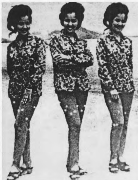
รูปที่ 31 แสดงการสวมกางเกงยัด ปี พ.ศ. 2510 – 2511 (ที่มา: เอนก นาวิกมูล, 2547 : 228)

แฟชั่นการแต่งกายของผู้หญิงในยุคนี้ถืออย่างหนึ่งก็คือ กางเกงยัด ผู้หญิงในยุคนี้นิยมสวมกางเกงยัดโดยทั่วไป เป็นกางเกงที่ตัดด้วยผ้าใยสังเคราะห์ ชนิดยัดได้ นอกจากยัดได้แล้วก็คือ การรัดรูป และมีสายรัดที่สั้นทำสำหรับไม่ให้ผ้าดึงกลับขึ้นไป กางเกงยัดใช้สวมเล่นไม่เป็นพิธี เช่น ไปเที่ยวชายหาด หรือไปไหนมาไหนตามปกติ เรียกได้ว่าเป็นกางเกงที่มีคนรู้จักและเป็นที่ยอมรับอย่างแท้จริงทั่วประเทศอยู่พักหนึ่ง แต่ใส่กันไม่นานก็หมดไป 90