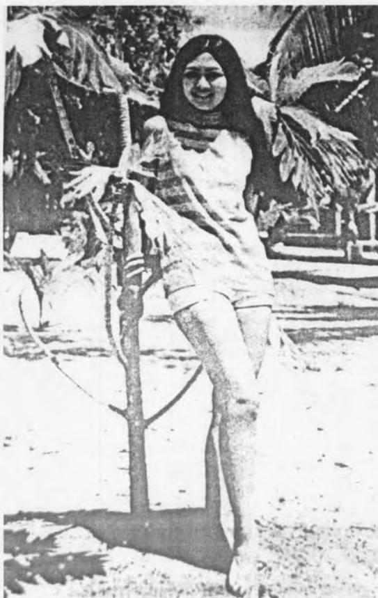
รูปที่ 30 สอทแพนท์หรือกางเกงขาสั้นอย่างยิ่ง ภาพถ่าย ปี พ.ศ. 2514

ในยุคนี้มีแฟชั่นตะวันตกที่เข้ามาร่วมสมัยกับกระโปรงสั้นมินิสเกิร์ต ได้แก่ สอทแพนท์ หรือกางเกงสั้น หรือกางเกงขาสั้นอย่างมาก เป็นกางเกงที่สั้นและรัดสะโพกยิ่งกว่ากางเกงสั้นปกติ เป็นที่นิยมในหมู่ผู้หญิงที่แต่งตัวเปรี้ยว มักนุ่งชายหาด 89