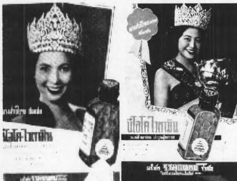
รูปที่ 22 ภาพโฆษณาโดยการใช้นางสาวไทยเป็นนางแบบ

ตั้ง หน้าท้องแบนราบ ช่วงขาและช่วงแขนที่ได้สัดส่วนกับลำตัว ใบหน้ายิ้มสดใส ไว้ผมตัดเป็นลอน ตามแฟชั่น สอดคล้องกับการแต่งกายของนางสาวไทยในปี พ.ศ. 2493 ที่ได้เปลี่ยนมาใส่ชุดอาบน้ำ เป็นครั้งแรกในการเข้าประกวดซึ่งมีการเปิดเผยให้เห็นสัดส่วนของร่างกายมากขึ้นกว่าทุกครั้งที่ผ่านมา การเปิดเผยร่างกายในภาพบ่งบอกให้เห็นถึงมายาคติความงามจากตะวันตกที่มีแฟชั่นการเปิดเผย สัดส่วนของร่างกายที่เข้ามาอย่างต่อเนื่องในขณะนั้น นอกจากนี้การโฆษณาดังกล่าวยังให้ภาพที่ ชัดเจนของการมีสุขภาพที่แข็งแรงสมบูรณ์ และดูสวยสดใส เป็นการเชิญชวนให้ผู้หญิงที่อยากมี สุขภาพดีและสวยงาม เกิดความต้องการที่จะซื้อวิตามินมารับประทานมากยิ่งขึ้น