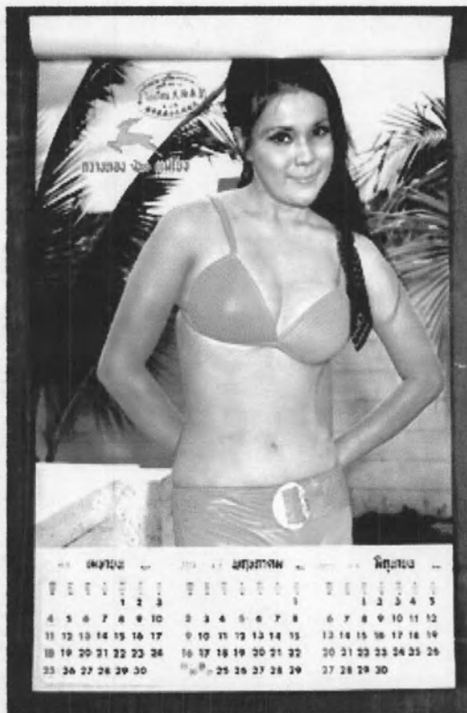
รูปที่ 27 ภาพนางแบบปฏิทินสุรากวางทอง ปี พ.ศ. 2514