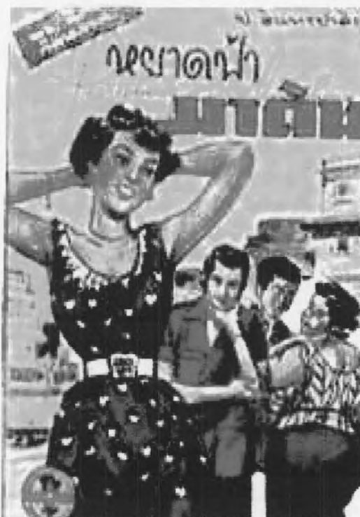
รูปที่ 15 สามเกลอตอน “หยาดฟ้ามาดิน” (ที่มา : พีระพงศ์ ดามาพงศ์, 2546 : 90)

นอกจากนี้แฟชั่นในยุคหลังสงครามสำหรับผู้หญิงนิยมสวมแว่นกันแดดกระจกสีฟ้า 53 เข้ากับชุดกระโปรง “นิวลุค” ผู้หญิงที่ใส่กระโปรงนิวลุคเรียกว่าเป็นสาวสังคมในสมัยนั้น 54 ส่วนเสื้อนิยมประดับลูกไม้ มีจีบที่ระบายและผมตัดหยิก 55