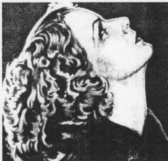
รูปที่ 5 เกรต้า การ์โบ รูปหน้าสวย จมูกโด่ง ไร้ผมตัดหยิกเป็นลอน

เมื่อตอนที่ เกรต้า การ์โบ อพยพจากยุโรป หวังมาแจ้งเกิดในวงการบันเทิงอเมริกัน เธอได้รับคำเตือนจากผู้อำนวยการสร้างฯ และผู้กำกับฯ นับแต่วินาทีแรกที่มาถึงว่า หน่อมอเมริกันไม่ชอบผู้หญิงอ้วน โชคดีที่เกรต้าเป็นเด็กกว้าง่าย รีบไปรีดน้ำหนักโดยพลัน และรักษาเนื้อรักษาตัวให้เช็กชื่อยุได้ตั้งแต่สมัยหนังเงียบจนหนังเริ่มพูดได้ 6 เห็นได้ว่ามายาคติความงามในขณะนั้นได้มีอิทธิพลต่อผู้หญิงอย่างเห็นได้ชัด การที่หน่อมอเมริกันไม่ชอบผู้หญิงอ้วน ทำให้เกรต้า การ์โบต้องไปลดน้ำหนัก เพื่อต้องการให้เป็นที่ยอมรับและเป็นที่ยอมรับ เนื่องจากมายาคติความงามในยุคนั้นนอกจากผู้หญิงสวยจะต้องมีหน้าตาสวยงามแล้ว จะต้องมีหน้าอก มีเอว มีสะโพก สวยงาม ไม่อ้วน รับกับเสื้อผ้าและทรงผมด้วย