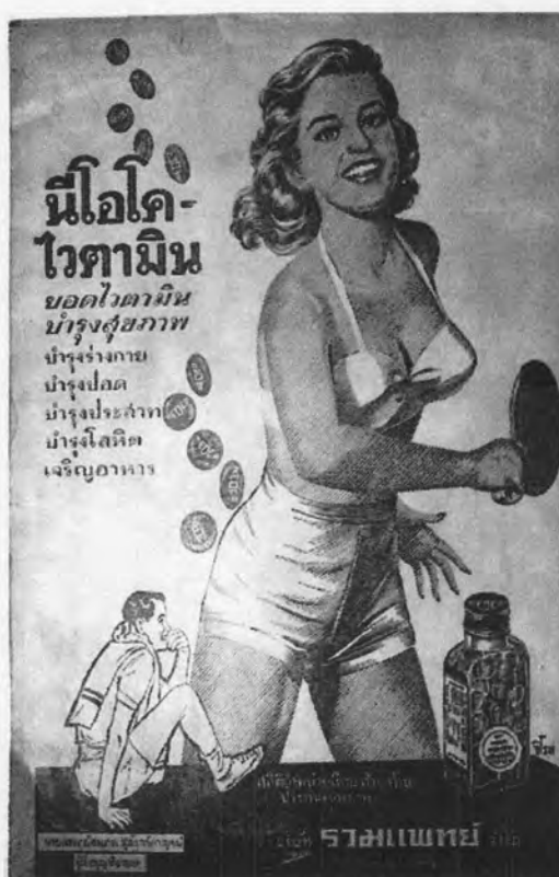
รูปที่ 21 ภาพโฆษณาในหนังสือพิมพ์ไทย วันจันทร์ ฉบับเรขมยุขสุดสัปดาห์ ปี 2493 วาดโดยจิโรห์ รุจิเทศ (ที่มา: http://www.cokethai.com )

นอกจากเครื่องสำอางแล้ว ในยุคนี้ยังมีการใช้วิตามินบำรุงร่างกายในการเสริมความงามอีกด้วย