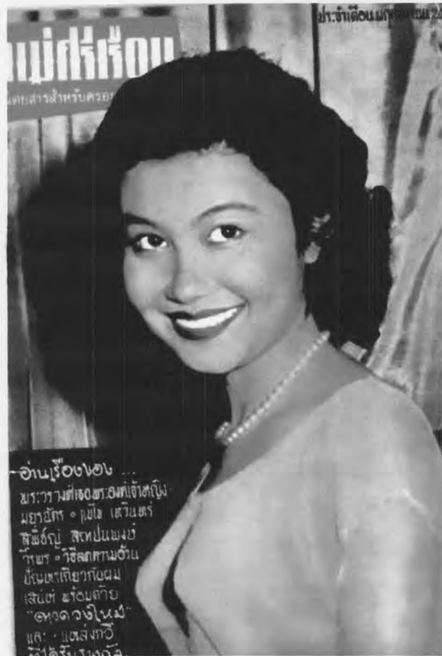
รูปที่ 19 ภาพปกนิตยสารแม่ศรีเรือน

จากรูปที่ 19 เห็นได้ชัดเจนถึงมายาคติความงามจากตะวันตกที่เข้ามามีผลต่อการเปลี่ยนแปลงด้านการแต่งหน้าและแต่งกายของผู้หญิงไทยในช่วงระยะเวลาก่อนปี พ.ศ. 2500 ได้เป็นอย่างดี จะเห็นได้ว่านางแบบในภาพแต่งคิ้วและดวงตาคมเข้ม ทาปากสีแดงสวยงาม ไว้ผมตัดตามแฟชั่น และใส่เสื้อยกทรงชนิดที่ทำให้มองเห็นหน้าอกที่ยกขึ้นชัดเจน และเนื่องจากเป็นนิตยสารผู้หญิงจึงมีเรื่องเกี่ยวกับความงามของผู้หญิงอยู่ด้วย ได้แก่ วิธีลดความอ้วน และปัญหาเกี่ยวกับผม สะท้อนให้เห็นว่าความอ้วนนั้นเป็นสิ่งที่ผู้หญิงไม่ปรารถนาเป็นอย่างยิ่ง และโดยเฉพาะแฟชั่นและมายาคติความงามที่เน้นเรื่องรูปทรงองค์เธอเป็นสำคัญด้วยแล้ว ยิ่งทำให้ผู้หญิงจะต้องหาวิธีการที่ทำให้ทรวดทรงองค์เธอได้รูป จึงจะแต่งกายได้ตามสมัยนิยม ส่วนเรื่องปัญหาของเส้นผมนั้น ก็เนื่องมาจากสมัยนั้นมีการใช้น้ำยาดัดผมกันมาก เส้นผมจึงต้องพบกับปัญหาแห้งกรอบ หรือแตกปลาย และในยุคนี้ยารุงเส้นผมก็ได้มีเข้ามาจำหน่ายแล้ว ดังนั้นผู้หญิงที่สนใจเรื่องความสวยความงามก็สามารถเสาะหาความรู้ตามนิตยสารผู้หญิงต่าง ๆ ได้