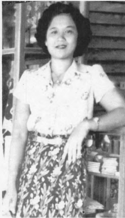
รูปที่ 12 ภาพถ่ายสตรีไทย เมื่อปี พ.ศ. 2495 ยังคงแต่งกายนุ่งผ้าถุง ไว้ผมตัด เช่นเดียวกับยุครัฐนิยม แต่เลิกสวมหมวกแล้ว