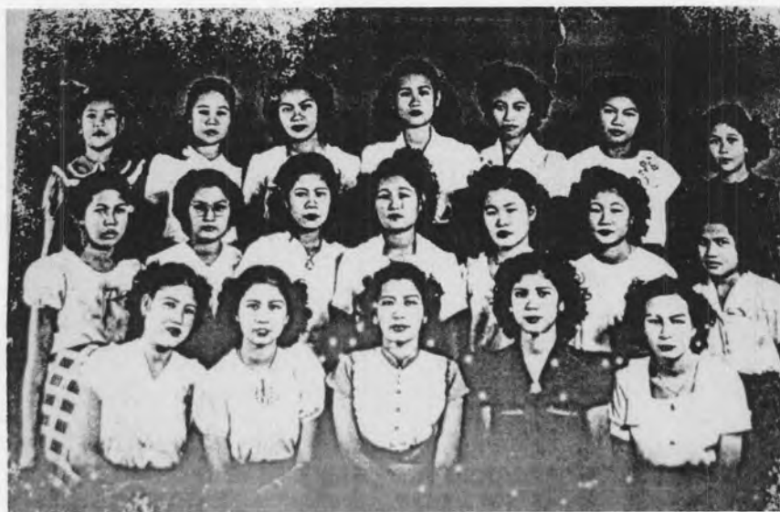
รูปที่ 23 ภาพถ่ายเมื่อปี พ.ศ. 2493

นับตั้งแต่ต้นรัชสมัยของรัชกาลที่ 7 เป็นต้นมา แฟชั่นผมตัดได้แพร่เข้ามาสู่ประเทศไทยผ่านทางสื่อภาพยนตร์ และการติดต่อทางสื่ออื่น ๆ 77 มีผลให้ผู้หญิงไทยส่วนใหญ่ในยุคนั้นต่างไว้ผมตัดกันถ้วนหน้า แม้จะมีประกาศรณรงค์ในยุคนจอมพล ป. พิบูลสงครามให้ไว้ผมยาวก็ตาม แต่ก็ไม่มีใครปล่อยผมยาวลงมาตรง ๆ ส่วนใหญ่จะตัดเป็นลอน เป็นคลื่น ตามแบบผู้หญิงชาวตะวันตก และด้วยการส่งเสริมให้ผู้หญิงไทยแต่งกายให้สวยงามนี้เอง จึงทำให้ร้านตัดผม โรงเรียนสอนตัดผมต่าง ๆ จึงเกิดขึ้นมากกว่าเดิมและตัดผมในแนวเดียวกันทั่วประเทศ 78