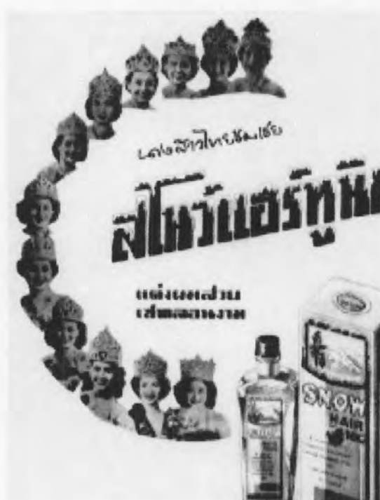
รูปที่ 20 ภาพโฆษณาน้ำมันแต่งผมสโนว์แฮร์ทูนิค

ในยุคนี้การโฆษณาสินค้าก็มีบทบาทต่อเรื่องความสวยงามของผู้หญิงไทยด้วยเช่นกัน เพราะการโฆษณา เป็นการเชิญชวนให้ผู้หญิงเกิดความรู้สึกต้องการเสริมความงามให้กับตนเองให้ เป็นไปตามแบบมาคติดความงามแบบตะวันตก ดังนั้นในยุคนี้นอกจากจะมีการใช้นางสาวไทยในการ ประชาสัมพันธ์ด้านความสวยความงามบนเวทีประกวดแล้ว ในการโฆษณาสินค้าที่เกี่ยวกับความ สวยความงามของวัฒนธรรมตะวันตก อาทิ เครื่องสำอาง ก็มีการนำผู้หญิงที่จัดได้ว่าสวยที่สุดได้แก่ นางสาวไทยมาใช้ในการโฆษณาด้วย ตัวอย่าง เช่น น้ำมันแต่งผมสโนว์แฮร์ทูนิค