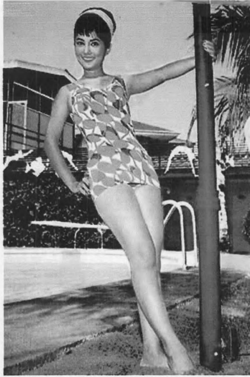
รูปที่ 26 ภาพถ่ายนางแบบใส่ชุดอาบนํ้าปี พ.ศ. 2513