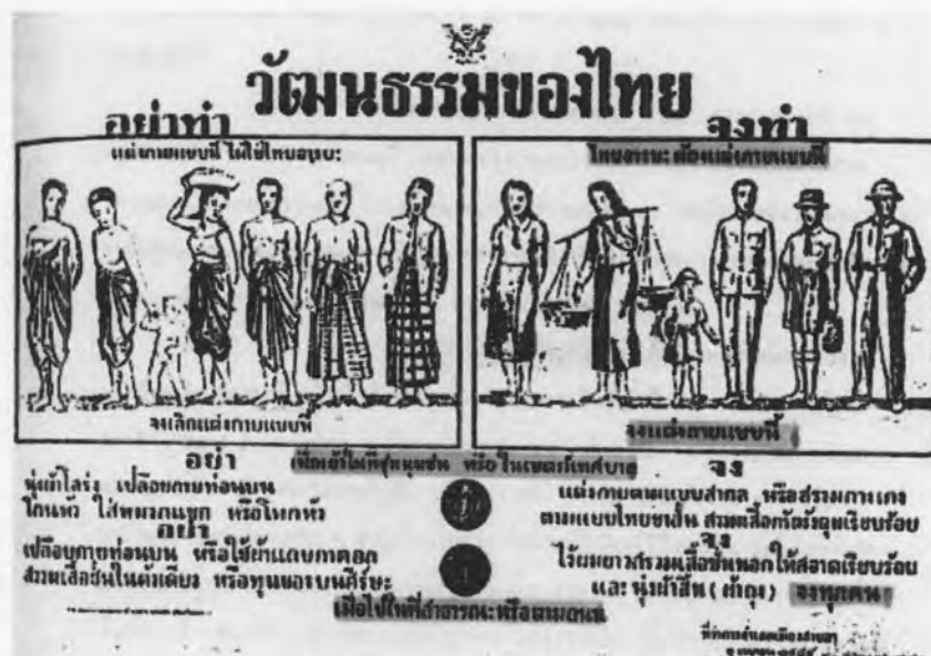
รูปที่ 10 ภาพตัวอย่างการแต่งกายที่รัฐบาลจอมพล ป. พิบูลสงคราม ประชาสัมพันธ์ให้ประชาชนปฏิบัติตาม