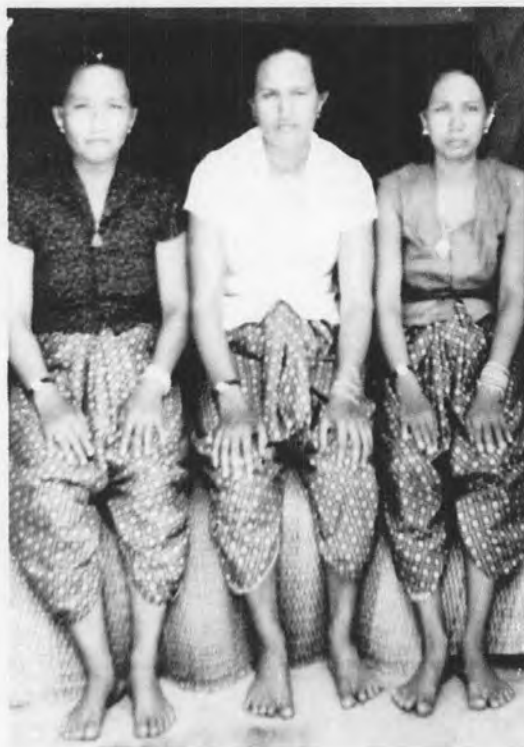
รูปที่ 4 แสดงการแต่งกายแบบนุ่งโจงกระเบน สวมเสื้อ และเริ่มไว้ผมยาวตัดเป็นคลื่น (พ.ศ. 2480)

จะเห็นได้ว่าในรูปที่ 3 สตรีในภาพใส่เสื้อแขนกระบอก ห่มสไบ นุ่งโจงกระเบนต่ำกว่าเข่า ไว้ผมทรงดอกกระพุ่ม นับเป็นการแต่งกายอย่างสุภาพก่อนที่จอมพล ป. พิบูลสงคราม จะประกาศใช้รัฏฐนิยม