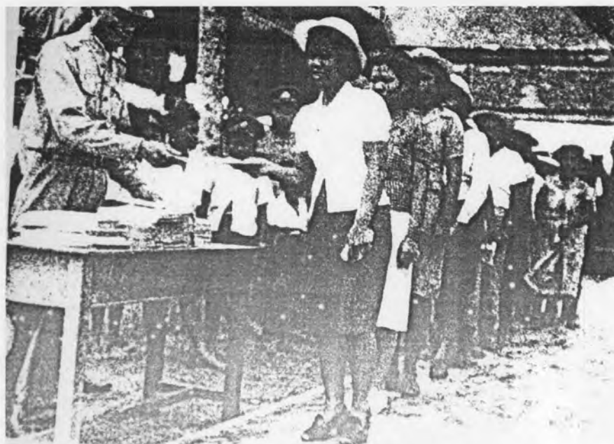
รูปที่ 9 ผู้หญิงสวมกระโปรงสวมหมวก สวมรองเท้า รอรับของแจกในยุครัฐนิยม

จากรูปที่ 8 - 10 แสดงให้เห็นว่ามายาคติความงามตามรูปแบบวัฒนธรรมตะวันตกที่จอมพล ป. พิบูลสงคราม พยายามปลูกสร้างให้เกิดขึ้นในสังคมไทย ตลอดจนสื่อจากต่างประเทศและภาพยนตร์ต่างประเทศที่นำแฟชั่นการแต่งกายเข้ามาอย่างต่อเนื่อง ทำให้ผู้หญิงตื่นตัวและแต่งกายตามรูปแบบนั้น เป็นการตอบสนองความต้องการของจอมพล ป. พิบูลสงคราม โดยที่ผู้หญิงไทยไม่รู้สึกรู้ว่าตัวเองได้ถูกใช้เป็นเครื่องมือในทางการเมืองและการแสวงหาอำนาจของรัฐบาลชุดนี้ในการที่จะก้าวไปสู่ความเป็นชาติที่มีอารยะตามที่จอมพล ป. พิบูลสงคราม ปรรณนา