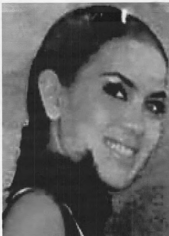
รูปที่ 34 แสดงการแต่งหน้าของผู้หญิงที่เน้นการแต่งหน้าเข้ม คิ้วเข้ม เช่นเดียวกับรูปที่ 33

เครื่องสำอางในยุคนี้ มีความก้าวหน้ามากขึ้น และเกิดขึ้นมามากมาย เครื่องสำอาง บางยี่ห้อ ยังคงมีการนำนางสาวไทย และนางงามจักรวาลมาเป็นนางแบบโฆษณา อาทิ เครื่องสำอาง Tell me วิตามินบำรุงผม จัสท์ โมเดิร์น เป็นต้น การนำผู้หญิงระดับนางสาวไทย และนางงามจักรวาล มาเป็นแบบในการโฆษณาสินค้า (รูปที่ 35) เป็นการเชิญชวน และรับรอง คุณภาพของสินค้าให้ผู้หญิงเกิดความรู้สึกต้องการที่จะสวย และมีความต้องการซื้อมาใช้ เพื่อที่จะได้ สวยอย่างที่นางสาวไทยและนางงามจักรวาลโฆษณา การสร้างมายาคติความงามเช่นนี้ยังคงมีมา อย่างต่อเนื่องเช่นเดียวกับในยุคแรก