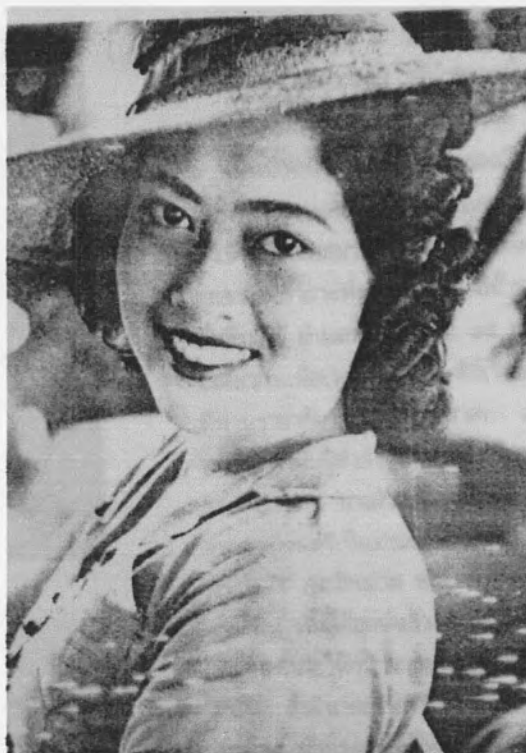
รูปที่ 7 นางสาวไทย พ.ศ. 2482 กับการสวมหมวกในยุคที่มีการประกาศใช้รัฐธรรมนูญ