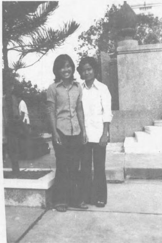
รูปที่ 32 แสดงการนุ่งกางเกงม้อด ภาพถ่าย ปี พ.ศ. 2514

นอกจากนี้ในยุคที่สองนี้ยังมี กางเกงม้อดที่มีลักษณะลิบตรงหัวเข่า แล้วบานออกไปจนคลุมเท้าเหมือนขาม้า พวกที่เรียนมหาวิทยาลัยหรือพวกที่ทำงานแล้วนิยมใส่กันมาก เนื่องจากเป็น กางเกงที่ค่อนข้างไปทางสุภาพ 92