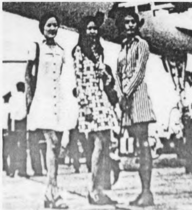
รูปที่ 28 แสดงการนุ่งกระโปรงมินิสเก็ต ปี พ.ศ. 2515 (ที่มา: เอนก นาวิกมูล, 2547 :226)

นับตั้งแต่มีคำสั่งให้เลิกนุ่งโจงกระเบน แต่ให้หันมานุ่งผ้าถุงหรือนุ่งกระโปรงแทน แฟชั่นกระโปรง โดยเฉพาะแฟชั่นกระโปรงนิวลูคที่นุ่งกันในสมัย จอมพล ป. พิบูลสงคราม เป็นต้นมา ได้มีวิวัฒนาการมาจนกระทั่งแฟชั่นกระโปรงสั้นเหนือเข่าจากตะวันตกได้แพร่เข้ามาประมาณปี พ.ศ. 2511 ก่อนหรือหลังจากนี้ไม่นาน 85 นั่นคือ มินิสเก็ต หรือที่เรียกสั้น ๆ ง่าย ๆ ว่ากระโปรงมินิ ผู้หญิงในยุคที่สองนี้นิยมนุ่งกระโปรงมินิสเก็ตกันอยู่ทั่วไป มินิสเก็ตสร้างความตื่นตาตื่นใจให้กับคนเดินถนนมาก แต่เมื่อแต่งตามกันมากขึ้นก็กลายเป็นความฮือฮาลงไป