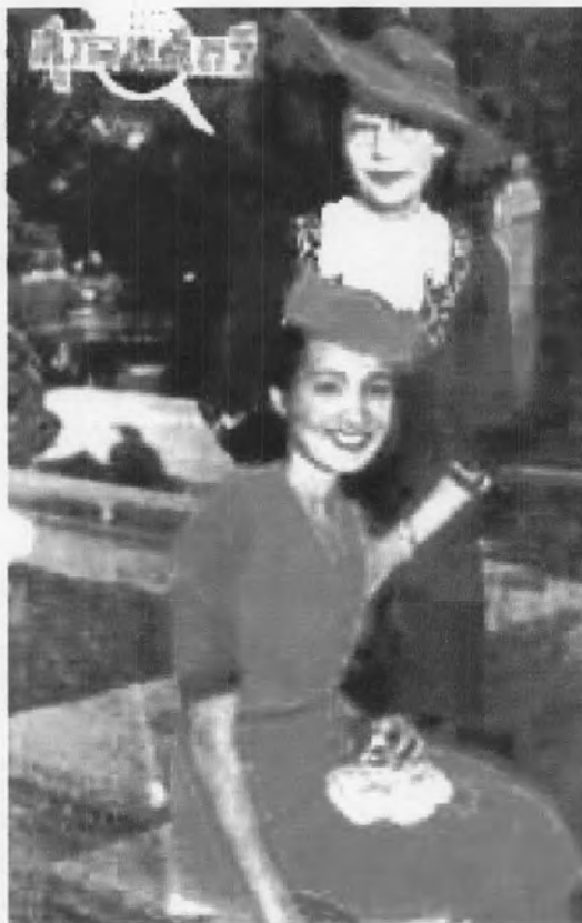
รูปที่ 11 แฟชั่นสตรี จากนิตยสารสุภาพสตรี ฉบับวันที่ 4 เมษายน พ.ศ. 2485

จากรูปที่ 11 เห็นได้ว่ามีความชัดเจนของมายาคติความงามจากตะวันตกที่เข้ามา ประกอบกับความเคร่งครัดของรัฐนิยม ส่งผลให้การแต่งกายของผู้หญิงไทยในหน้าปกนิตยสารมี รูปแบบการแต่งกายตามแบบตะวันตกด้วยเช่นกัน โดยสุภาพสตรีในภาพมีการนุ่งกระโปรง สวม หมวก แต่งหน้า ทาปาก ไว้ผมยาวและตัดผมอย่างสวยงาม รูปแบบการแต่งกายดังกล่าว เป็นการ ตอบสนองนโยบายรัฐบาลของจอมพล ป. พิบูลสงคราม และเป็นไปตามรูปแบบมายาคติความงาม ตะวันตกที่จอมพล ป. พิบูลสงคราม ปรารถนาให้เป็นเช่นนั้น โดยเมื่อผู้หญิงอื่นทั่วไปเห็นและรู้สึก คล้อยตามในมายาคติความงามรูปแบบนี้และรู้สึกลุ่มหลงตามก็จะนำไปเป็นรูปแบบในการตกแต่ง ร่างกายให้สวยงามต่อไป