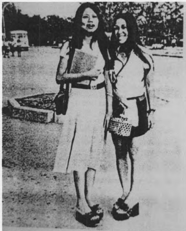
รูปที่ 29 แสดงการนุ่งกระโปรงมิดี และกระโปรงมินิสเกิร์ตของนักศึกษามหาวิทยาลัยรามคำแหง ปี พ.ศ. 2516

การนุ่งกระโปรงมินินิยมสวมรองเท้า หนา ๆ สูง ๆ ที่เรียกว่า “ตึก” หรือ “เตารีด” บางคนสวมรองเท้าสูงถึง 3-4 นิ้ว หรือมากกว่านั้นก็มี ถึงแม้จะทำด้วยไม้เนื้อเบา แต่ก็ดูน่าหวาดเสียวสำหรับคนอื่นที่เห็นมาก รองเท้าแบบนี้เรียกกันว่า ตึก หรือ เตารีด 88 เพราะมีรูปร่างและมีความสูงอย่างชื่อนั่นเอง ภายหลังจากเมื่อกระโปรงมินิ หายไป รองเท้านี้ก็หายไปด้วย จะสังเกตได้ว่าการสวมรองเท้าจะเปลี่ยนไปตาม แฟชั่นเสื้อผ้า เช่น กระโปรงนิวลูคสวมรับกับรองเท้าหัวแหลมทั้งส้นเตี้ยและส้นสูง สำหรับการสวมรองเท้าจะพบว่าเมื่อใดที่ชายกระโปรงยาวสั้นรองเท้าจะเรียวเล็กลง แต่ถ้าชายกระโปรงสั้นขึ้น รองเท้าจะมีส้นเตี้ยและใหญ่