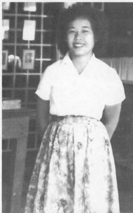
รูปที่ 13 สุภาพสตรีนุ่งกระโปรงนิวลุค ไว้ผมตัดหยิก เลิกสวมหมวก (ภาพถ่ายปี พ.ศ. 2496)