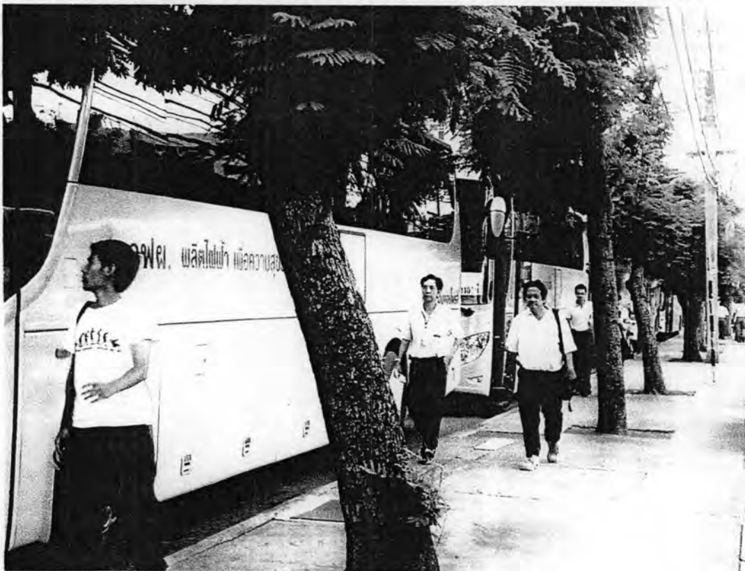
ถ่ายเมื่อ 17 ธันวาคม พ.ศ.2551