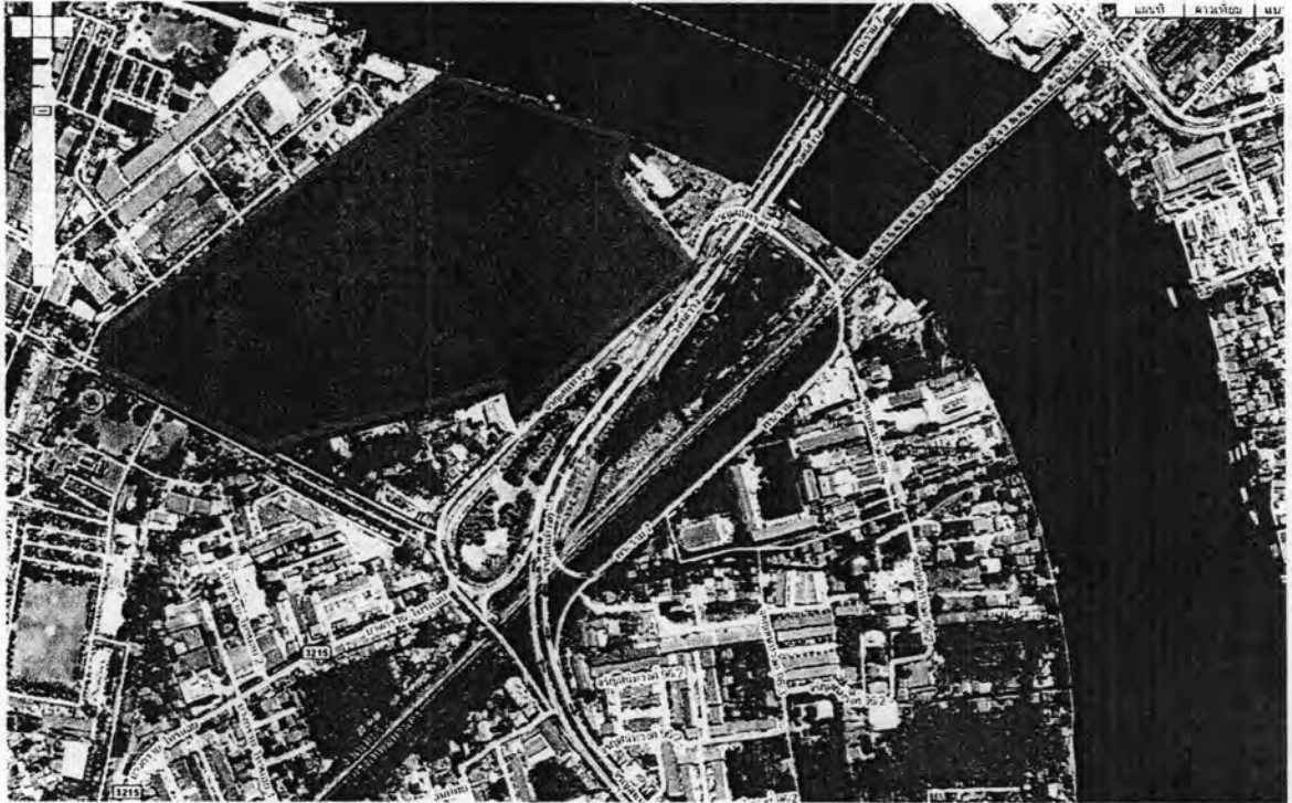
ภาพที่ 4.1 แสดงที่ตั้งของการไฟฟ้าผลิตแห่งประเทศไทยสำนักงานใหญ่

ที่ตั้งสำนักงานใหญ่ของการไฟฟ้าผลิตแห่งประเทศไทย ตั้งอยู่ที่ เลขที่ 53 หมู่ที่ 2 ถนนจรัญ สนิทวงศ์ ตำบลบางกรวยอำเภอบางกรวย จ.นนทบุรี