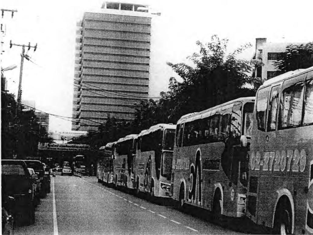
ภาพที่ 4.4 แสดงรถบริการรับส่งพนักงานฟฟ.ที่จอดรถรับพนักงานในช่วงเลิกงาน

ที่มา : การไฟฟ้าฝ่ายผลิตแห่งประเทศไทยสำนักงานใหญ่ ถ่ายเมื่อ 17 ธันวาคม พ.ศ.2551