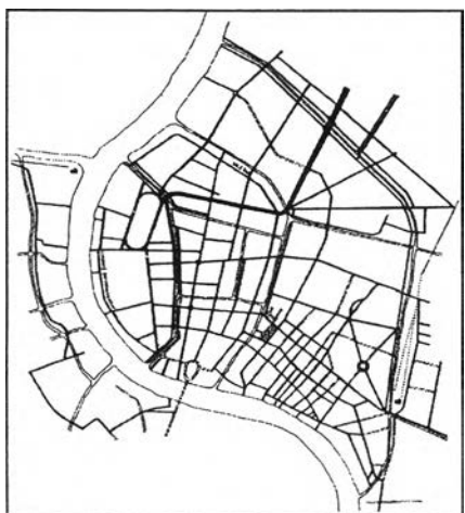
รัชกาลที่ 7

แผนที่ที่ 1: แสดงการตัดถนนในเขตเกาะรัตนโกสินทร์ สมัยรัชกาลที่ 4-7