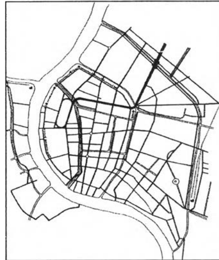
รัชกาลที่ 6