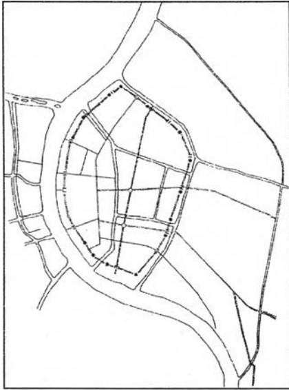
รัชกาลที่ 4