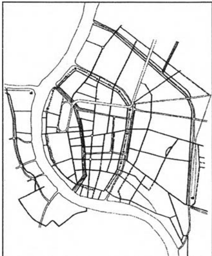
รัชกาลที่ 5 หลังตัดถนนราชดำเนิน