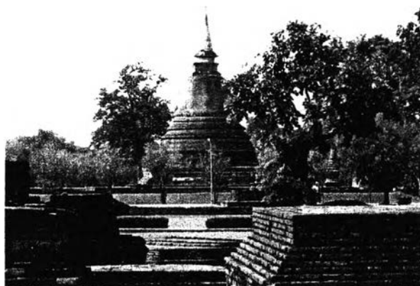
รูปที่ 2.1 แสดงแหล่งท่องเที่ยวทางวัฒนธรรม

Peter (1969 : 148-149) ได้จัดหมวดหมู่ ประเภทแหล่งท่องเที่ยวออกเป็น 5 ประเภทด้วยกัน คือ