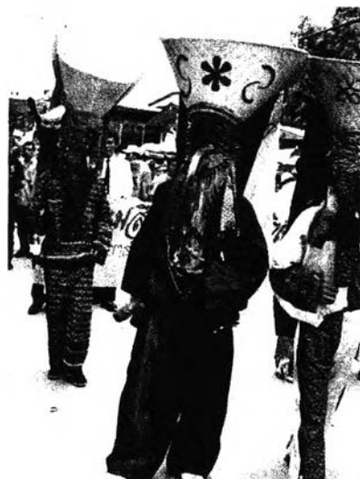
รูปที่ 2.2 แสดงแหล่งท่องเที่ยวที่แสดงออกถึงประเพณีต่างๆ

1. แหล่งท่องเที่ยวทางวัฒนธรรม (Cultural Attractions) ได้แก่สถานที่สำคัญทางประวัติศาสตร์ อนุสาวรีย์ พิพิธภัณฑ์ วัฒนธรรมรูปแบบใหม่ๆ สถาบันทางการศึกษาหรือทางการเมือง