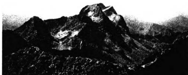
รูปที่ 2.3 แหล่งท่องเที่ยวที่แสดงออกถึงความงดงามในรูปแบบต่างๆของภูมิประเทศ

ที่มา : http://www.tat.or.th เมษายน 2549