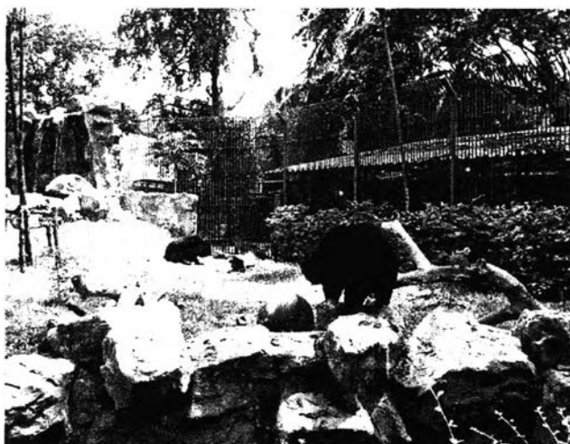
รูปที่ 2.4 แหล่งท่องเที่ยวประเภทที่ให้ความบันเทิง

3. แหล่งท่องเที่ยวที่แสดงออกถึงความงดงามในรูปแบบต่างๆของภูมิประเทศ (Scenic Attraction) ได้แก่สถานที่สวยงามตามธรรมชาติ อุทยานแห่งชาติ ชีวิตสัตว์ป่า ชายทะเล และแหล่งท่องเที่ยวบนภูเขาต่างๆ