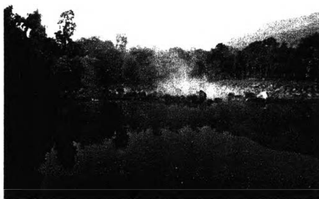
รูปที่ 2.5 แหล่งท่องเที่ยวอื่นๆ

ที่มา : http://www.tat.or.th เมษายน 2549