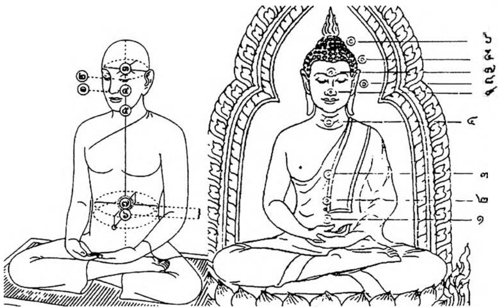
ภาพที่ 6 เปรียบเทียบฐานที่ตั้งของใจ

เมื่อนำแบบฐานที่ตั้งของใจมาเปรียบเทียบกัน จะพบว่ามีความคล้ายคลึงกัน ดังภาพที่ 6