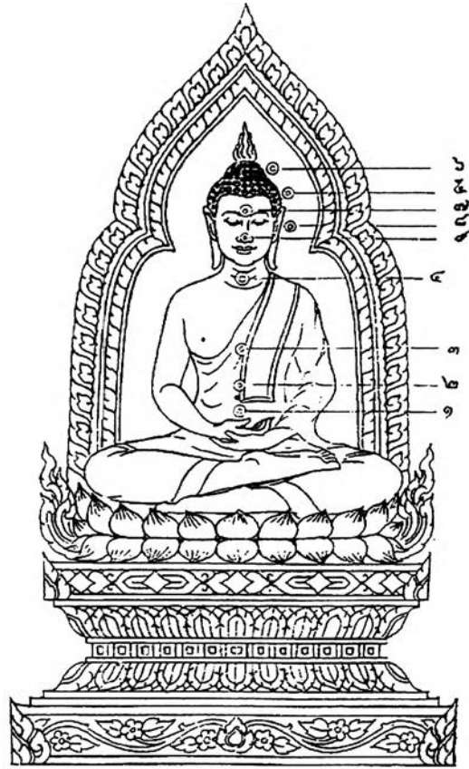
ภาพที่ 5 ฐานที่ตั้งของใจ ตามแบบของคัมภีร์โบราณ

เมื่อนำแบบฐานที่ตั้งของใจมาเปรียบเทียบกัน จะพบว่ามีความคล้ายคลึงกัน ดังภาพที่ 6