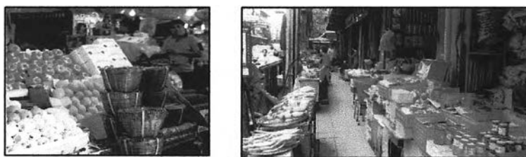
ภาพที่ 6-1 ร้านค้าพวงแหวนแร่แฝงลอยภายในเขตสัมพันธวงศ์

- ควรมีการจัดระเบียบร้านค้าจำหน่ายพวงแหวนแร่แฝงลอย ให้นำเสนอต่อผู้ซื้อและนักท่องเที่ยว โดยใช้พื้นที่ให้เกิดประโยชน์สูงสุด ไม่เกะกะรกรุงรัง แต่มีลักษณะเป็นธรรมชาติ สะอาด และสะดวกในการเข้าถึง เพื่อสร้างความเป็นระเบียบให้แก่กิจกรรมด้านการค้าภายในพื้นที่ นอกจากนี้ ควรมีการประสานความร่วมมือกับผู้ค้าต่างๆให้มากขึ้นกว่าเดิม โดยเน้นสร้างความเข้าใจที่ถูกต้อง เพื่อสนับสนุนให้กิจกรรมการค้าในย่านมีความก้าวหน้า และสร้างความสัมพันธ์ที่ดีให้เกิดขึ้นในย่าน