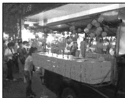
ภาพที่ 6-5 บรรยากาศของงานเทศกาลตรุษจีนที่ผ่านมา