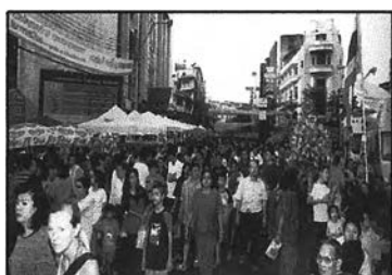
ภาพที่ 6-6 ส่งเสริมกิจกรรมการค้าของแต่ละย่าน

การสร้างความยั่งยืนของการท่องเที่ยวในเขตสัมพันธวงศ์ จึงจำเป็นต้องสร้างความเจริญทางเศรษฐกิจซึ่งถือเป็นจุดเด่นของพื้นที่ที่มีสภาพเป็นย่านการค้า เช่น การส่งเสริมกิจกรรมการค้าของแต่ละย่านโดยเน้นที่ลักษณะเด่น เช่น ย่านเยาวราชเป็นย่านค้าทอง และอาหาร ย่านสำเพ็งเป็นย่านค้าส่งผ้าและของชำร่วย เป็นต้น และสร้างความเชื่อมโยงให้แก่แต่ละย่าน เพื่อสร้างความเข้มแข็งทางการค้าให้แก่พื้นที่ โดยพัฒนาควบคู่ไปกับการอนุรักษ์ทางด้านสภาพแวดล้อมของเมือง เช่น การปรับปรุงภูมิทัศน์ให้มีความสวยงาม เป็นระเบียบแต่ไม่ทำลายเอกลักษณ์ดั้งเดิมของพื้นที่ การปรับปรุงระบบการจราจรภายในพื้นที่ ทำให้ปริมาณรถยนต์ลดลง ซึ่งเป็นการลดปริมาณมลพิษทางอากาศและเสียง เป็นต้น