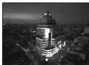
ภาพที่ 6-7 ปรับปรุงภูมิทัศน์ชุมชนให้นำอยู่

จากที่กล่าวมา การพัฒนาทางเศรษฐกิจจะเป็นพัฒนากิจกรรมการค้าของสัมพันธวงศ์ และทำให้แต่ละย่านสามารถอยู่ได้ด้วยตัวเอง มีเงินหมุนเวียนในระบบเศรษฐกิจ และการพัฒนาทางสภาพแวดล้อม จะทำให้สัมพันธวงศ์มีแนวโน้มที่จะกลับมามีบทบาทในฐานะชุมชนพักอาศัยเพิ่มขึ้น เนื่องจากสภาพแวดล้อมชุมชนจะมีความน่าอยู่ มีความเป็นครอบครัว และมีชีวิตชีวามากขึ้นกว่าแต่ก่อนที่ส่วนใหญ่มีบทบาทหลักเป็นเพียงย่านการค้า โดยมีการควบคุมทรัพยากรการท่องเที่ยวในพื้นที่อย่างเหมาะสม ควรมุ่งเน้นการสร้างความเข้าใจที่ถูกต้อง และความมีส่วนร่วมของประชาชนรวมถึงนักท่องเที่ยวที่เข้ามาเที่ยว ในด้านการพัฒนาทางเศรษฐกิจ และการรักษา