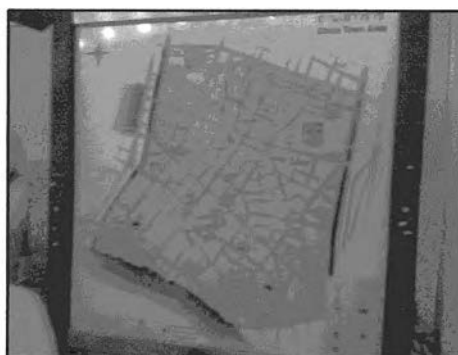
ภาพที่ 6-3 ป้ายบอกทางและแผนที่ในสัมพันธวงศ์

- ปรับปรุงและขยายพื้นที่การให้บริการสาธารณูปโภคและสาธารณูปการ ให้ครอบคลุมในพื้นที่แหล่งท่องเที่ยว จากการสำรวจ สาธารณูปโภคและสาธารณูปการในแหล่งท่องเที่ยวยังไม่ครอบคลุมในการรองรับด้านการท่องเที่ยวทั้งหมด เช่น ควรมีการเพิ่มป้ายบอก สัญลักษณ์ต่างๆ เพื่อเป็นการอำนวยความสะดวกแก่นักท่องเที่ยว เนื่องจากที่ผ่านมาแม้แต่การประชาสัมพันธ์ผ่านสื่อ แต่เมื่อเข้ามาในพื้นที่แล้วในบางแห่งบางจุด เช่น ย่านทรงวาด ย่านเซียงกง เป็นต้น จะมีป้ายบอกทางจำนวนน้อยมาก จึงควรมีการวางแผนพัฒนาเพื่อนำไปสู่ทิศทางที่เหมาะสม รองรับการท่องเที่ยวในอนาคตได้อย่างมีประสิทธิภาพ