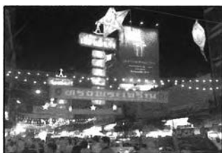
ภาพที่ 6-2 ความมีเอกลักษณ์ไชน่าทาวน์ของเยาวราช

- ควรมีการจัดระเบียบของเมือง ปรับปรุงภูมิทัศน์ให้คงเอกลักษณ์ไชน่าทาวน์ และให้มีทัศนียภาพที่สวยงาม น่ามอง สถานที่ท่องเที่ยวต่างๆ ควรมีการดูแลและปรับปรุงให้สวยงาม แลดูสะอาด น่าทัศนอาจร แต่ไม่ควรมีการปรับเปลี่ยนจนเป็นการทำลายเอกลักษณ์ที่มีคุณค่าไป นอกจากนี้