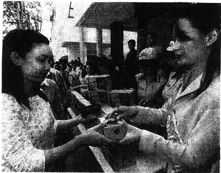
ไถ่โรโรค : ประชาชนพาทั้งแมวกับไก่ทอดเคเอฟซี และสหฟาร์ม ที่โนนนาแจฬพี ตามโครงการรณรงค์ เพื่อการบริโภคไก่ของหอการค้าไทย เมื่อวานนี้ (4 ก.พ.) โดยหวังว่าจะสร้างความมั่นใจว่ากินไก่ปลอดภัย ท่ามกลางการแพร่ระบาดของโรคไข้หวัดนก ในหลายพื้นที่ของประเทศ

Veterinary Library & Information Center, Faculty of Veterinary Science Chulalongkorn University, Henri Dunant Road, Bangkok 10330 Tel. 252-0980, 255-8853, 218-9554-7 Fax: 255-8853, 252-0980