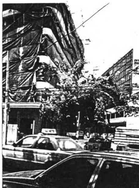
รูปที่ 4.1 ลักษณะอาคารสมัยใหม่ในพื้นที่ศึกษา