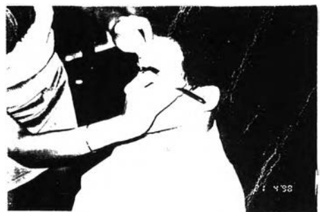
ภาพที่ 6.2 การแต่งคิ้วผู้ชาย

วิธีการแต่งคิ้วเช่นนี้ต้องการให้รูปทรงคิ้วดูสวยงาม แต่ไม่ต้องการให้ผู้ดูรู้สึกว่าเป็นความตั้งใจแต่งเป็นระดับที่ใช้เมื่อผู้เป็นช่างต้องการแต่งคิ้วให้มีความเป็นธรรมชาติแต่ยังคงอิงกับพื้นฐานความเป็นจริงของคิ้วเดิมเป็นหลักและไม่แก้ไขดัดแปลง