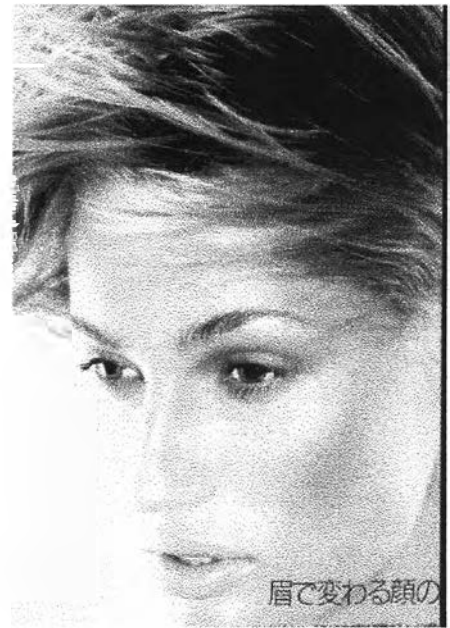
ภาพที่ 6.1 การแต่งคิ้วแบบธรรมชาติ

เป็นการใช้แปรงปิดคิ้วเพื่อให้คิ้วมีความเป็นระเบียบ และอาจเพิ่มสีสันทันได้บ้างแต่เพียงบาง ๆ ด้วยการใช้ภูกันแดดสีเทาตาที่มีสีออกโทนน้ำตาลเข้มปิดบริเวณคิ้วแต่ไม่เปลี่ยนแปลงรูปคิ้วเดิม ลักษณะเช่นนี้ใช้กับการแต่งคิ้วของผู้ชาย. และคิ้วของนักแสดงและผู้นำเสนอรายการที่ต้องการให้มีบุคลิกภาพที่สดใสเป็นธรรมชาติ แต่หากว่าสี สันของคิ้วนั้นเข้มโดยธรรมชาติอยู่แล้วก็ใช้เพียงมาสคาร่าปิดขนคิ้วให้ตั้งตรงเรียงเป็นเส้นระเบียบ ลักษณะการใช้รหัสการถ่ายทอดความหมายคือ ไม่เขียนคิ้วให้เป็นรูปทรงที่ชัดเจนและใช้สีสันทันที่เข้ม