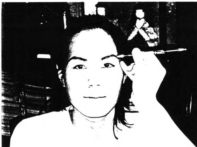
ภาพที่6.3 การเขียนคิ้วลักษณะที่หนึ่ง เน้นแสดงบุคลิกที่เป็นธรรมชาติ