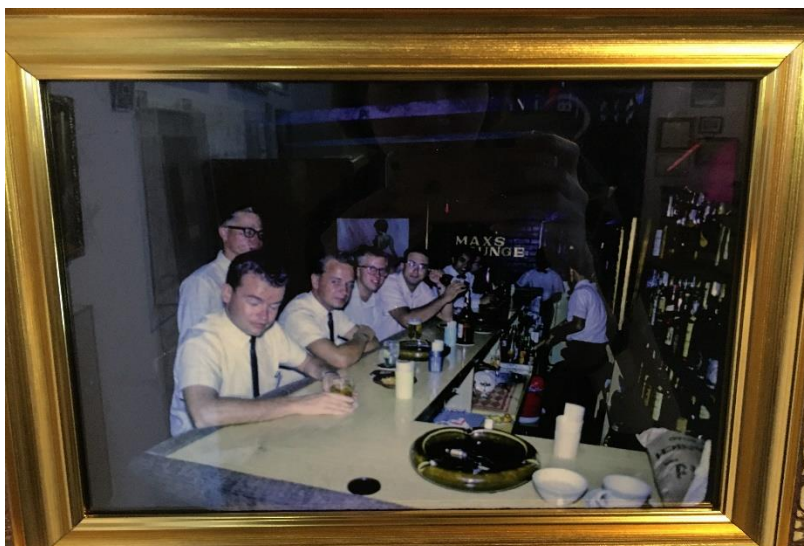
ภาพที่ 4 เจ้าหน้าที่หน่วยข่าวกรองที่มาพบปะกันในบาร์แห่งหนึ่งย่านพัฒน์พงษ์

ประโยชน์จากความเป็นหญิงของผู้หญิงบริการที่คนทั่วไปมักจะมองว่าไม่มีความเกี่ยวข้องประเด็นความมั่นคงในการดำเนินยุทธศาสตร์ความมั่นคงอีกด้วย