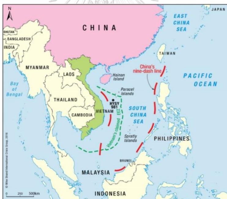
ภาพประกอบ 1 แผนที่จุดพิพาทที่สำคัญระหว่างเวียดนามกับจีน