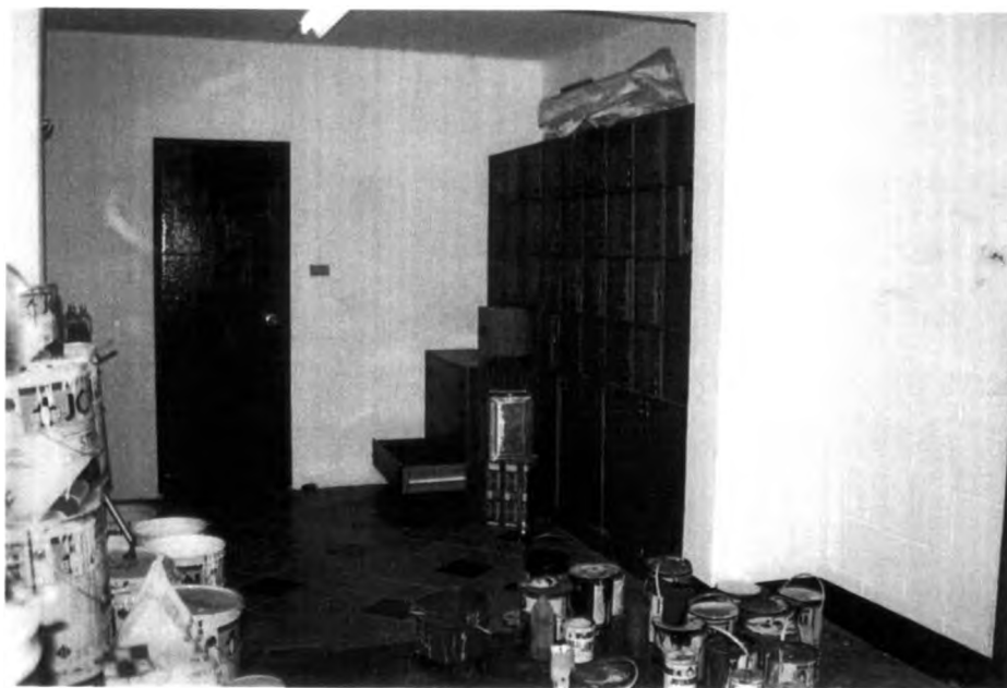
สภาพห้องเก็บวัสดุอุปกรณ์ศิลปะของโรงเรียนศรีสงครามวิทยา