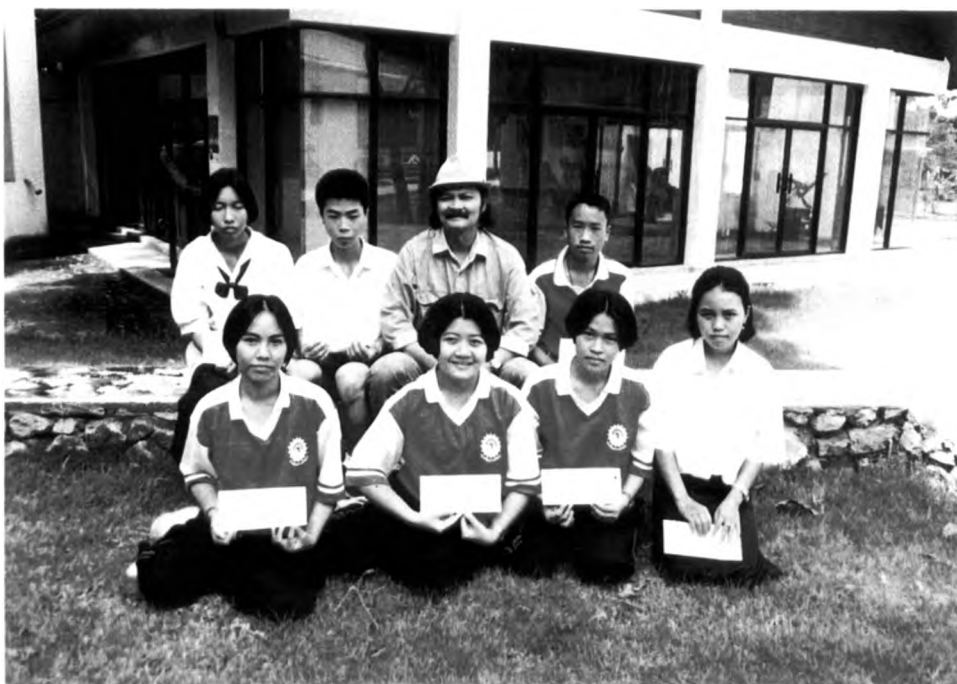
หลังสิ้นสุดโครงการโรงเรียนศรีสงครามวิทยา มีการมอบทุนการศึกษาและเกียรติบัตร ให้กับนักเรียนที่มีผลงานดีเด่นด้านศิลปะ