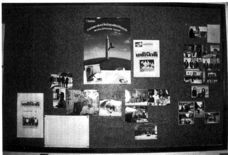
การจัดสภาพแวดล้อมทางศิลปะ ภายในห้องปฏิบัติการของโรงเรียนศรีสงครามวิทยา