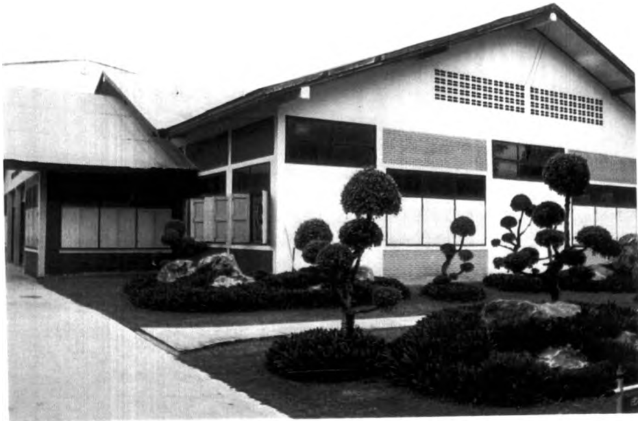
การจัดสภาพแวดล้อมภายนอกห้องปฏิบัติการทางศิลปะของโรงเรียนเลยพิทยาคม