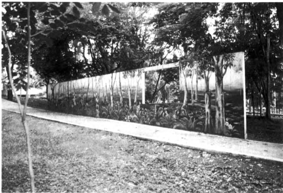
การจัดสภาพแวดล้อมทางศิลปะภายนอกห้องปฏิบัติการของโรงเรียนศรีสงครามวิทยา