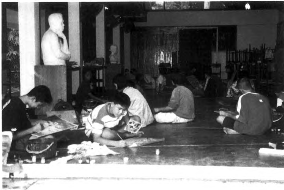
การปฏิบัติกิจกรรมศิลปะของนักเรียนภายในห้องปฏิบัติการของโรงเรียนศรีสงครามวิทยา