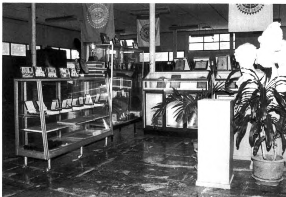
การจัดสภาพแวดล้อมทางศิลปะภายในห้องปฏิบัติการของโรงเรียนเลยพิทยาคม