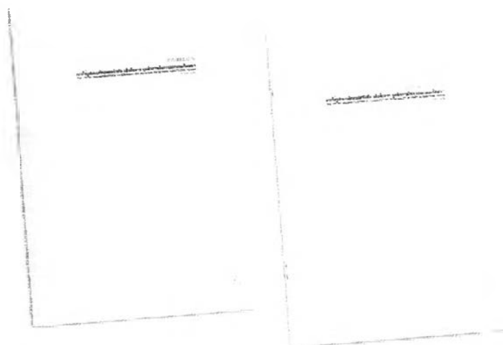
ภาพที่ 35 ภาพรูปเล่มของแบบสอบถามและคู่มือแบบสอบถาม

จากการรวบรวมข้อมูล และวรรณกรรมที่ศึกษาทั้งหมดได้ข้อสรุปทุกๆส่วน หลังจากนั้นนำข้อมูลแต่ละส่วนมาทำเป็นแบบสอบถาม 140 ตัวอย่างโฆษณาแต่ละ ตัวอย่าง โฆษณาจะประกอบด้วยคำถาม 4 ข้อ ซึ่งแต่ละข้อจะ สัมพันธ์กับคู่มือแบบสอบถาม โดยแบบสอบถามจะอธิบายด้วยภาพและข้อมูลเบื้องต้นอย่างสั้นๆ