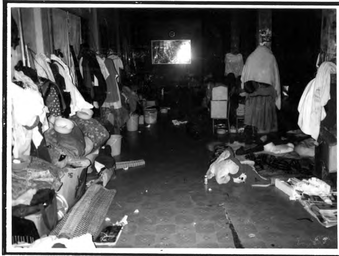
วัดโบสถ์วรดิตถ์