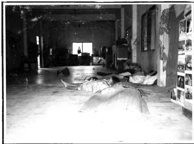
วัดทุ่งเหยียง