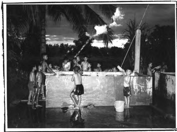
การรักษาความสะอาดของร่างกาย