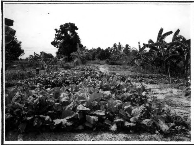
การปลูกฝักสวนครัว