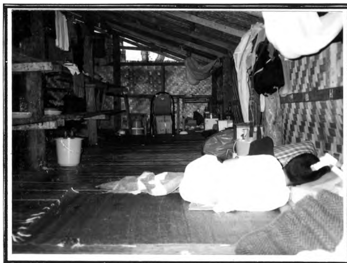
วัดศรีโสดา