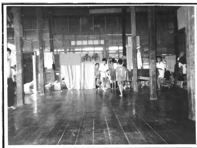
วัดยางคอยเกลือ