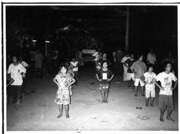
การออกกำลังกาย