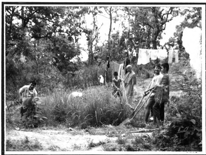
การช่วยงานภายในวัด