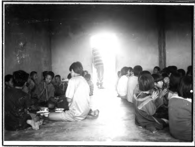
การรับประทานอาหารร่วมกัน