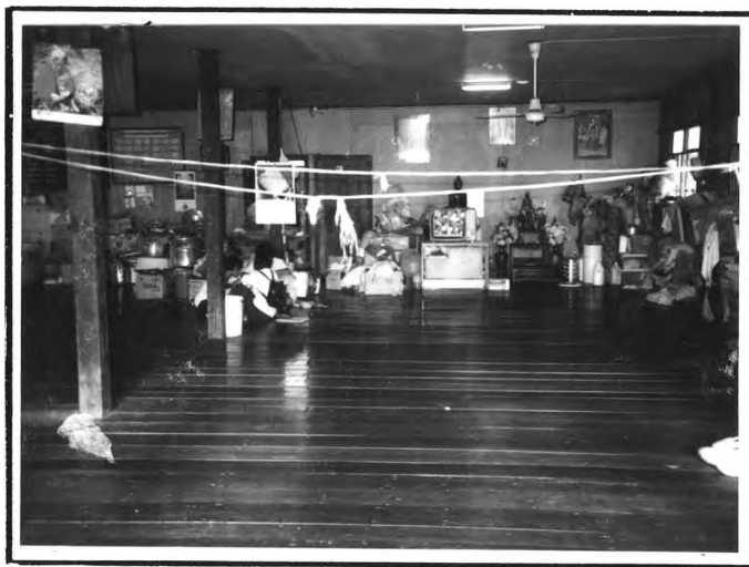
วัดสระแก้ว