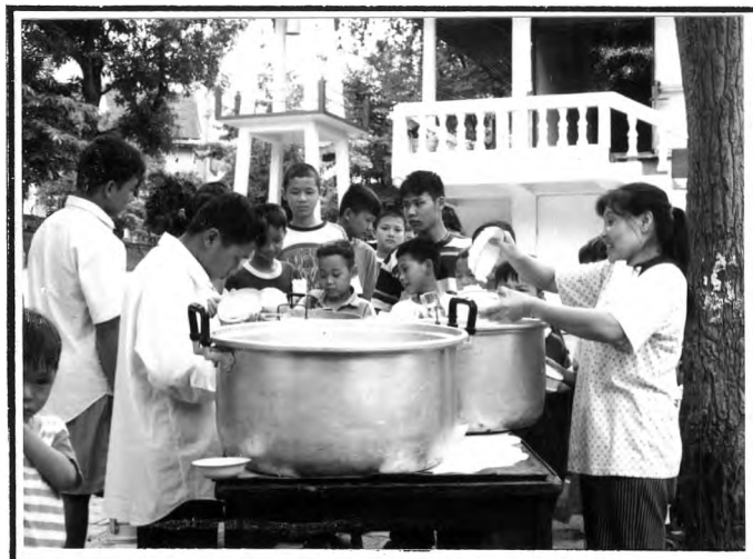
การเข้าแถวรับอาหาร