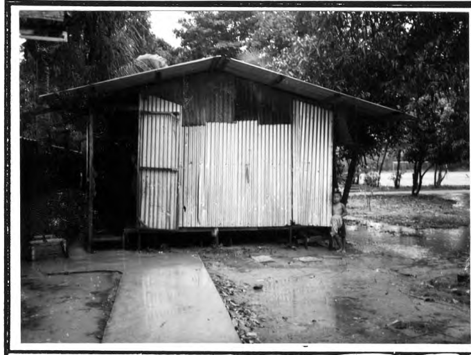
วัดชุมทอง