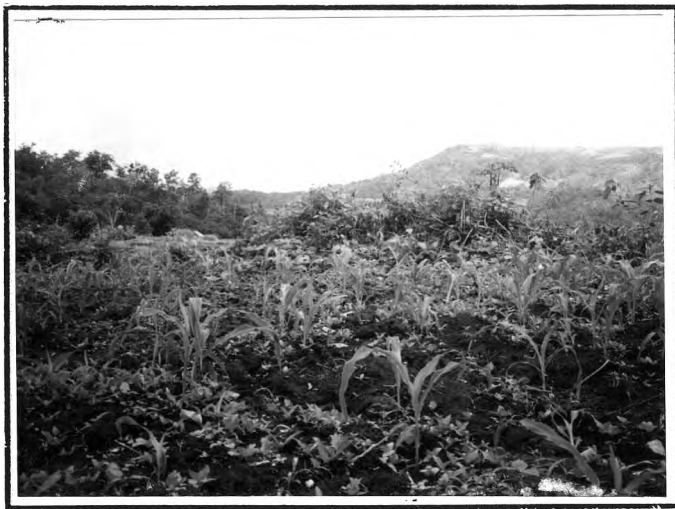
การปลูกข้าวโพด