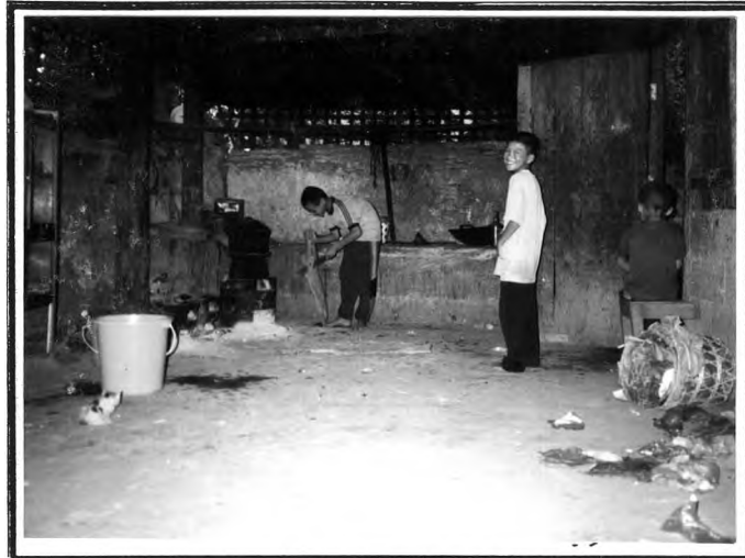
การทำอาหารรับประทานเอง