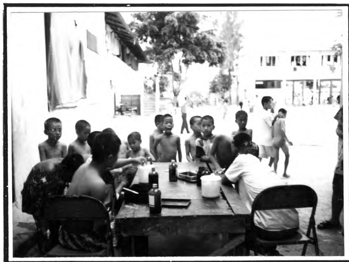
การรักษาโรคผิวหนัง