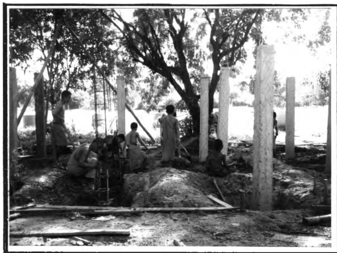
การทำงานก่อสร้างภายในวัด