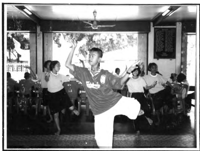
การรำนโนราห์