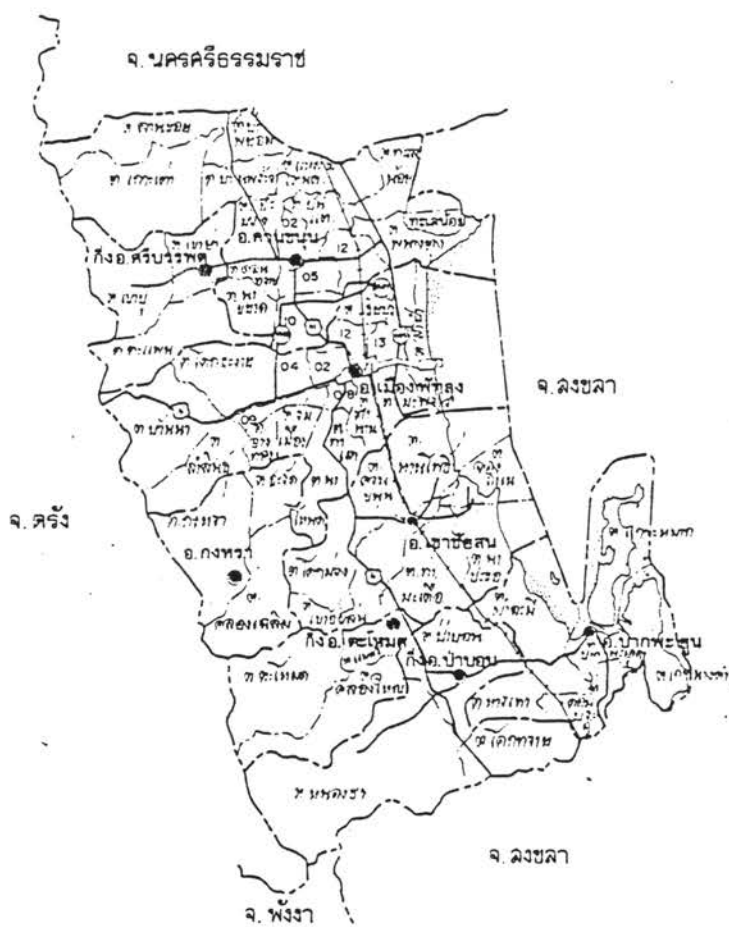
ภาพที่ 4 แผนที่แสดงเขตการปกครอง จังหวัดนัทกลง