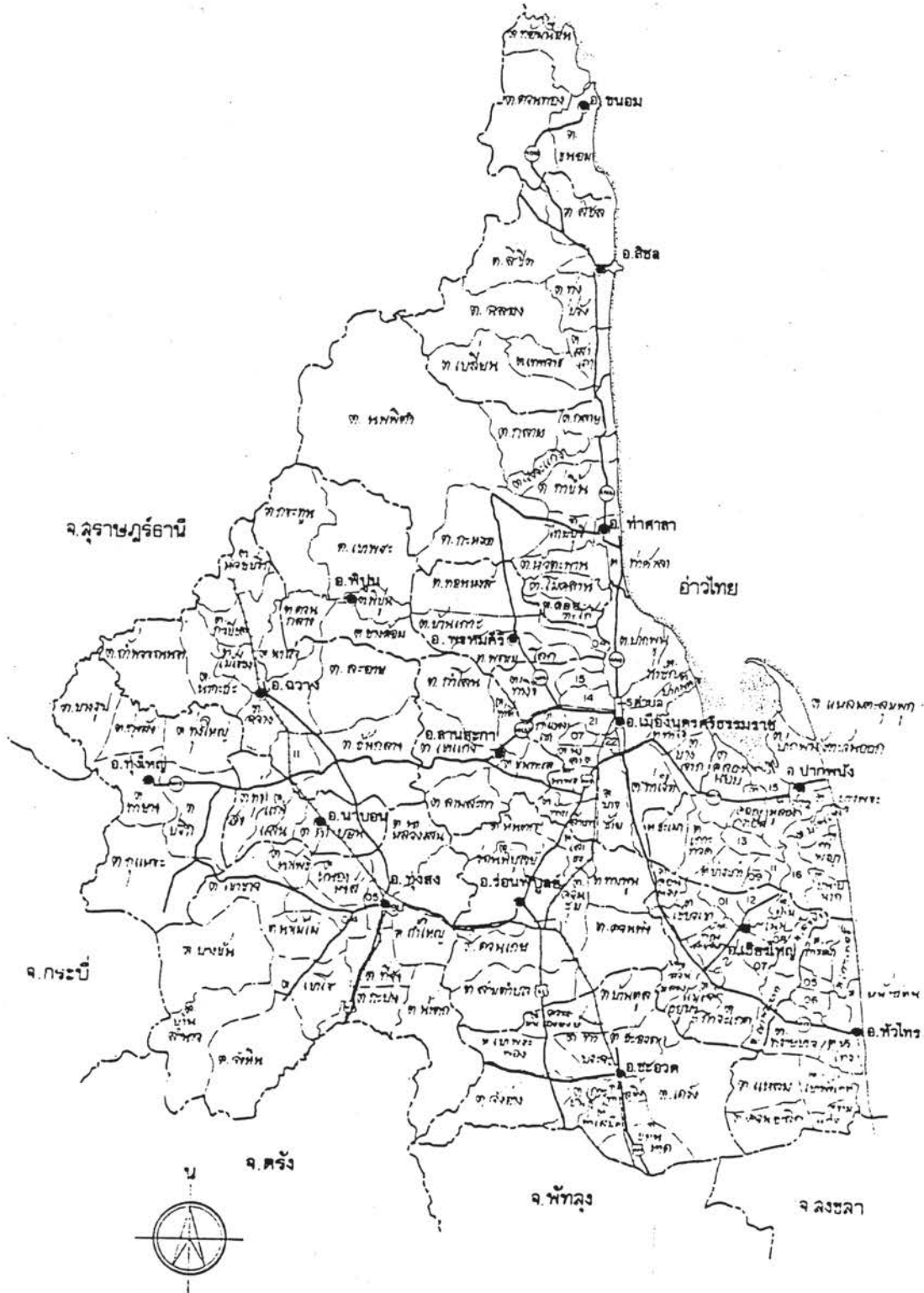
ภาพที่ 2 แผนที่แสดงเขตการปกครอง จังหวัดนครศรีธรรมราช