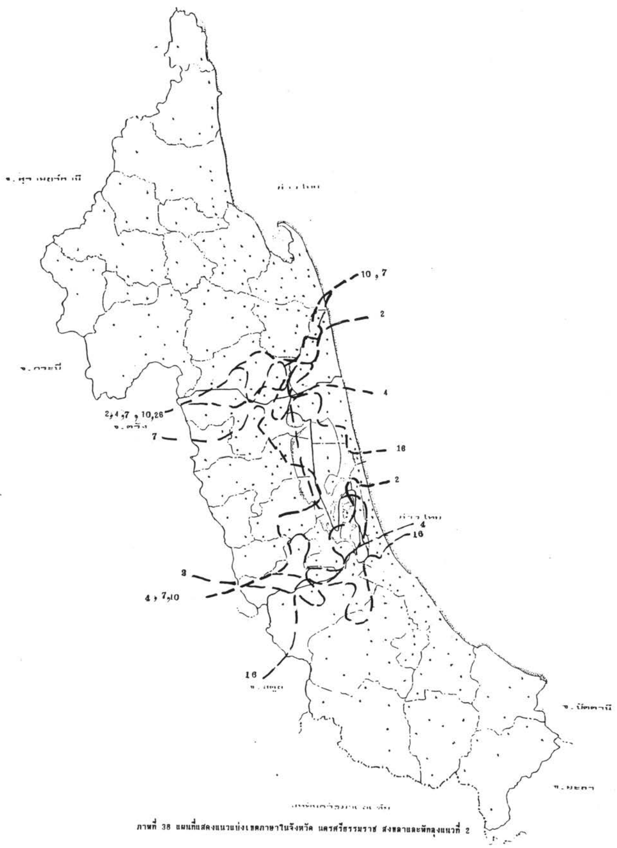
ภาพที่ 38 แผนที่แสดงแนวแบ่งเขตภาษาในจังหวัด เชียงใหม่ นครศรีธรรมราช สงขลาและพัทลุงแผนที่ 2