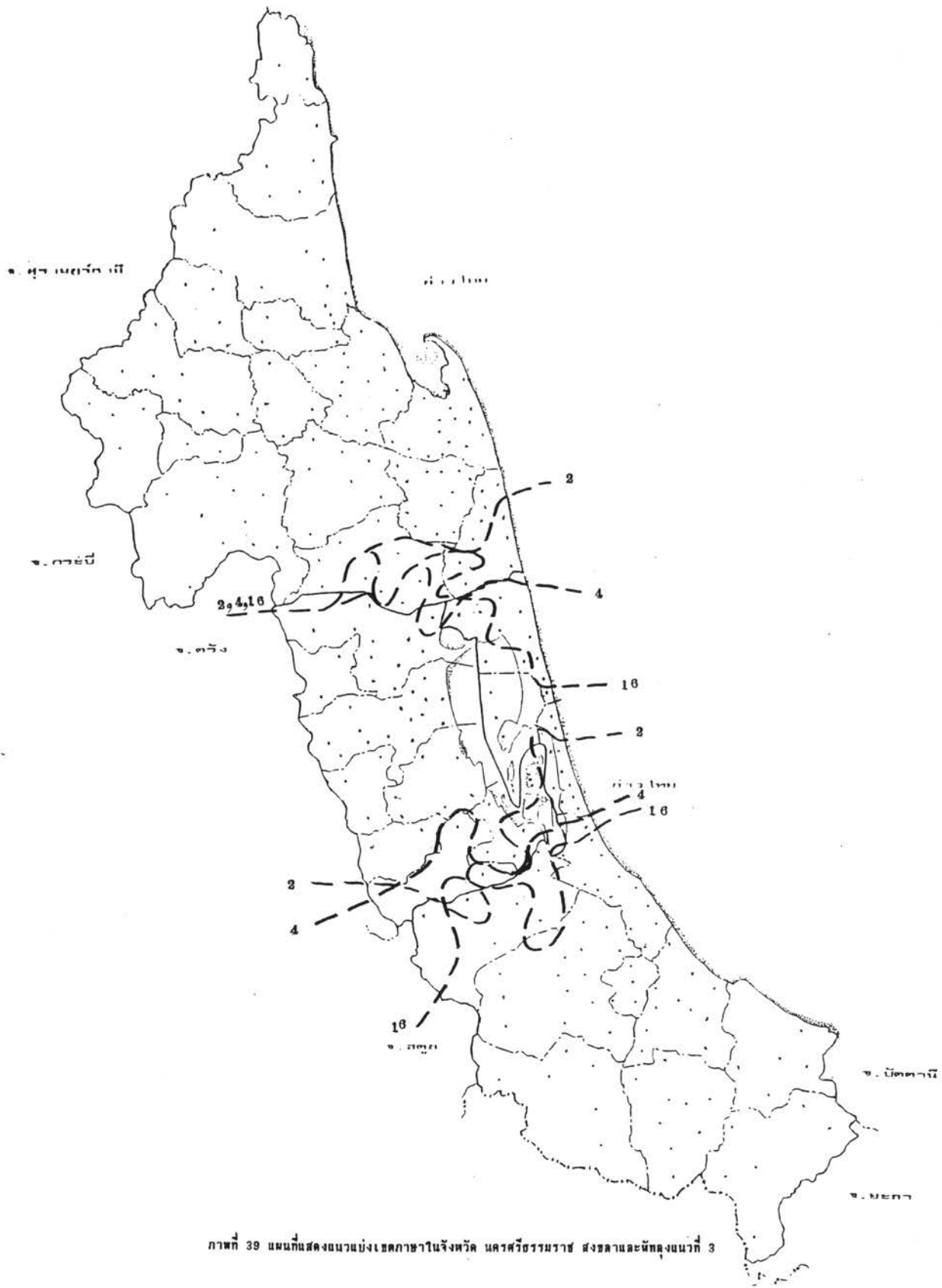
ภาพที่ 39 แผนที่แสดงถนนบึงเขตภาษาในจังหวัด นครศรีธรรมราช จังหวัดและพื้นที่ลงหน่วย 3