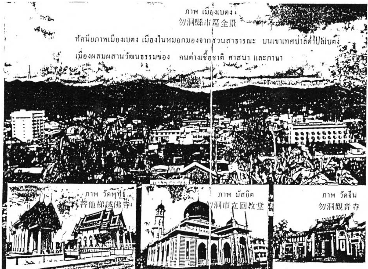
รูปที่ 1.1 แสดงเขตชุมชนที่จะศึกษา

อำเภอเบตง จังหวัดยะลา เป็นอำเภอที่มีพื้นที่ทั้งหมด 1,550 ตารางกิโลเมตร แต่มีพื้นที่ที่เป็นเขตชุมชนอำเภอ หรือเป็นที่ตั้งของส่วนราชการในอำเภอและมีความเจริญทางเศรษฐกิจ และสังคมประมาณ 1.6 ตารางกิโลเมตร และมีประชาชนทั้งอำเภอ 39,546 คน (มกราคม 253๑) โดยมีประชาชนอาศัยอยู่ในเขตตัวอำเภอ 17,539 คน สำหรับการศึกษาคั้งนี้ผู้วิจัยมุ่งจำกัดขอบเขตการศึกษาเฉพาะเขตชุมชนอำเภอเบตงที่มีลักษณะเป็นแอ่ง หรือกระทะที่เป็นศูนย์กลางความเจริญทางเศรษฐกิจ อุตสาหกรรม พาณิชยกรรม และเป็นที่ตั้งของส่วนราชการต่าง ๆ เท่านั้น (โปรดดูรูปที่ 1.1 และ รูปที่ 1.2 ประกอบ)