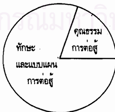
แผนภาพที่ 3 ภาพความรู้กระบี่กระบองที่ถ่ายทอดในปัจจุบัน

ความรู้ศิลปะการต่อสู้ป้องกันตัวกระบี่กระบองจากการศึกษาประวัติศาสตร์พบว่า มีลักษณะของความรู้ 3 ด้านคือ ความรู้ด้านทักษะและแบบแผนของการต่อสู้ ความรู้ด้านการใช้พลังจิตควบคู่กับพลังกาย ความรู้ด้านคุณธรรมของนักสู้ เมื่อทำการศึกษาคณานามจะพบว่า ความรู้ของศิลปะการต่อสู้ป้องกันตัวแบบไทยกระบี่กระบองนั้น มีสอนเฉพาะความรู้ด้านทักษะและแบบแผนของการต่อสู้ และความรู้ด้านคุณธรรมของนักสู้ โดยจะเน้นเรื่องของทักษะและแบบแผนการต่อสู้มากกว่าเรื่องคุณธรรมการต่อสู้ ดังภาพ