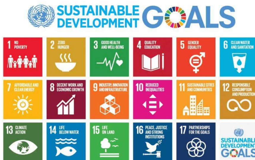
รูปภาพที่ 1 เป้าหมายการพัฒนาที่ยั่งยืนขององค์การสหประชาชาติ

ประเทศไทยในฐานะรัฐสมาชิกแห่งองค์การสหประชาชาติ ที่ได้รับเอาเป้าหมาย “การพัฒนาที่ยั่งยืน” (Sustainable Development Goals: SDGs) มาใช้เป็นแนวทางการทำงานของหน่วยงานต่างๆ และได้ลงนามในกรอบภาคีความร่วมมือเพื่อการพัฒนาแห่งสหประชาชาติ (United Nations Partnership Framework Thailand 2017-2021: UNPAF 2017-2021) เมื่อเดือนกรกฎาคม พ.ศ. 2560 ซึ่งเป็นการอธิบายแนวทางการทำงานของหน่วยงานในระบบสหประชาชาติทั้งหมด เพื่อช่วยเหลือในประเด็นด้านการพัฒนาที่สำคัญของประเทศ โดยกรอบภาคีดังกล่าวได้ระบุรายละเอียดถึงผลที่จะเกิดขึ้นในช่วงเวลา 5 ปีข้างหน้า และความรับผิดชอบของหน่วยงานของสหประชาชาติตามที่ตกลงกับรัฐบาล 9 เป้าหมายการพัฒนาที่ยั่งยืน 17 ข้อ มีรายละเอียดดังรูปภาพที่ 1 ดังนี้