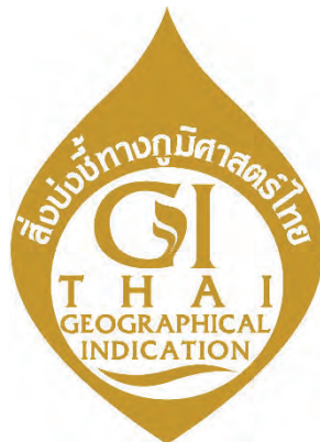
ตราสัญลักษณ์สิ่งบ่งชี้ทางภูมิศาสตร์ไทย

โดยได้ออกประกาศกรมทรัพย์สินทางปัญญา เรื่อง ตราสัญลักษณ์สิ่งบ่งชี้ทางภูมิศาสตร์ไทย พ.ศ. 2563 และระเบียบกรมทรัพย์สินทางปัญญาว่าด้วยการอนุญาตให้ใช้ตราสัญลักษณ์สิ่งบ่งชี้ทางภูมิศาสตร์ไทย พ.ศ. 2563 โดยมีสาระสำคัญ ดังนี้