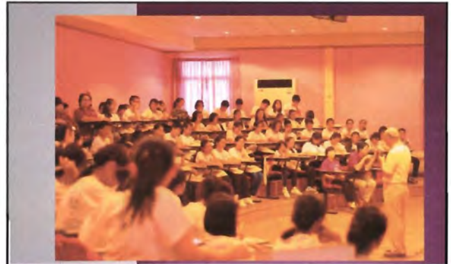
โครงการอนุรักษ์พันธุกรรมพืชอันเนื่องมาจากพระราชดำริ สมเด็จพระเทพรัตนราชสุดาฯ สยามบรมราชกุมารี ค่ายเยาวชน ความหลากหลายทางชีวภาพและการอนุรักษ์ทรัพยากรธรรมชาติระหว่างวันที่ 26 - 31 มีนาคม 2556