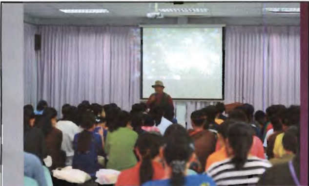
โครงการอนุรักษ์พันธุกรรมพืชอันเนื่องมาจากพระราชดำริ สมเด็จพระเทพรัตนราชสุดาฯ สยามบรมราชกุมารี ค่ายเยาวชน ความหลากหลายทางชีวภาพและการอนุรักษ์ทรัพยากรธรรมชาติระหว่างวันที่ 26 - 31 มีนาคม 2556 เกาะสมสารกับงานอนุรักษ์