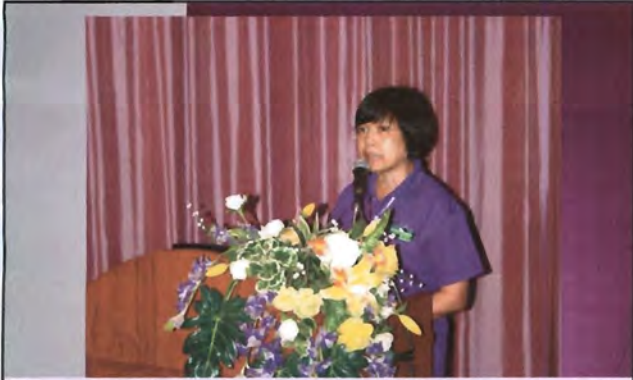
โครงการอนุรักษ์พันธุกรรมพืชอันเนื่องมาจากพระราชดำริ สมเด็จพระเทพรัตนราชสุดาฯ สยามบรมราชกุมารี ค่ายเยาวชน ความหลากหลายทางชีวภาพและการอนุรักษ์ทรัพยากรธรรมชาติระหว่างวันที่ 26 - 31 มีนาคม 2556