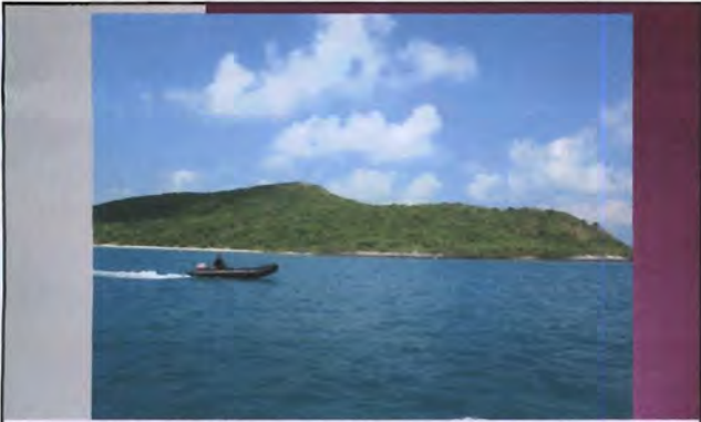
โครงการอนุรักษ์พันธุกรรมพืชอันเนื่องมาจากพระราชดำริ สมเด็จพระเทพรัตนราชสุดาฯ สยามบรมราชกุมารี ค่ายเยาวชน ความหลากหลายทางชีวภาพและการอนุรักษ์ทรัพยากรธรรมชาติระหว่างวันที่ 26 - 31 มีนาคม 2556 เกาะสมสารกับงานอนุรักษ์