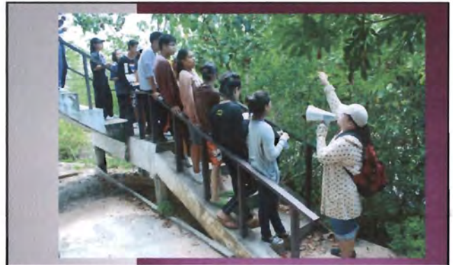
โครงการอนุรักษ์พันธุกรรมพืชอันเนื่องมาจากพระราชดำริ สมเด็จพระเทพรัตนราชสุดาฯ สยามบรมราชกุมารี ค่ายเยาวชน ความหลากหลายทางชีวภาพและการอนุรักษ์ทรัพยากรธรรมชาติระหว่างวันที่ 26 - 31 มีนาคม 2556 ศึกษานิเวศป่าชายเลน