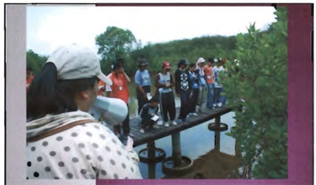
โครงการอนุรักษ์พันธุกรรมพืชอันเนื่องมาจากพระราชดำริ สมเด็จพระเทพรัตนราชสุดาฯ สยามบรมราชกุมารี ค่ายเยาวชน ความหลากหลายทางชีวภาพและการอนุรักษ์ทรัพยากรธรรมชาติระหว่างวันที่ 26 - 31 มีนาคม 2556 ศึกษานิเวศป่าชายเลน