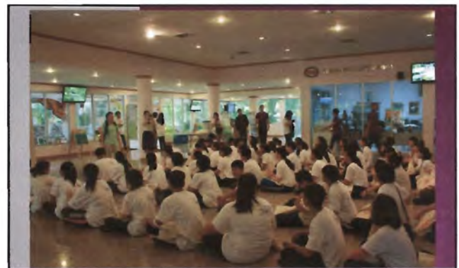
โครงการอนุรักษ์พันธุกรรมพืชอันเนื่องมาจากพระราชดำริ สมเด็จพระเทพรัตนราชสุดาฯ สยามบรมราชกุมารี ค่ายเยาวชน ความหลากหลายทางชีวภาพและการอนุรักษ์ทรัพยากรธรรมชาติระหว่างวันที่ 26 - 31 มีนาคม 2556