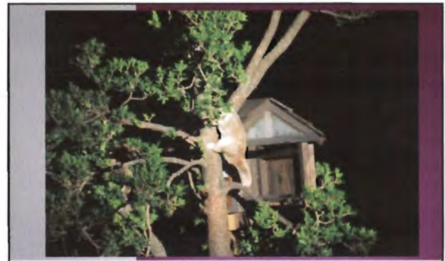
โครงการอนุรักษ์พันธุกรรมพืชอันเนื่องมาจากพระราชดำริ สมเด็จพระเทพรัตนราชสุดาฯ สยามบรมราชกุมารี ค่ายเยาวชน ความหลากหลายทางชีวภาพและการอนุรักษ์ทรัพยากรธรรมชาติระหว่างวันที่ 26 - 31 มีนาคม 2556 พฤติกรรมของสัตว์กลางคืน (After Dark - Night Safari)