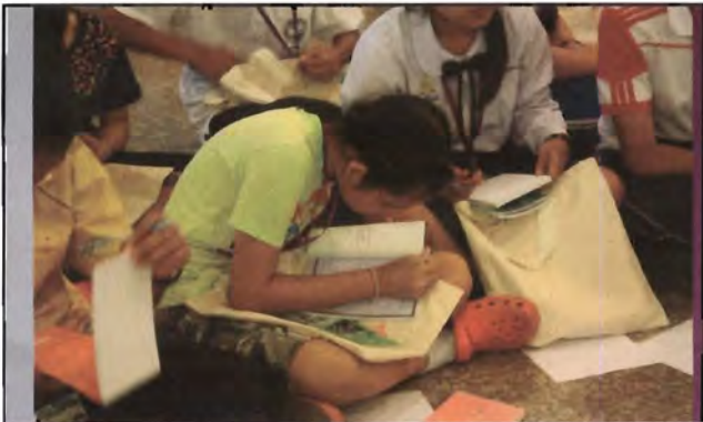
โครงการอนุรักษ์พันธุกรรมพืชอันเนื่องมาจากพระราชดำริ สมเด็จพระเทพรัตนราชสุดาฯ สยามบรมราชกุมารี ค่ายเยาวชน ความหลากหลายทางชีวภาพและการอนุรักษ์ทรัพยากรธรรมชาติระหว่างวันที่ 26 - 31 มีนาคม 2556