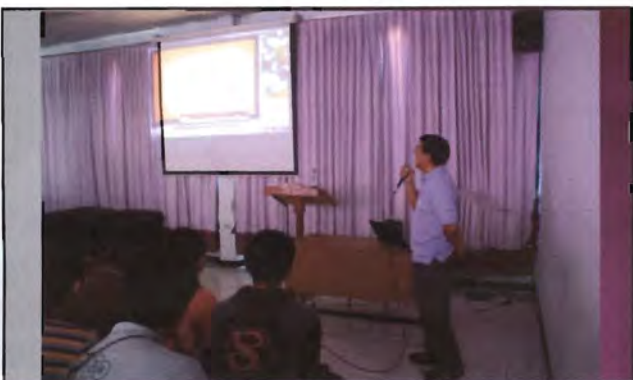
โครงการอนุรักษ์พันธุกรรมพืชอันเนื่องมาจากพระราชดำริ สมเด็จพระเทพรัตนราชสุดาฯ สยามบรมราชกุมารี ค่ายเยาวชน ความหลากหลายทางชีวภาพและการอนุรักษ์ทรัพยากรธรรมชาติระหว่างวันที่ 26 - 31 มีนาคม 2556 เกาะสมสารกับงานอนุรักษ์