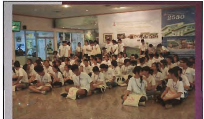
โครงการอนุรักษ์พันธุกรรมพืชอันเนื่องมาจากพระราชดำริ สมเด็จพระเทพรัตนราชสุดาฯ สยามบรมราชกุมารี ค่ายเยาวชน ความหลากหลายทางชีวภาพและการอนุรักษ์ทรัพยากรธรรมชาติระหว่างวันที่ 26 - 31 มีนาคม 2556