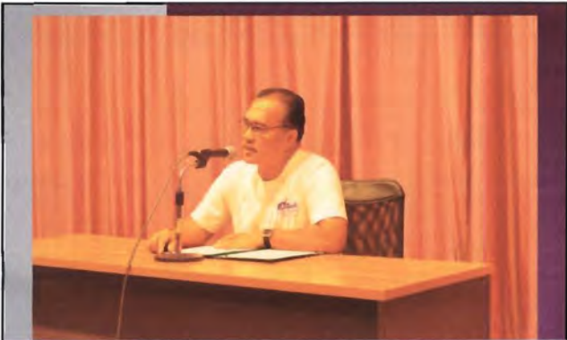
โครงการอนุรักษ์พันธุกรรมพืชอันเนื่องมาจากพระราชดำริ สมเด็จพระเทพรัตนราชสุดาฯ สยามบรมราชกุมารี ค่ายเยาวชน ความหลากหลายทางชีวภาพและการอนุรักษ์ทรัพยากรธรรมชาติระหว่างวันที่ 26 - 31 มีนาคม 2556