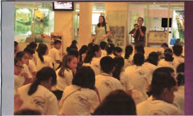
โครงการอนุรักษ์พันธุกรรมพืชอันเนื่องมาจากพระราชดำริ สมเด็จพระเทพรัตนราชสุดาฯ สยามบรมราชกุมารี ค่ายเยาวชน ความหลากหลายทางชีวภาพและการอนุรักษ์ทรัพยากรธรรมชาติระหว่างวันที่ 26 - 31 มีนาคม 2556 นิเวศวิทยาสัตว์ในสภาพพื้นที่เพาะเลี้ยง