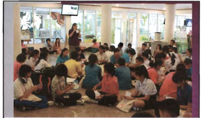
โครงการอนุรักษ์พันธุกรรมพืชอันเนื่องมาจากพระราชดำริ สมเด็จพระเทพรัตนราชสุดาฯ สยามบรมราชกุมารี ค่ายเยาวชน ความหลากหลายทางชีวภาพและการอนุรักษ์ทรัพยากรธรรมชาติระหว่างวันที่ 26 - 31 มีนาคม 2556