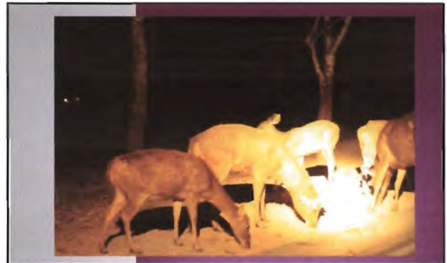
โครงการอนุรักษ์พันธุกรรมพืชอันเนื่องมาจากพระราชดำริ สมเด็จพระเทพรัตนราชสุดาฯ สยามบรมราชกุมารี ค่ายเยาวชน ความหลากหลายทางชีวภาพและการอนุรักษ์ทรัพยากรธรรมชาติระหว่างวันที่ 26 - 31 มีนาคม 2556 พฤติกรรมของสัตว์กลางคืน (After Dark - Night Safari)