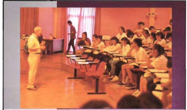
โครงการอนุรักษ์พันธุกรรมพืชอันเนื่องมาจากพระราชดำริ สมเด็จพระเทพรัตนราชสุดาฯ สยามบรมราชกุมารี ค่ายเยาวชน ความหลากหลายทางชีวภาพและการอนุรักษ์ทรัพยากรธรรมชาติระหว่างวันที่ 26 - 31 มีนาคม 2556