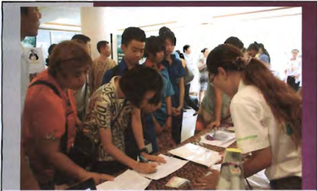
โครงการอนุรักษ์พันธุกรรมพืชอันเนื่องมาจากพระราชดำริ สมเด็จพระเทพรัตนราชสุดาฯ สยามบรมราชกุมารี ค่ายเยาวชน ความหลากหลายทางชีวภาพและการอนุรักษ์ทรัพยากรธรรมชาติระหว่างวันที่ 26 - 31 มีนาคม 2556