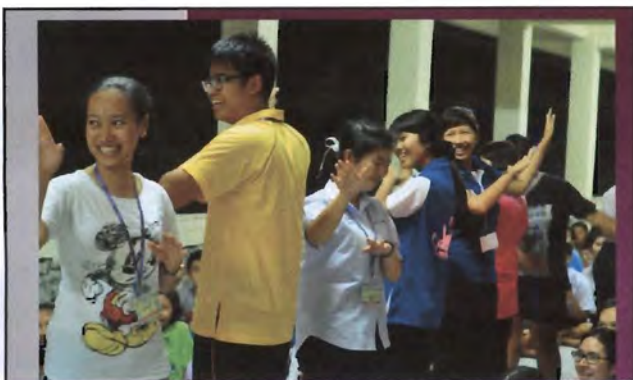
โครงการอนุรักษ์พันธุกรรมพืชอันเนื่องมาจากพระราชดำริ สมเด็จพระเทพรัตนราชสุดาฯ สยามบรมราชกุมารี ค่ายเยาวชน ความหลากหลายทางชีวภาพและการอนุรักษ์ทรัพยากรธรรมชาติระหว่างวันที่ 26 - 31 มีนาคม 2556