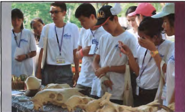
โครงการอนุรักษ์พันธุกรรมพืชอันเนื่องมาจากพระราชดำริ สมเด็จพระเทพรัตนราชสุดาฯ สยามบรมราชกุมารี ค่ายเยาวชน ความหลากหลายทางชีวภาพและการอนุรักษ์ทรัพยากรธรรมชาติระหว่างวันที่ 26 - 31 มีนาคม 2556 นิเวศวิทยาสัตว์ในสภาพพื้นที่เพาะเลี้ยง