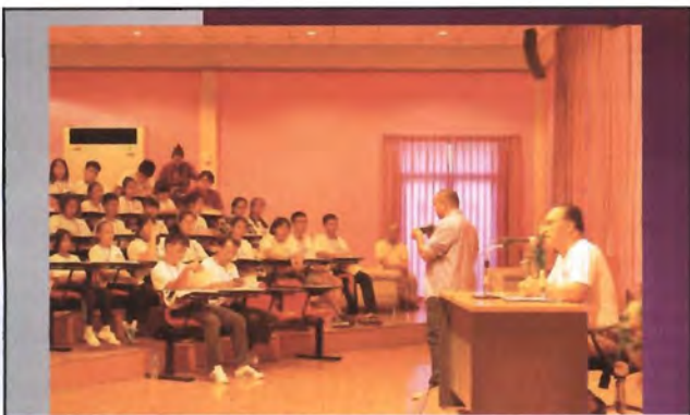
โครงการอนุรักษ์พันธุกรรมพืชอันเนื่องมาจากพระราชดำริ สมเด็จพระเทพรัตนราชสุดาฯ สยามบรมราชกุมารี ค่ายเยาวชน ความหลากหลายทางชีวภาพและการอนุรักษ์ทรัพยากรธรรมชาติระหว่างวันที่ 26 - 31 มีนาคม 2556