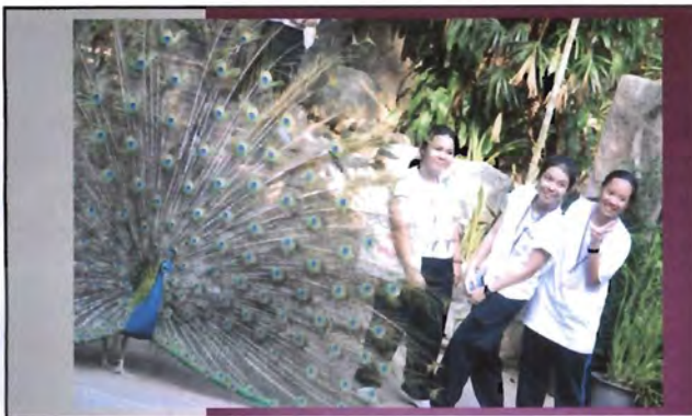
โครงการอนุรักษ์พันธุกรรมพืชอันเนื่องมาจากพระราชดำริ สมเด็จพระเทพรัตนราชสุดาฯ สยามบรมราชกุมารี ค่ายเยาวชน ความหลากหลายทางชีวภาพและการอนุรักษ์ทรัพยากรธรรมชาติระหว่างวันที่ 26 - 31 มีนาคม 2556 นิเวศวิทยาสัตว์ในสภาพพื้นที่เพาะเลี้ยง