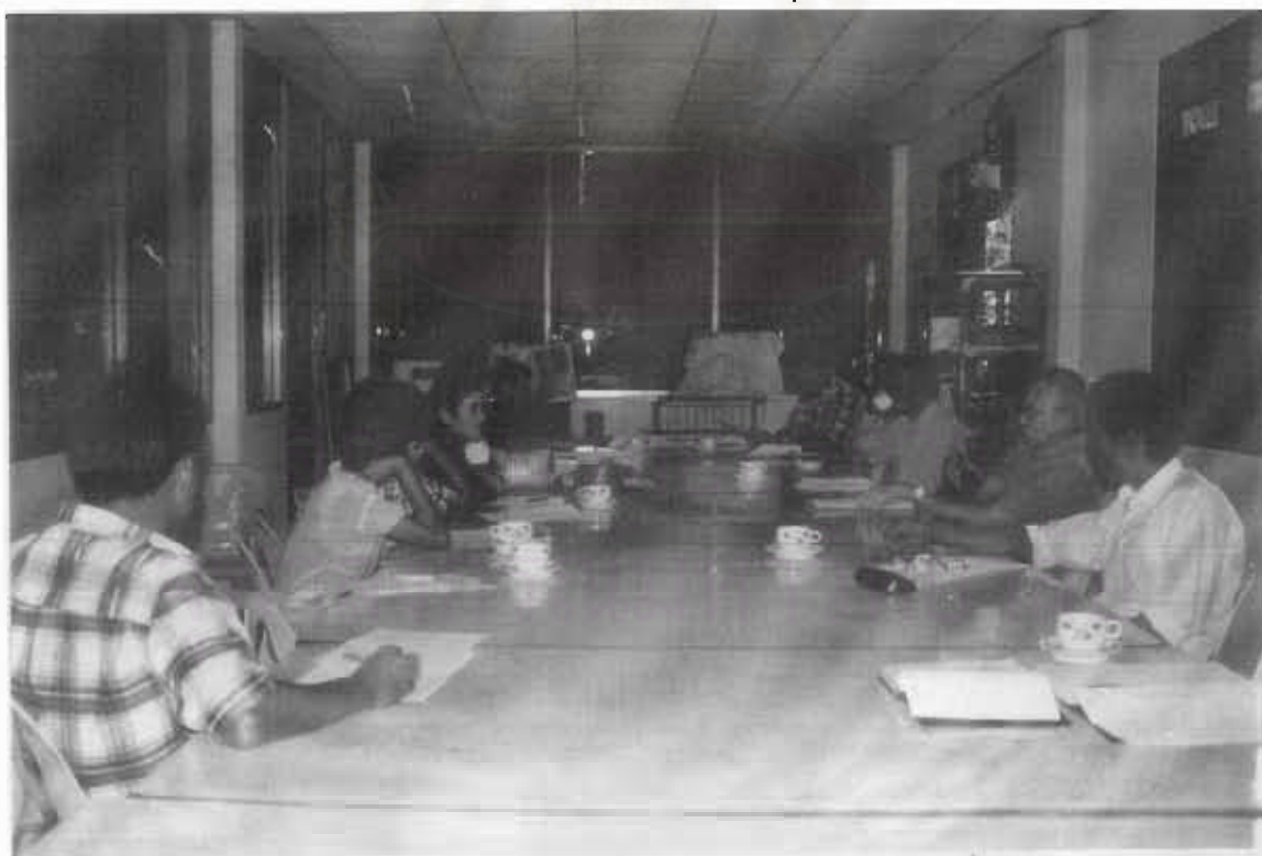
บรรยากาศการประชุมระหว่างตัวแทนกรรมการชมรมการท่องเที่ยวฯ กับ ททท.

วันที่ 13 ม.ค. 2542 ณ ห้องประชุมที่ทำการ อบต.กำโลน