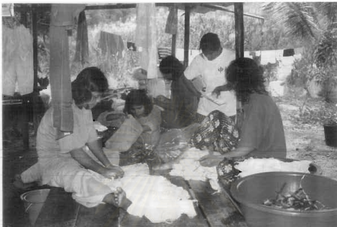
วงสนทนาระหว่างการดำเนินงานของสมาชิกกลุ่มมัดย้อมผ้าสีธรรมชาติ