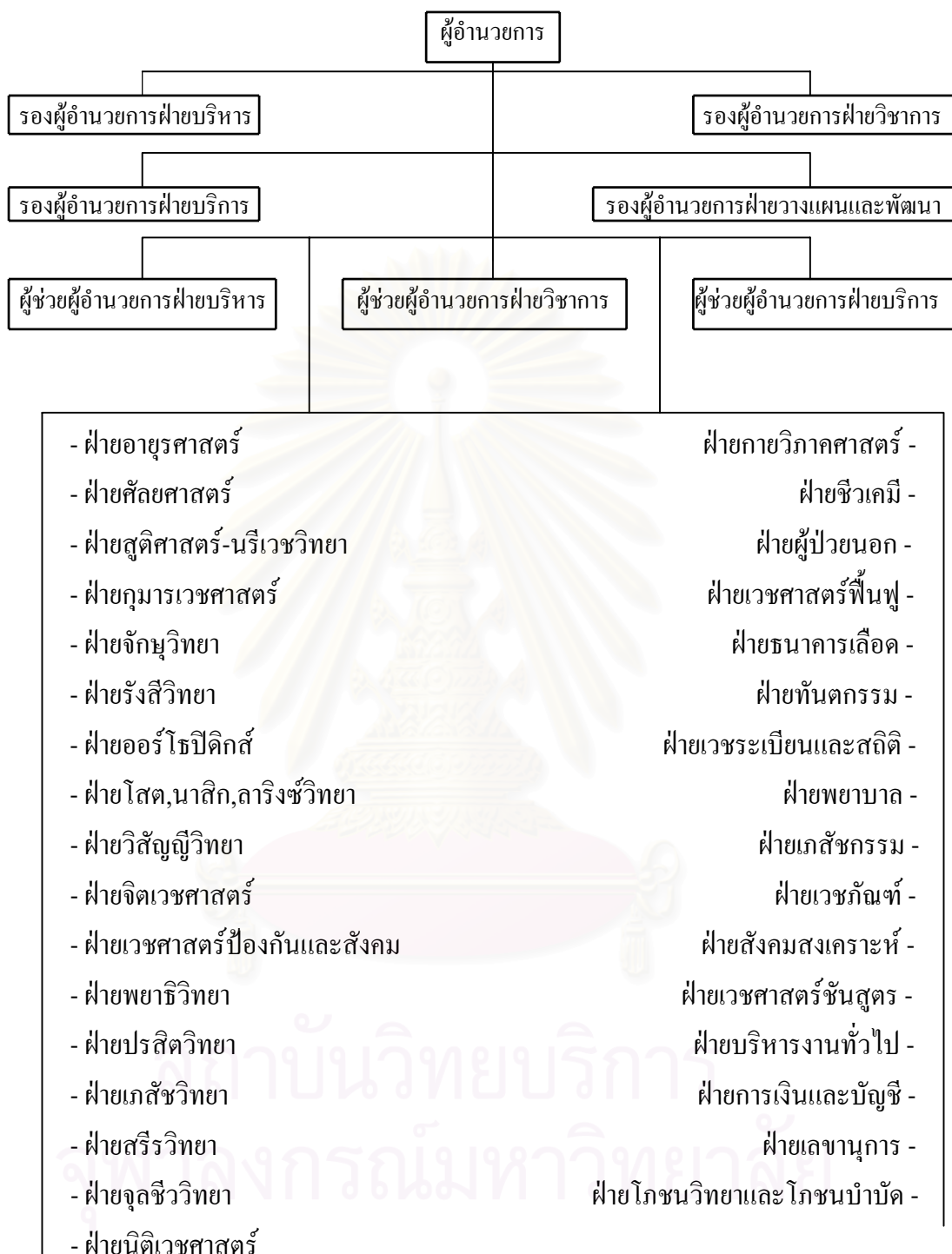
แผนภูมิที่ 3.1 แสดงโครงสร้างการบริหารงานโรงพยาบาลจุฬาลงกรณ์