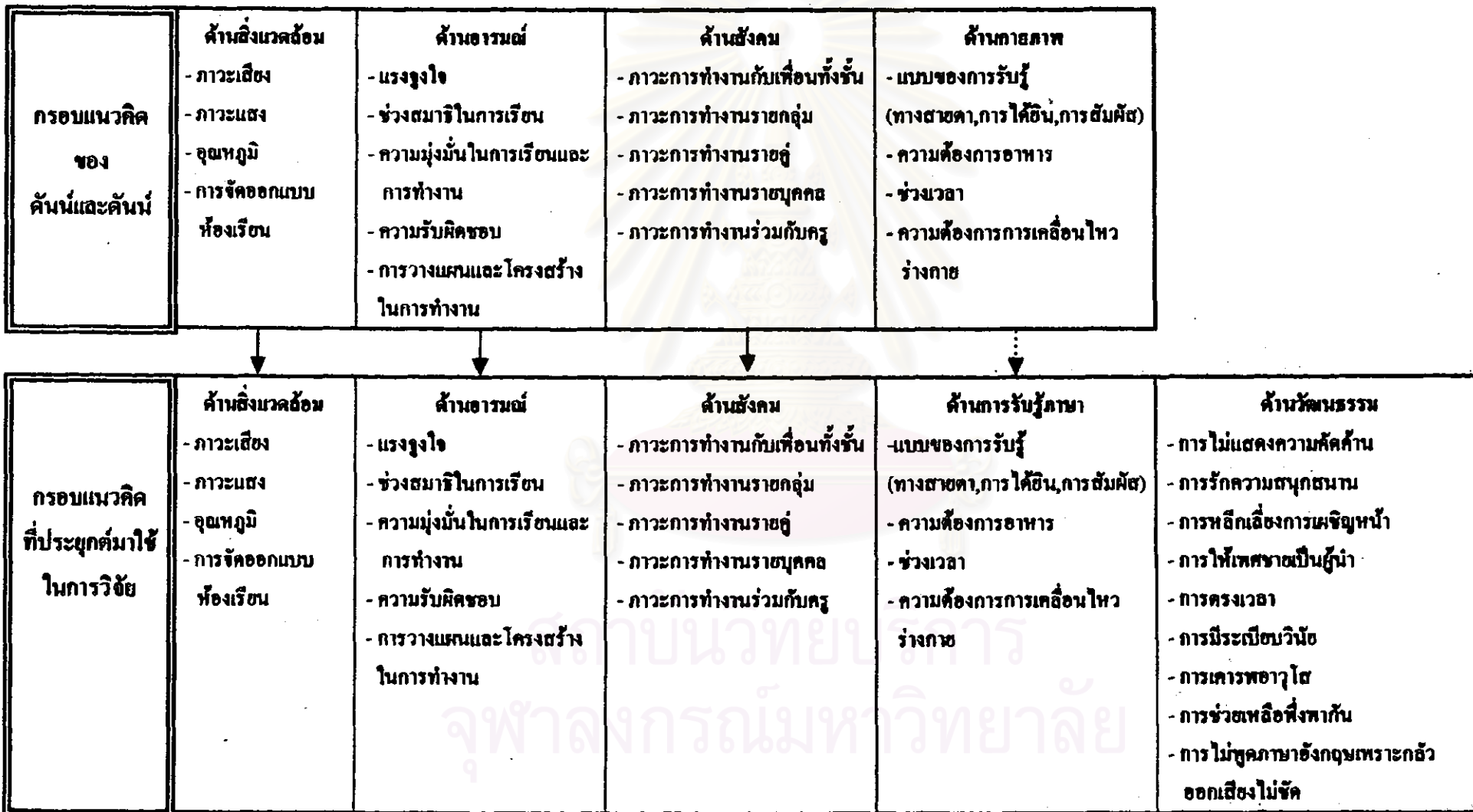
แผนภูมิที่ 1 กรอบแนวคิดแบบการเขียนของคัมน์ และ คัมน์ และกรอบแนวคิดแบบการเขียนภาษาอังกฤษที่ประยุกต์มาใช้ในการวิจัย

ตอนต้นกลาง สถาบันวิทยบริการ จุฬาลงกรณ์มหาวิทยาลัย