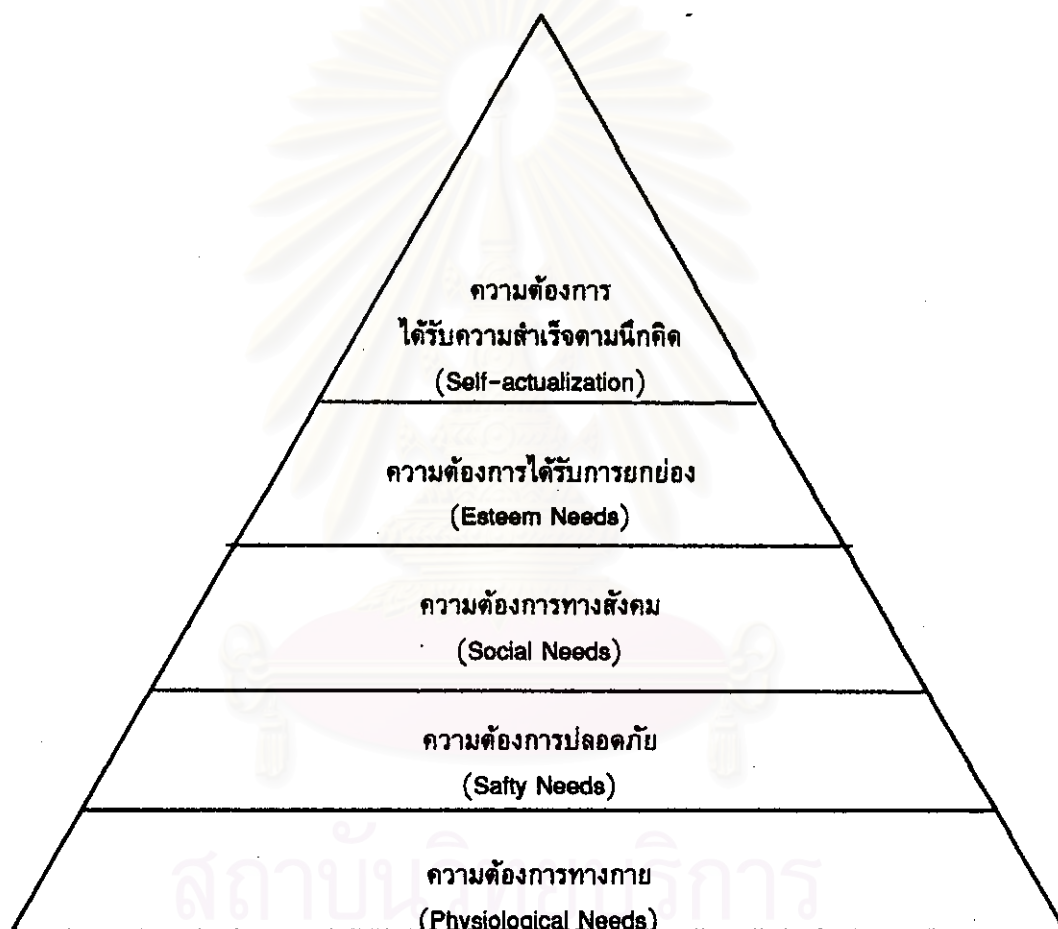
ภาพที่ 2.1 แสดงความต้องการตามทฤษฎีของ Maslow

ความต้องการทั้งหมดนี้ แสดงเป็นภาพปิรามิดได้ดังภาพที่ 2.1