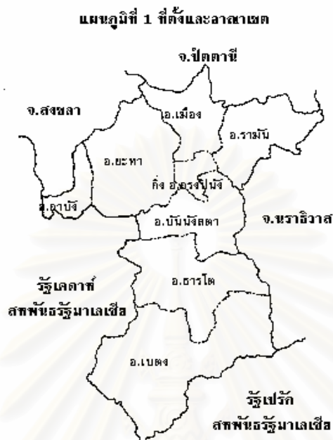
ภาพที่ 2 แสดงที่ตั้งและอาณาเขตจังหวัดยะลา