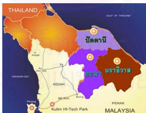
รูปที่ 1 แสดง พื้นที่สามจังหวัดชายแดนภาคใต้

ในส่วนของสามจังหวัดชายแดนภาคใต้ มีอาณาเขตติดต่อกับ บริเวณตอนเหนือของรัฐปะลิส เคดาห์ (ไทรบุรี) เปรัก และกลันตัน ของมาเลเซีย โดย อำเภอดากไบ อำเภอสูโหลงโกลก และอำเภอเวียง จังหวัดนราธิวาสทางทิศใต้ ติดต่อกับรัฐกลันตันและเปรัก มีแม่น้ำโกลกเป็นเส้นกั้นเขตแดน มีทางรถไฟข้ามแดนไทย - มาเลเซีย ที่อำเภอสูโหลงโกลก อำเภอเบตง บันนังสตา และอำเภอยะหา ของ จังหวัดยะลา ติดต่อกับรัฐเคดาห์ และเปรัก โดยมีภูเขาสันปันน้ำเป็นแนวเขตแดน มีทางรถยนต์เชื่อมต่อระหว่างไทย-มาเลเซีย ที่ อำเภอเบตง