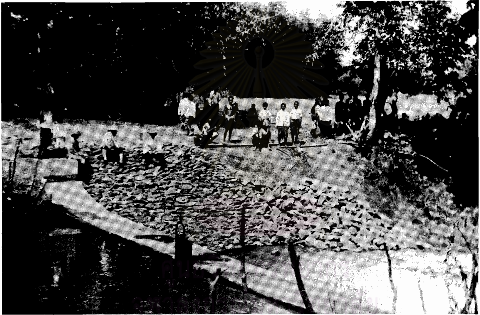
ผ่านคลองลำปวนน้อย 1