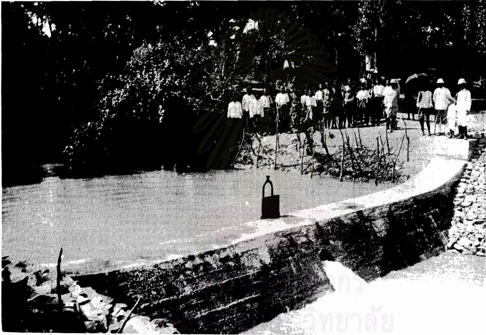
ท่านคลองลำปรุน้อย 1