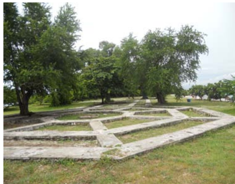
ศาลเจ้าพ่อเจ้าใหญ่